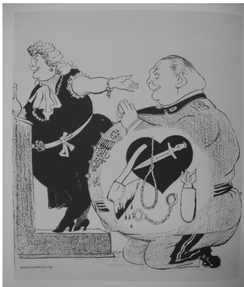
Рис. 3. Карикатура из части VI. Нюрнбергский процесс 299 .