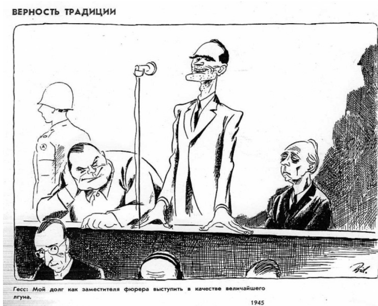
Рис. 2. Карикатура «Верность традиции» 298 .