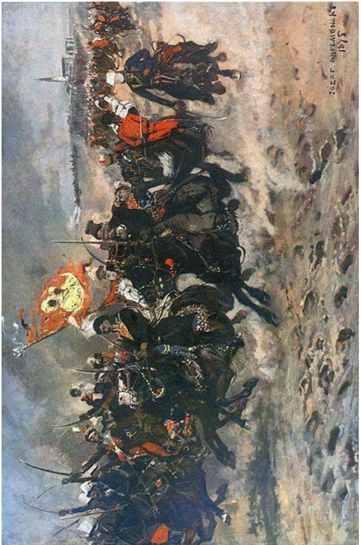
Сражение под крепостью Ченстохово, последнего оплота конфедератов, 7 августа 1772 г. С картины Юзефа Хелмоньского «Казимеж Пулавский под Ченстоховой» (1875).