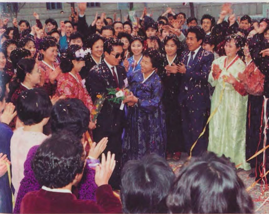
Девушка выходит замуж за инвалида-воина, потерявшего зрение в борьбе за Родину. В Корее такой поступок считается благородным.