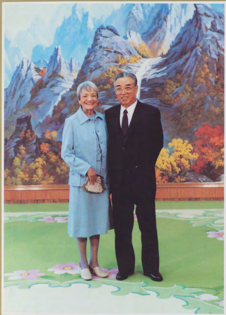
Президент Ким Ир Сен сфотографировался вместе с автором на память.