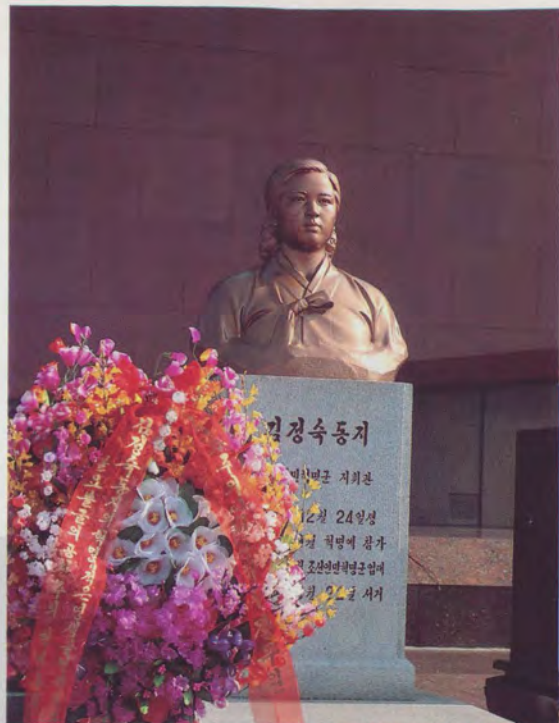
Бюст героини анти- японской войны това- рища Ким Чен Сук, установленный на Мемо- риальном кладбище революционеров.