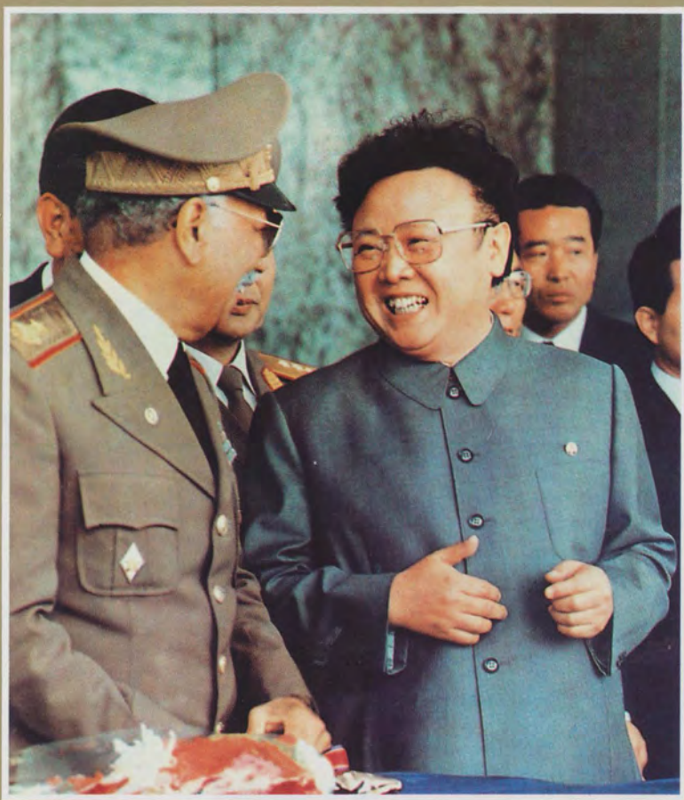
Верховный Главнокомандующий Корейской Народной Армии товарищ Ким Чен Ир на трибуне военного парада, посвященного 60-летию основания КНА.