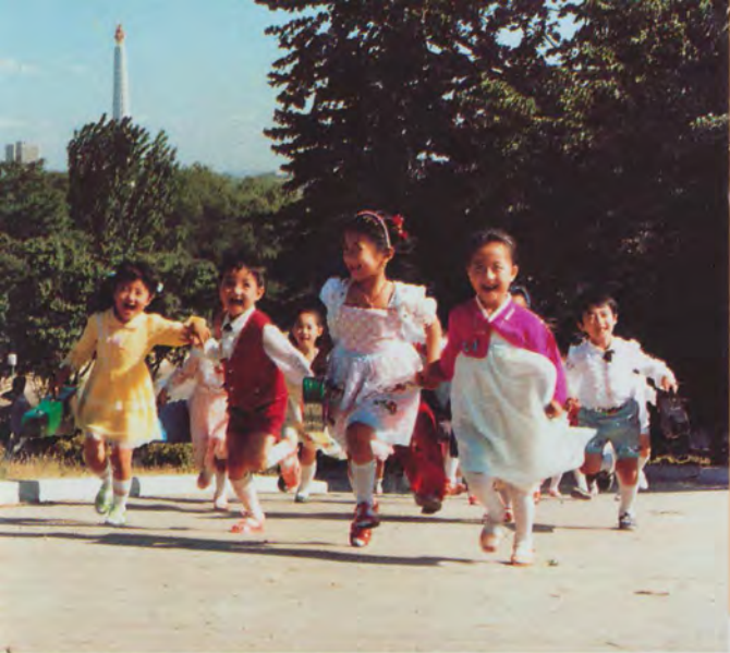
Счастливая детвора Кореи.