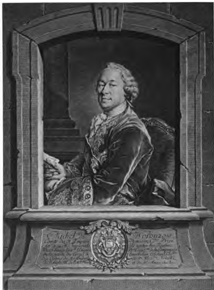
Print par L. Torquei en 1717