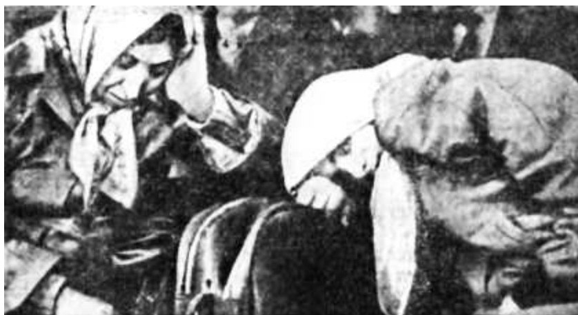
Томительны для эмигрантов часы ожидания

Назревающий скандал заставил правительство публично выразить озабоченность этой ситуацией и даже пойти на создание специальной комиссии. Ее возглавил сэр Генри Йеллоуис, один из руководителей министерства здравоохранения и социального обеспечения. Несмотря на точку зрения Всемирной организации здравоохранения о том, что проводить рентгеноскопию в немедицинских целях недопустимо 19 , комиссия Йеллоуиса заняла иную позицию. Основным составителем доклада, высокопоставленный чиновник министерства здравоохранения и социального обеспечения Джон Эванс, утверждал, что с помощью рентгена можно «со значительной степенью точности» определить возраст человека, чей организм находится в стадии роста. В докладе содержались и указания на то, что, разумеется, рентгеноскопия должна производиться специалистами.