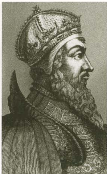
Польский король Сигизмунд II Август. Гравюра XVI в.