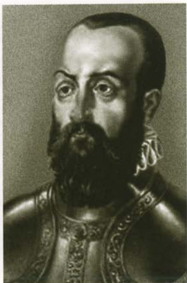
Готтард Кетлер, последний магистр Ливонского ордена