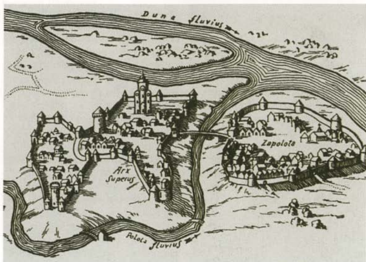
Полоцк. Гравюра XVI в.

Развалины орденского замка и крепости Феллин, в осаде которой в 1560 году принимал участие Андрей Курбский. Современное фото