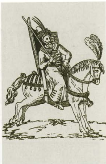
Конный воин Великого княжества Литовского. Гравюра XVI в.