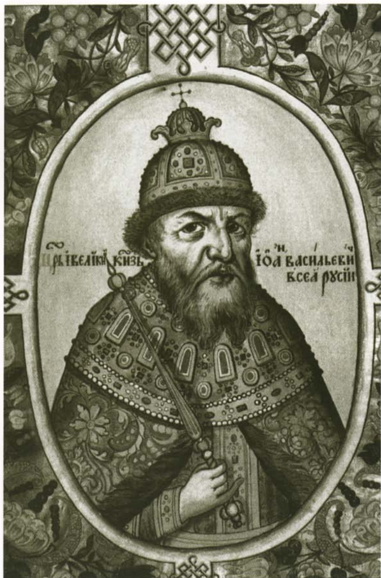
Царь Иван Васильевич Грозный. Портрет из «Титулярника». Вторая половина XVII в.