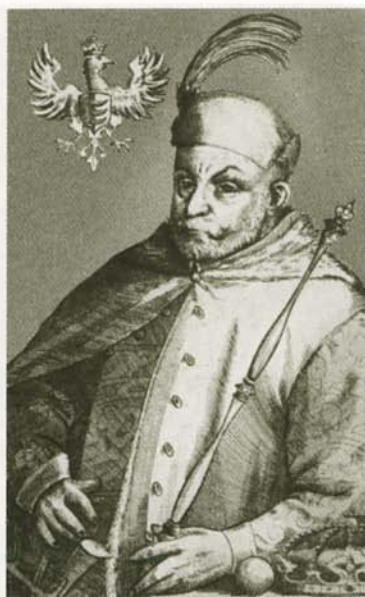
Польский король Стефан Баторий. Гравюра XVI в.

Варшава. Польская раскрашенная гравюра XVI—XVII вв.