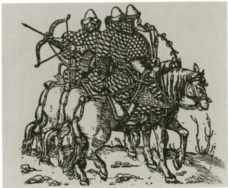
Русская поместная конница. Немецкая гравюра XVI в. из «Записок о Московии» Сигизмунда Герберштейна