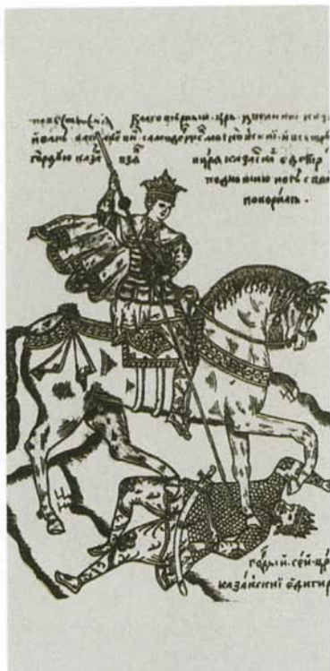
Царь Иван IV Грозный поражает казанского хана Едигера. Миниатюра из «Казанской истории», список XVII в.