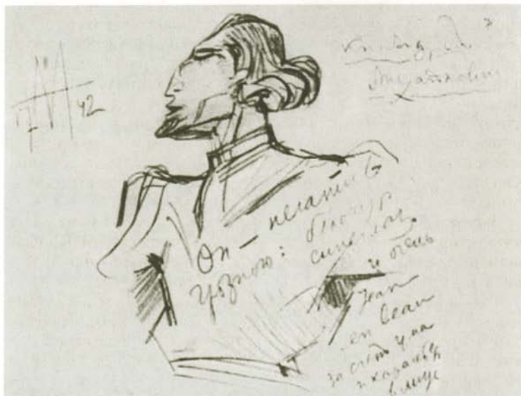
Князь Андрей Курбский. Рисунок С. Эйзенштейна