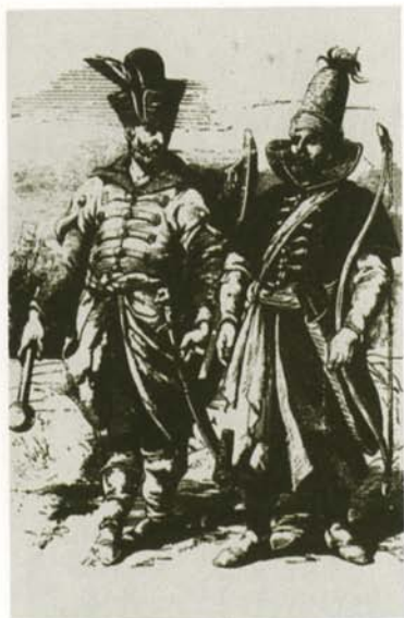
Воины Великого княжества Литовского. Гравюра XVI в.