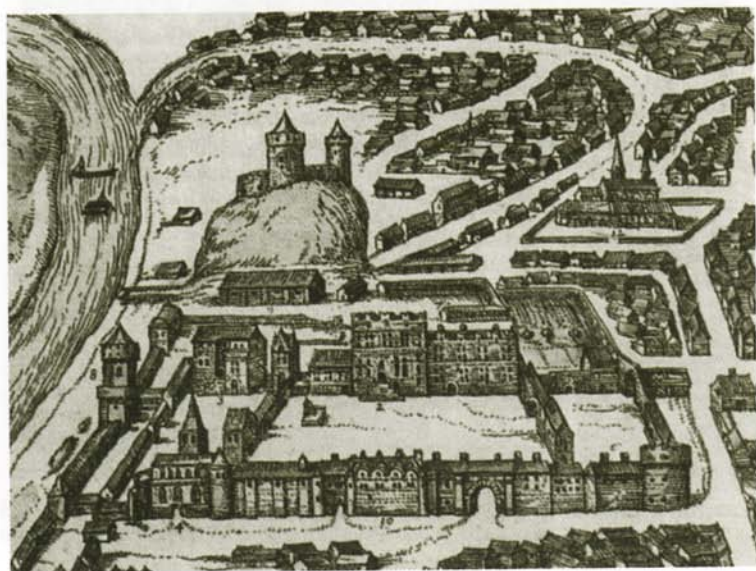
Столица Великого княжества Литовского Вильно. Гравюра XVI в.