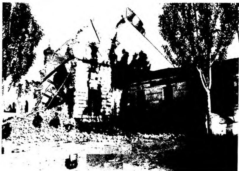
Рис. 8. Тюремный замок с церковью в г. Верном после землетрясения. Фотография 1887 г.