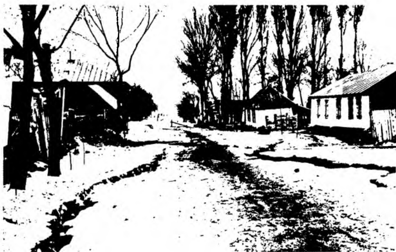
Рис. 26. Вид улицы г. Верного с трещинами, образовавшимися во время землетрясения. Фотография 1911 г.