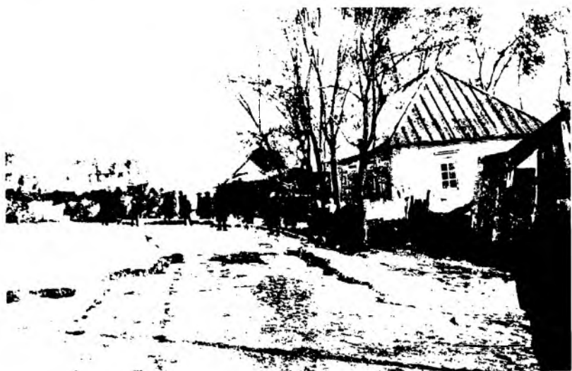
Рис. 27. Виды улиц г. Верного после землетрясения. Фотография 1911 г.