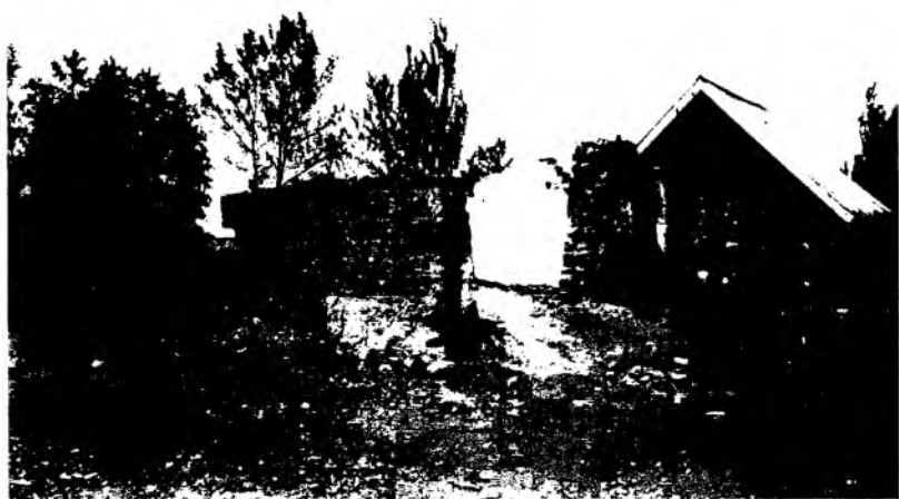
Рис. 15. Жилой дом, разрушенный землетрясением. Селение Сазановское. 1887 г.