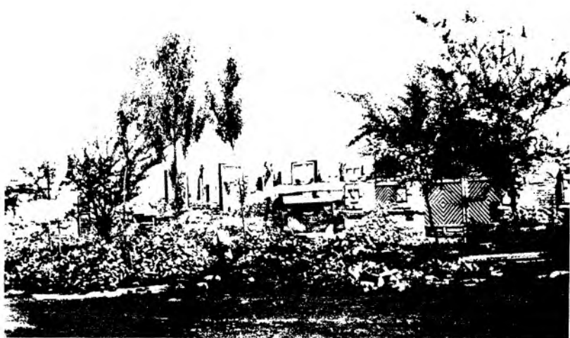
Рис. 7. Здание в г. Верном, разрушенное землетрясением, в котором уцелели только деревянные части. 1887 г.