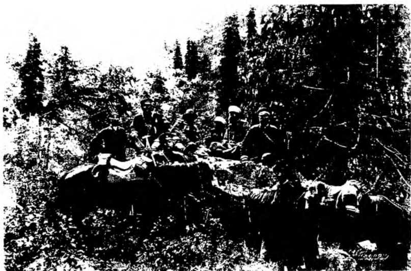
Рис. 19. Участники научной экспедиции под руководством И. В. Мушкетова в долине р. Иссык. 1887 г.