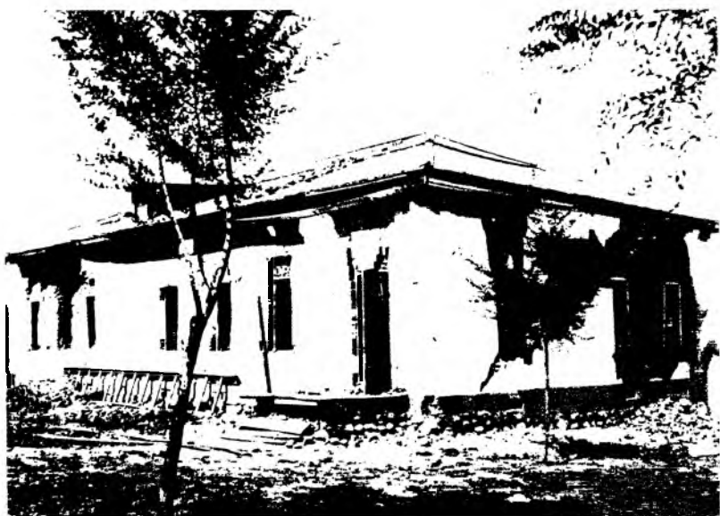
Рис. 16. Здание, разрушенное землетрясением. Выселок Любовный (Каскелен). 1887 г.