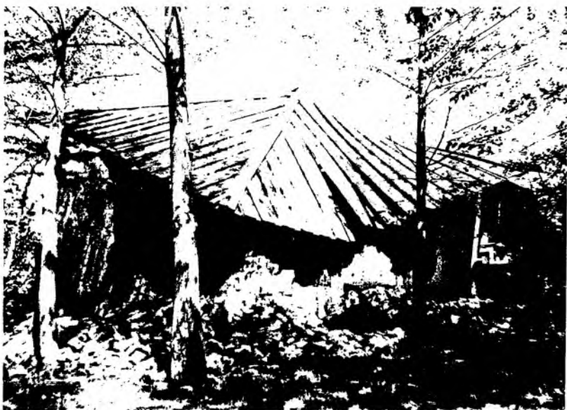
Рис. 14. Наиболее разрушенные здания в г. Верном. 1887 г.