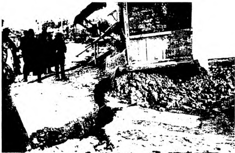
Рис. 23. Вид улицы в г. Верном после землетрясения. Фотография 1911 г.