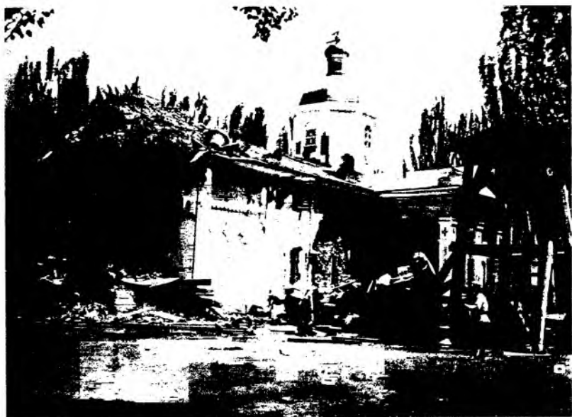
Рис. 5. Здание кафедрального собора в г. Верном после землетрясения. Фотография 1887 г.