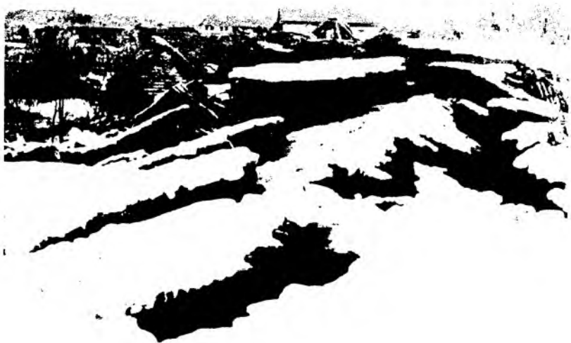
Рис. 28. Широкие трещины на окраинах г. Верного, образовавшиеся во время землетрясения. Фотография 1911 г.