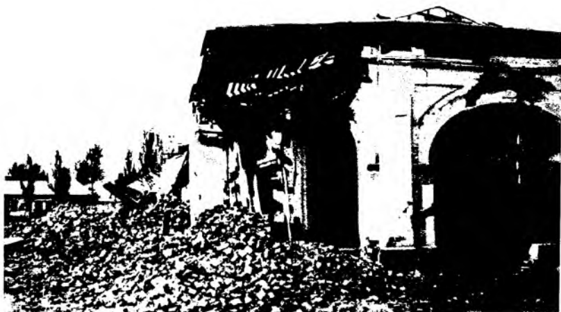
Рис. 4. Лавки Гостиного двора в г. Верном после землетрясения. Фотография 1887 г.