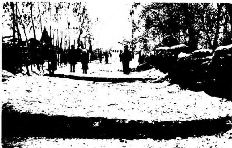
Рис. 21. Улица в г. Верном после землетрясения 22 декабря 1910 г. Фотография 1911 г.