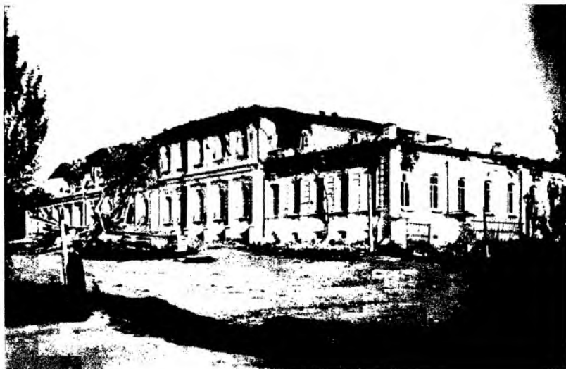
Рис. 1. Дом военного губернатора Семиреченской области после землетрясения 28 мая 1887 г. Фотография 1887 г.