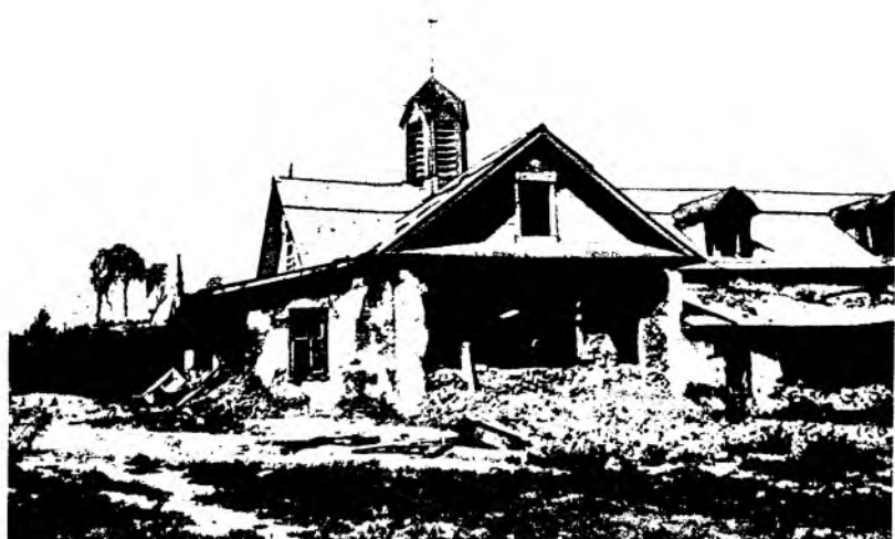
Рис. 11. Виды улиц г. Верного после землетрясения. 1887 г.