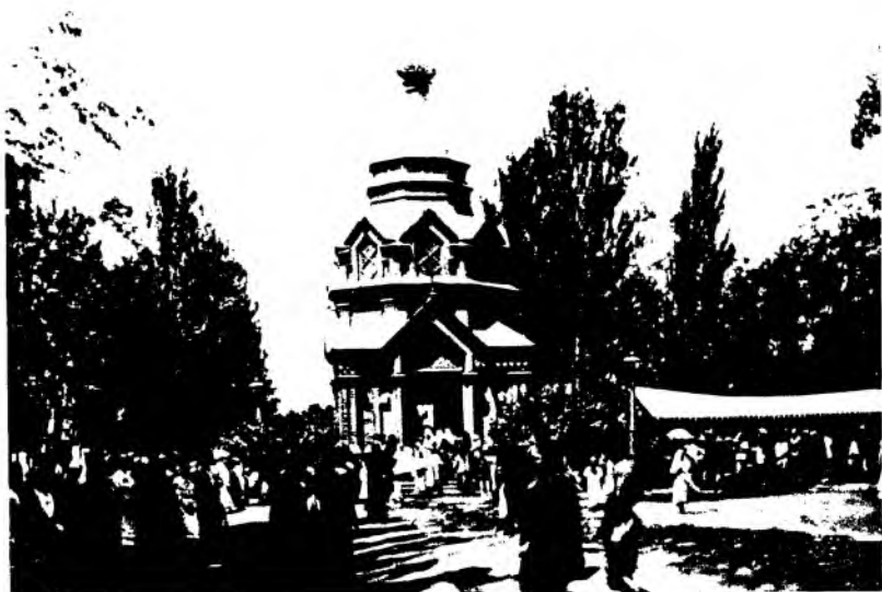
Рис. 20. Знаменская часовня в г. Верном в память о землетрясении 28 мая 1887 г. Архитектор П. В. Гурде. 1888 г. Фотография конца XIX в.