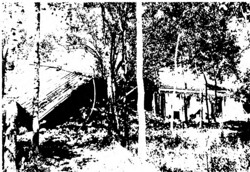
Рис. 12. Архирейская дача в долине р. Малая Алматинка, разрушенная землетрясением. 1887 г.