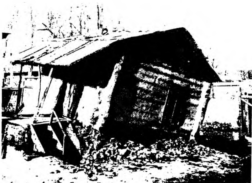
Рис. 22. Кирпичный фундамент деревянного дома в г. Верном, разрушенный землетрясением. Фотография 1911 г.