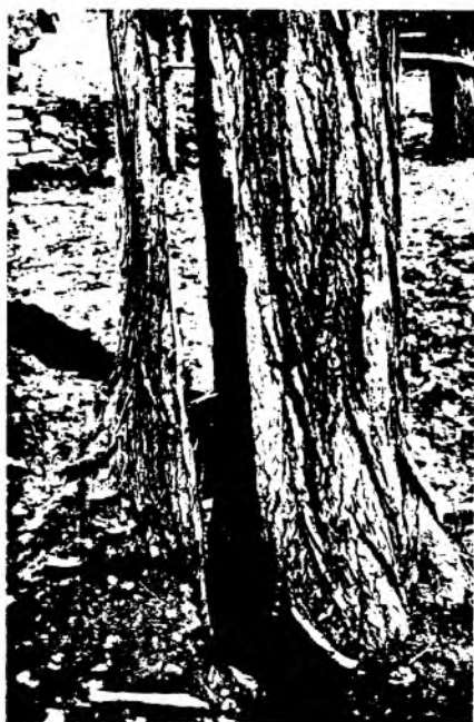
Рис. 25. Дерево, разделенное надвое трещиной, образовавшейся в грунте во время землетрясения. Фотография 1911 г.