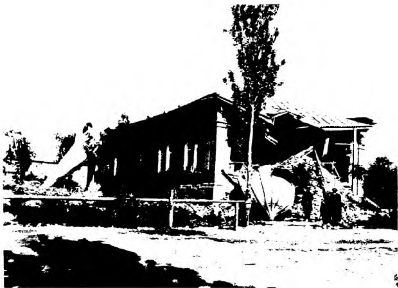
Рис. 6. Здание Татарской мечети в г. Верном после землетрясения. Фотография 1887 г.