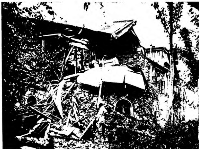
Рис. 10. Архиерейский дом в г. Верном после землетрясения. Фотография 1887 г.