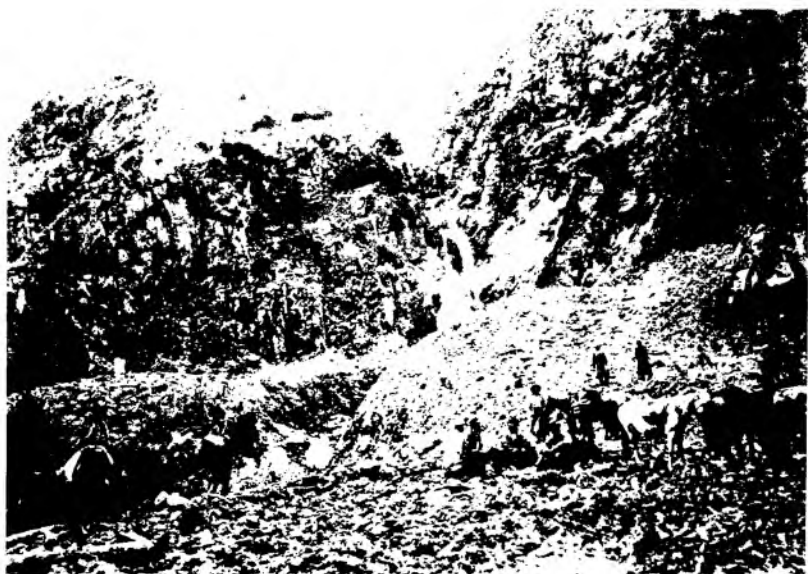
Рис. 18. Обвал на левом порфировом склоне долины р. Большой Алматинки у ярусного водопада. 1887 г.