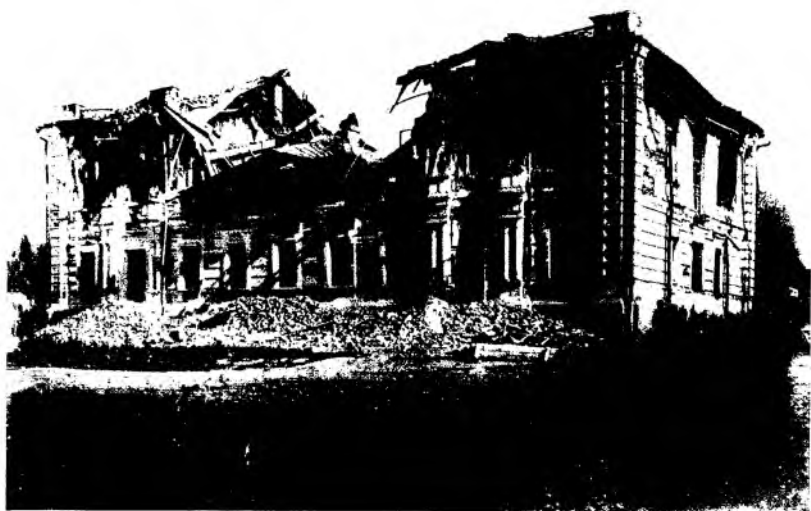
Рис. 3. Здание Верненской женской гимназии после землетрясения. Фотография 1887 г.