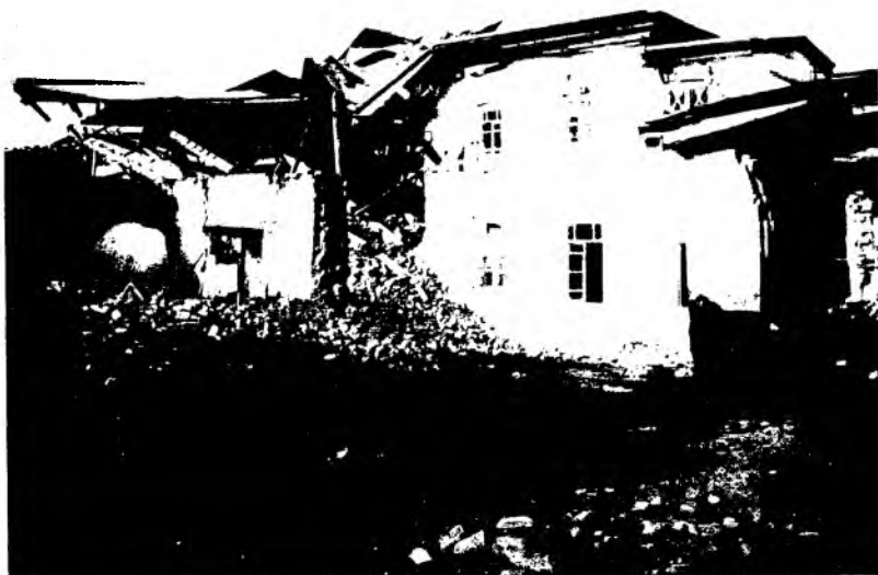
Рис. 2. Здание военного собрания в г. Верном после землетрясения. Фотография 1887 г.