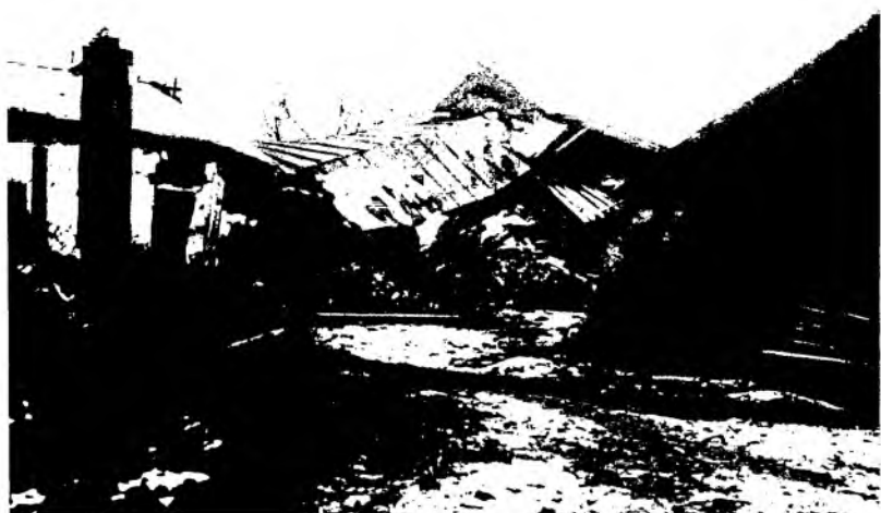
Рис. 24. Жилой дом в г. Верном, разрушенный во время землетрясения. Фотография 1911 г.