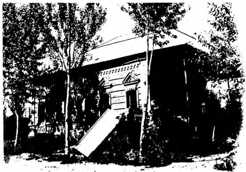
Рис. 13. Жилой дом в г. Верном, разрушенный землетрясением. 1887 г.