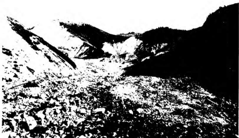
Рис. 17. Обвалы в горах в долине р. Акжар. Фотография С. Ф. Николаи. 1887 г.