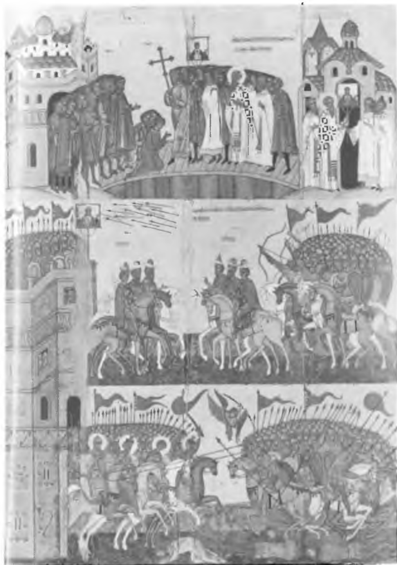
1. Чудо от иконы Знамени Пресвятой Богородицы. Битва новгородцев с суздальцами. Икона. Новгородская школа. XV в.