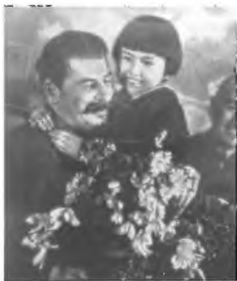
29. Сталин в образе «отца народов» (с Гелией Маркизовой на руках)