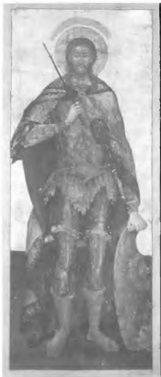
10. Портретная икона Александра Невского. XVIII в.