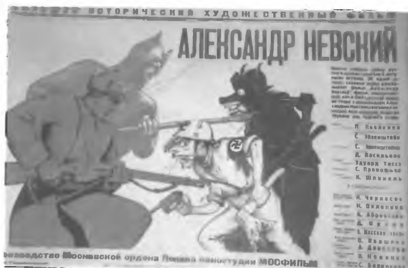
34. Александр Невский. Плакат 1941 г.