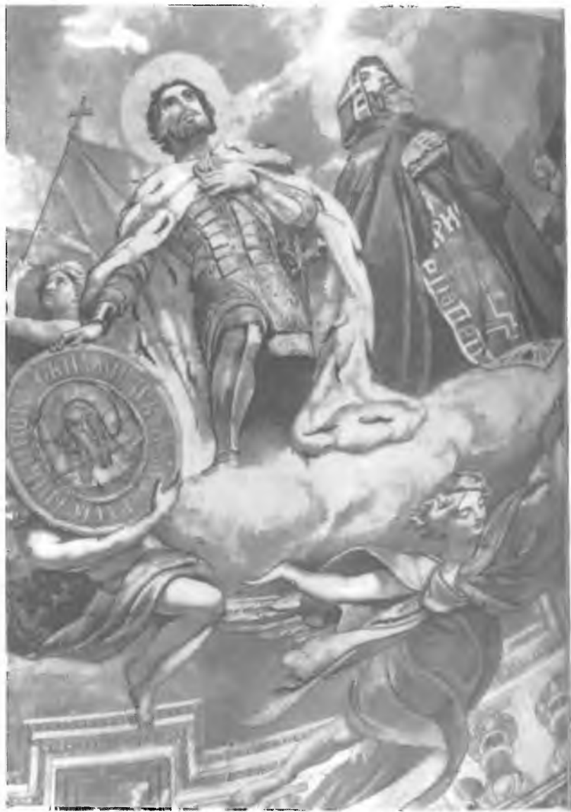
19. Александр Невский и Исаак Далматский. Фрагмент росписи купола Исаакиевского собора в Петербурге (художник — П.В. Бассин). Первая половина XIX в.