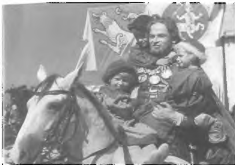
28. Въезд Александра Невского во Псков. Кадр из фильма «Александр Невский» С.М. Эйзенштейна. 1938 г.