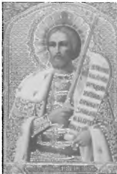
39—42. Современные портретные иконы Александра Невского