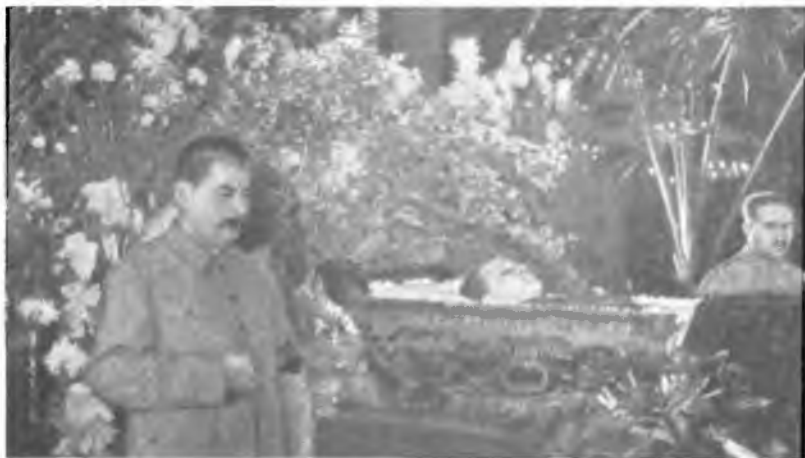
27. И.В. Сталин и Л.М. Каганович у гроба С.М. Кирова.