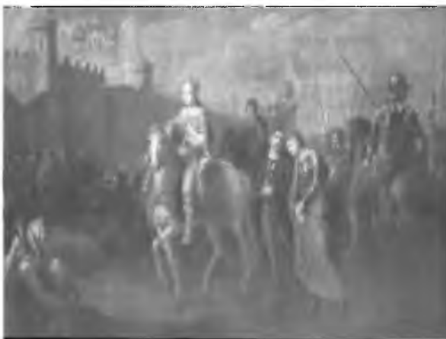
17. Торжественный въезд Александра Невского в город Псков после одержанной им победы над немецкими рыцарями. Картина Г.И. Угрюмова для Троицкого собора Александро-Невской лавры, 1794 г.