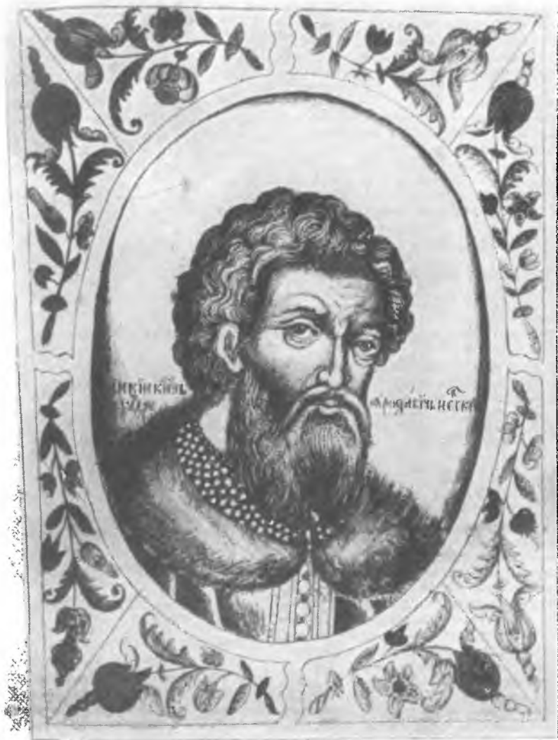
8. Великий князь Александр Ярославич. Изображение в «Титулярнике» 1672 г.