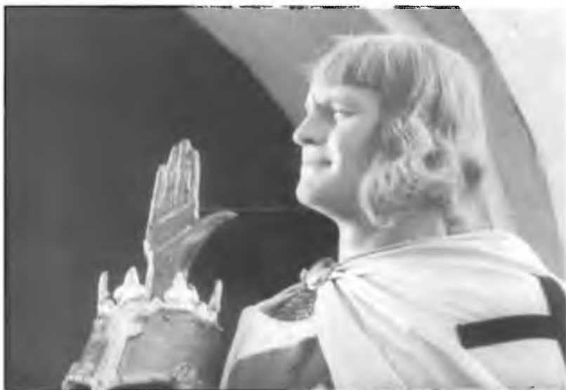
25. Рыцарь Тевтонского ордена.

Кадр из фильма «Александр Невский» С.М. Эйзенштейна. 1938 г.