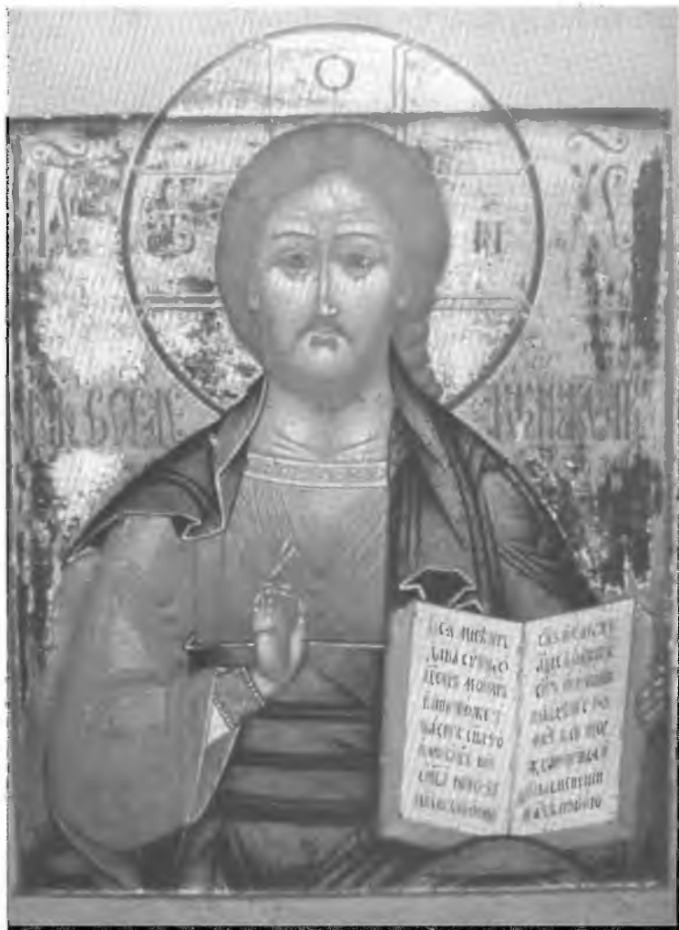
11. Христос Вседержитель