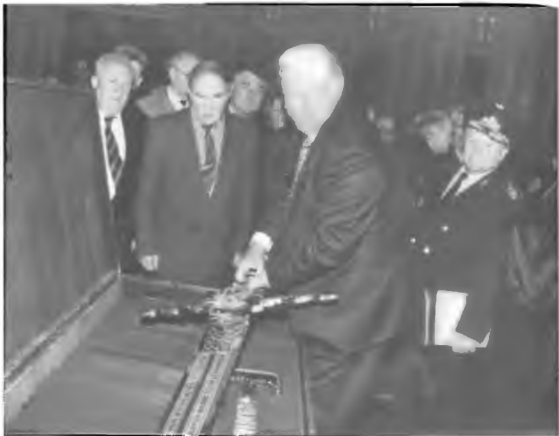
38. Президент Б.Н. Ельцин передает символический «меч Александра Невского» музею Великой Отечественной войны. 3 мая 1995 г.