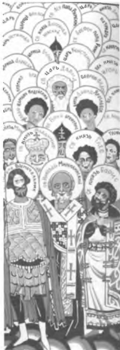
23. Антирелигиозная карикатура из журнала «Безбожник». 1925 или 1926 г.