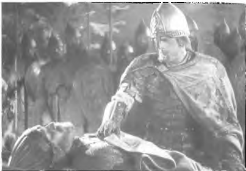
26. Александр Невский прощается с Домашем Твердиславичем. Кадр из фильма «Александр Невский» С.М. Эйзенштейна. 1938 г.