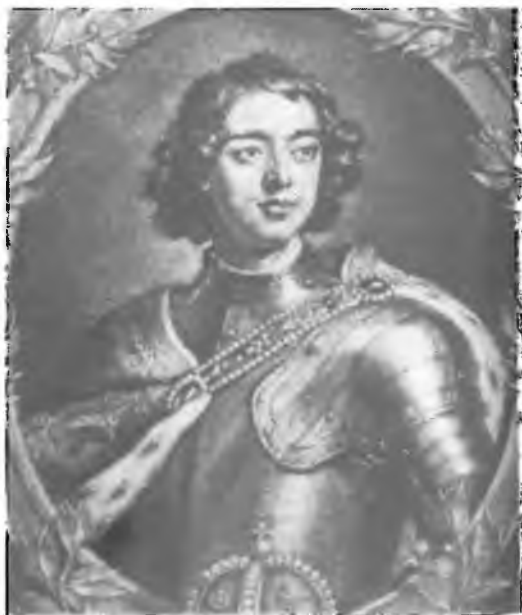
14. Петр Первый. Портрет Г. Кнеллера 1697 г.