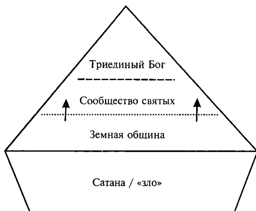
Схема 2: Структура сакрального сообщества

земле в виде мошей. Этот концепт сообщества также отличается трехчастной структурой. На вершине пирамиды стоит триединый Бог. Далеко ниже его следуют святые, в жизни которых открывается верующим присутствие Бога на земле. Базисом пирамиды являются верующие, земные члены религиозного сообщества, обращающиеся в молитве к «своему» заступнику и покровителю перед Богом: