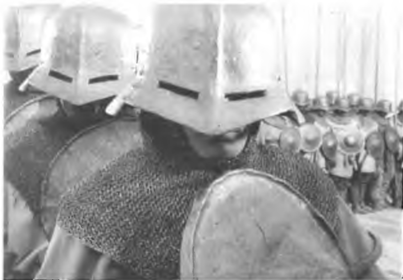
24. Кнехты Тевтонского ордена.

Кадр из фильма «Александр Невский» С.М. Эйзенштейна. 1938 г.