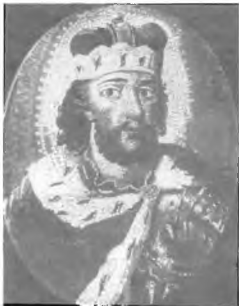
13. Александр Невский. Мозаика работы М.В. Ломоносова 1757/1758 г.