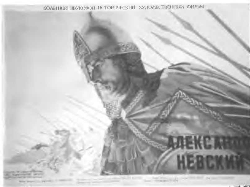
33. Александр Невский. Плакат 1938 г.