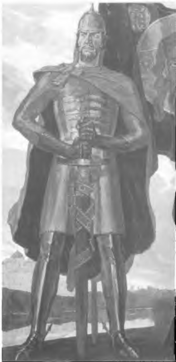
36. Александр Невский. Живописное полотно П.Д. Корина (1942—1943 гг.). Средняя часть триптиха