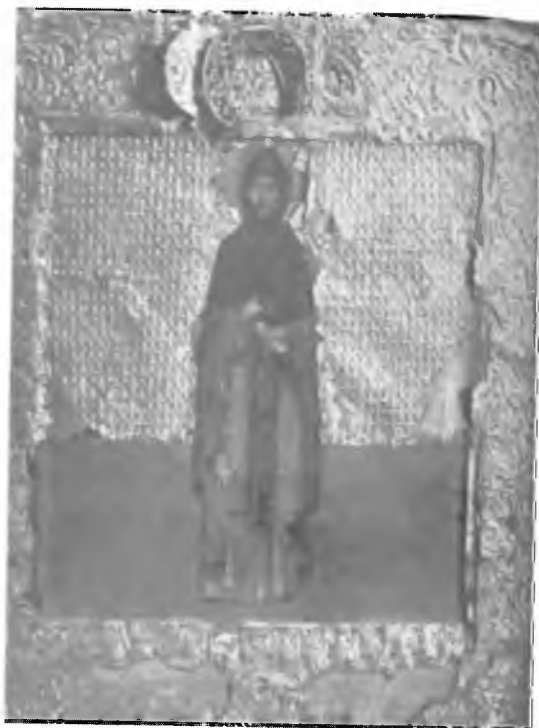
3. Александр Невский в великой схиме. Портретная икона. XVI в.