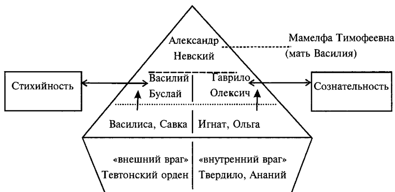
Схема 1: Структура воображаемого сообщества в «Александре Невском»

Немецкий кинокритик Хельмут Фербер написал в 1967 г., что Эйзенштейн в «Александре Невском» «экранизировал не только средневековый сюжет, но и средневековый образ мысли» 269 . Фильм и в самом деле вызывает ассоциации со средневековой иконописью и фресковой живописью 270 . Он создает статическую картину, где каждой фигуре отведено вполне определенное место. Сообщество, воображенное в «Александре Невском», устроено иерархически, в нем обнаруживается три отделенных друг от друга уровня. На вершине стоит Александр Невский, вождь и отец. На следующей ступени — два героя-«сына», Василий и Гаврило. От них перекинут мостик к нижней ступени, народу, «большой семье», представленной ремесленником Игнатом, рыбаком и крестьянином Савкой, а также женскими персонажами Василисой и Ольгой. Сообщество отграничено «внешним врагом» — Тевтонским орденом и «внутренним врагом» в лице предателей Твердилы и Анания: