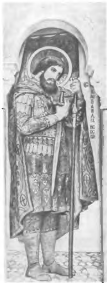
18. Святой Александр Невский. Эскиз портретной иконы для иконостаса Владимирского собора в Киеве В.М. Васнецова. 1884/1885 г.