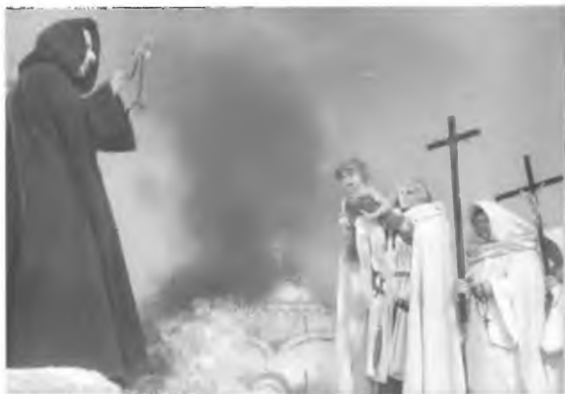
31. «Черная месса» рыцарей Тевтонского ордена во Пскове. Кадр из фильма «Александр Невский» С.М. Эйзенштейна. 1938 г.