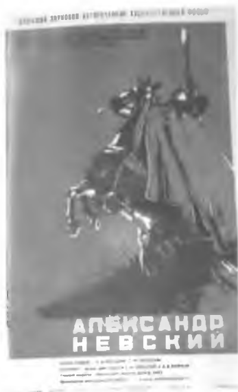
32. Александр Невский. Плакат 1938 г.