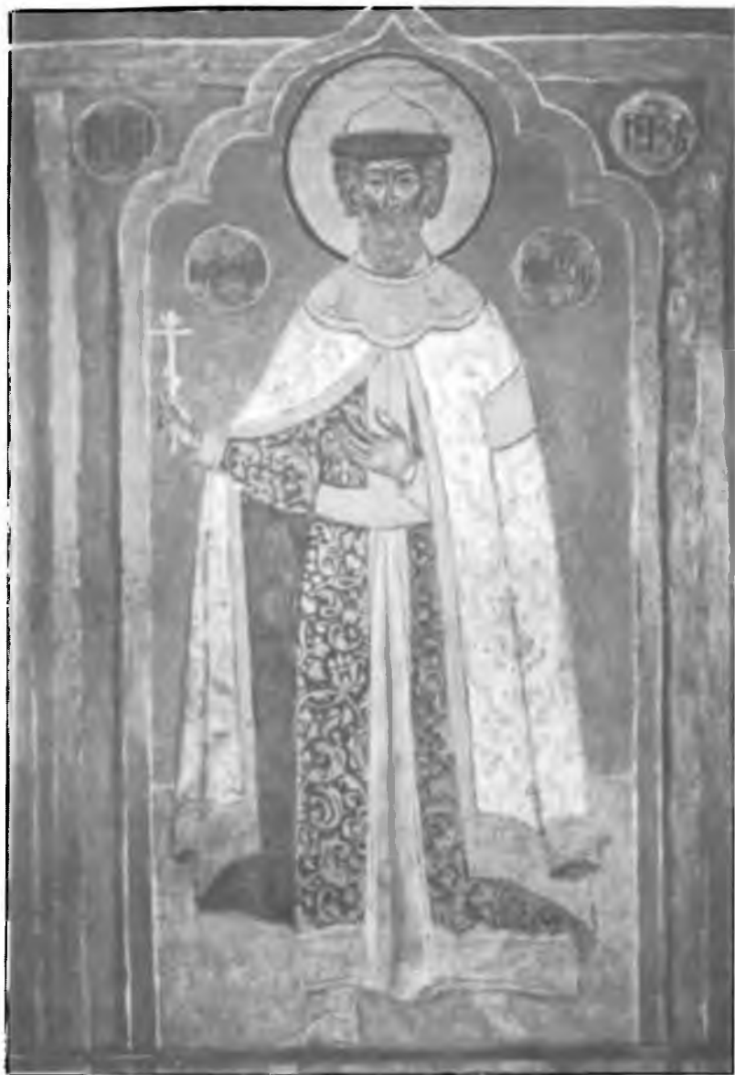
6. Великий князь Александр Ярославич. Фрески в Архангельском соборе Московского Кремля. 60-е годы XVI в. Сегодняшний вид — с XVII в.