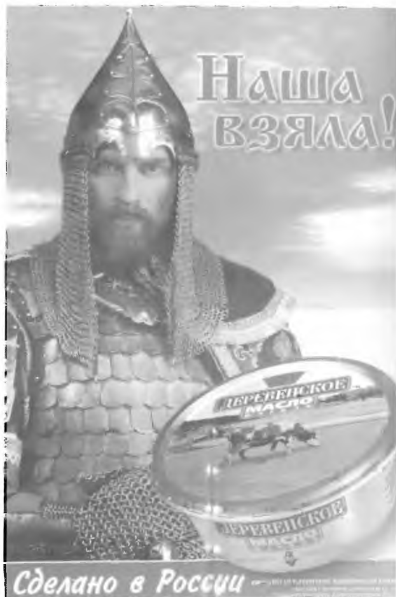
43. Рекламный плакат. Петербургский маргариновый комбинат. 1999 г.