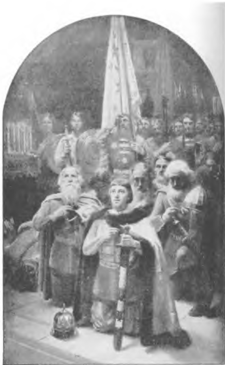
21. Александр Невский с новгородцами молится перед битвой. Иллюстрация из учебника по истории. Конец XIX в.