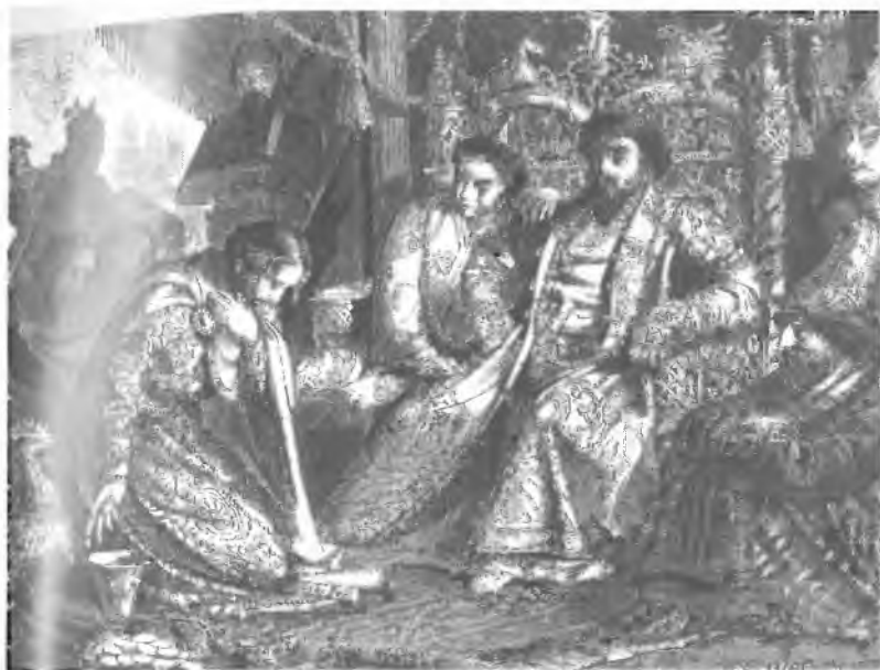
20. Александр Невский умоляет хана пощадить землю русскую. Иллюстрация В.В. Верещагина для книги «Русская история в картинах» Н.А. Дементьева. 1863—1871 гг.