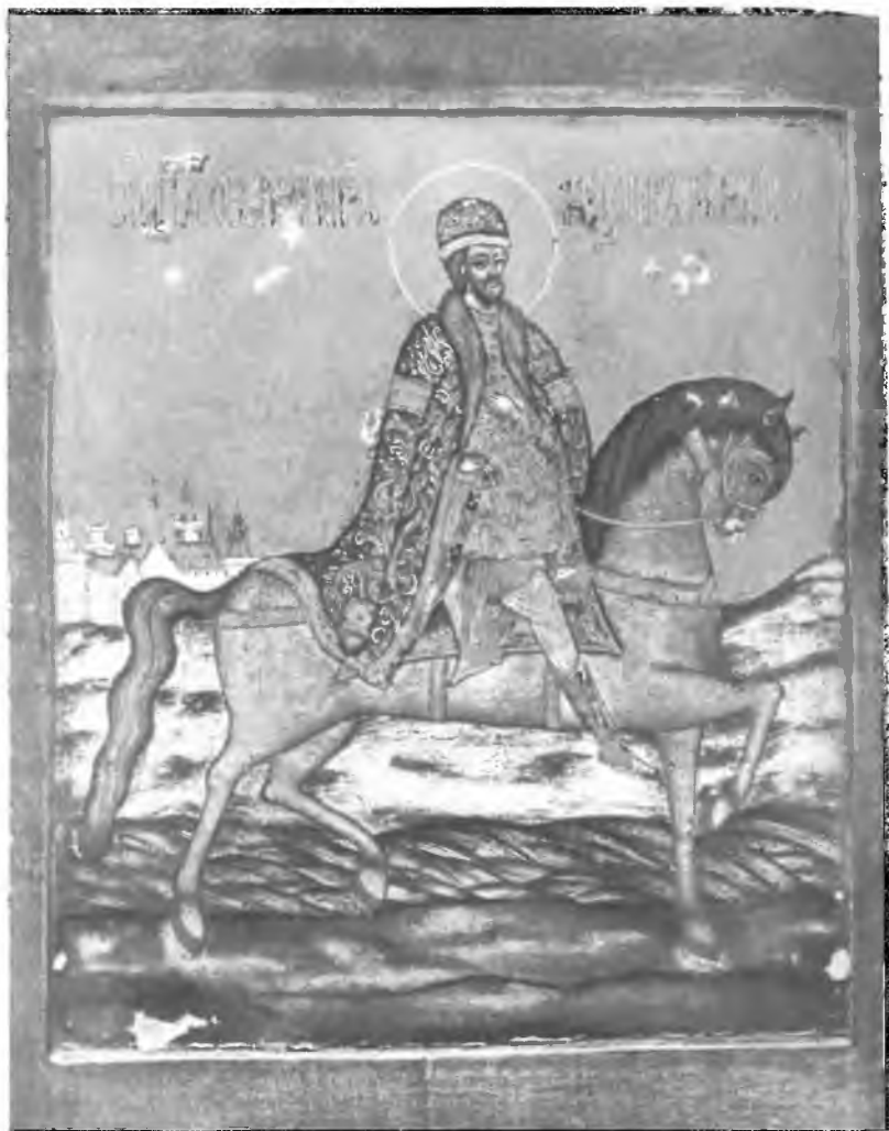
9. Портретная икона Александра Невского. XVIII в.