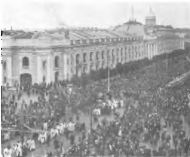
16. Крестный ход в Петербурге 30 августа. Фотография 1908 или 1909 г.