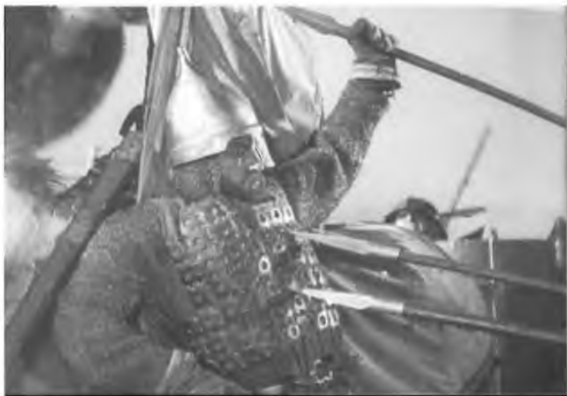
30. Богатырь Гаврило Олексич защищает князя в сражении. Кадр из фильма «Александр Невский» С.М. Эйзенштейна. 1938 г.