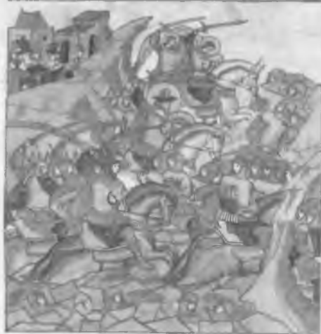
5. Префигурация и воплощение — император Веспасиан и Александр Невский. Лицевой свод. Вторая половина XVI в.