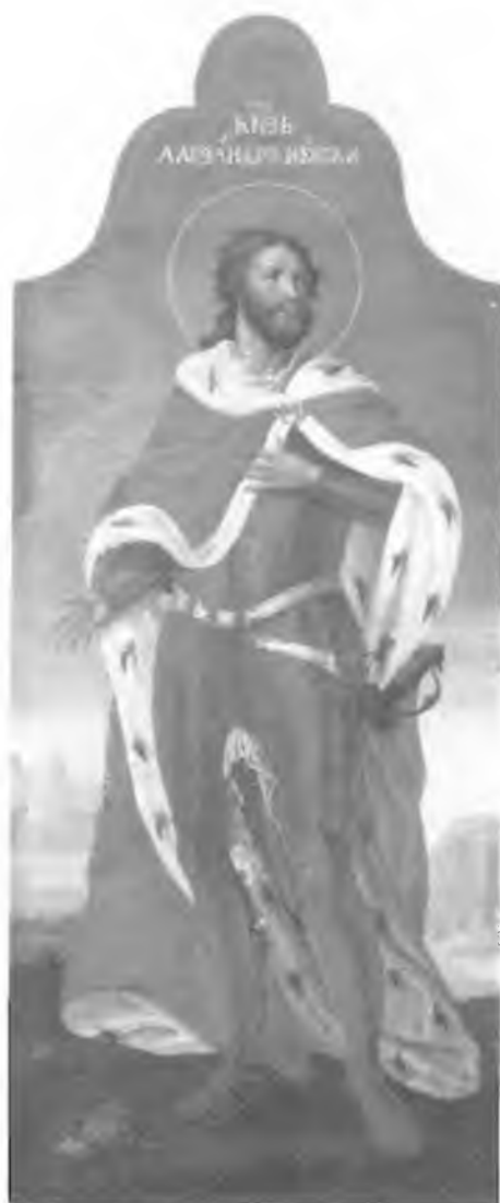
12. Портретная икона Александра Невского: Петропавловский собор в Санкт-Петербурге. Начало XVIII в.