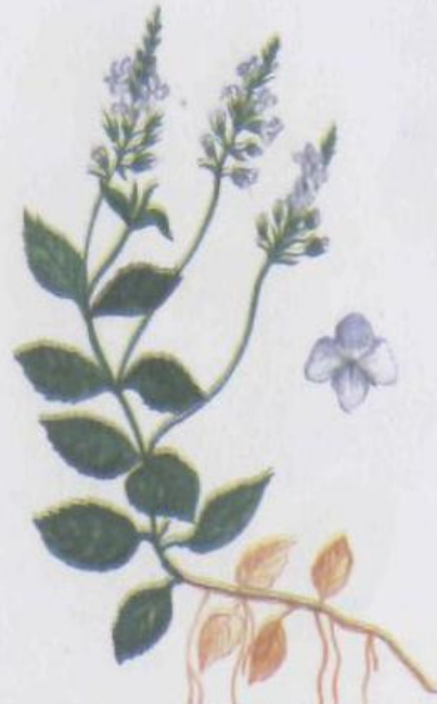
Вероника лекарственная Veronica officinalis