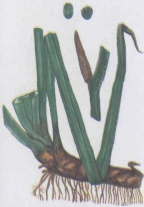
Аир обыкновенный Acorus calamus