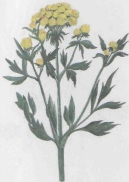
Любисток лекарственный Levisticum officinale