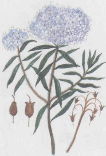
Багульник болотный Ledum palustre