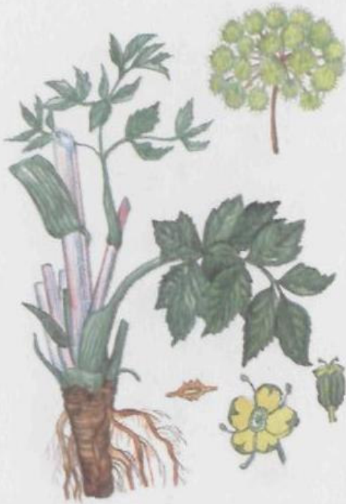
Дягиль лекарственный Archangelica officinalis