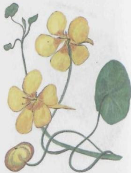
Настурция высокая Tropaeolum majus