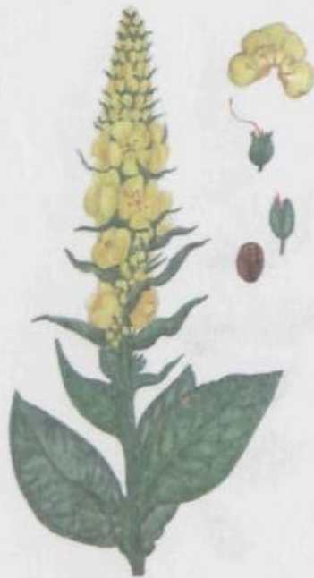
Коровяк скипетровидный Verbascum thapsiforme