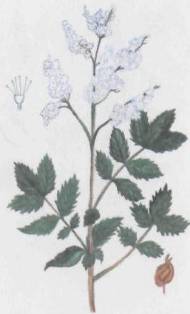
Таволга вязолистная (лабазник) Filipendula ulmaria