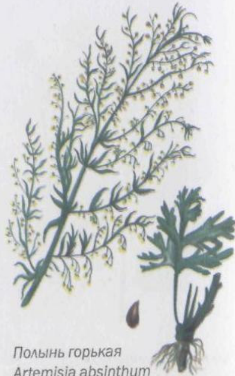
Полынь горькая Artemisia absinthium