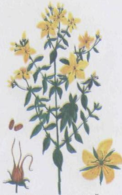
Зверобой продырявленный Hypericum perforatum