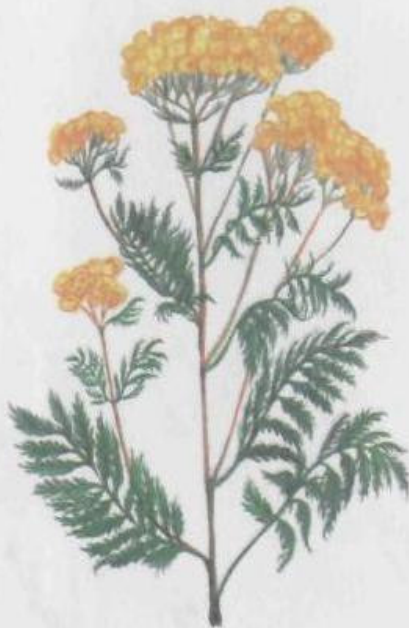
Пижма обыкновенная Tanacetum vulgare