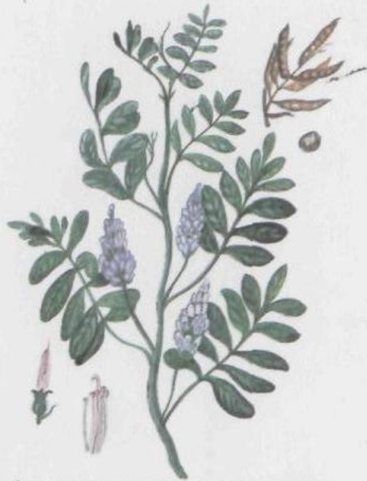
Солодка голая (солодка гладкая) Glycyrrhiza glabra