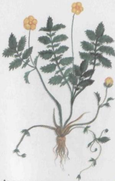
Лапчатка гусиная Potentilla anserina