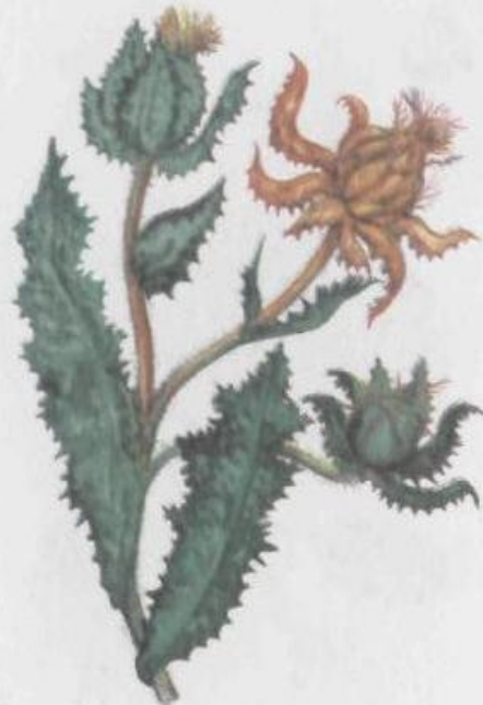
Волчец кудрявый Cnicus benedictus