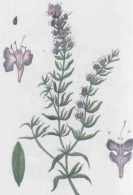
Иссоп лекарственный Hyssopus officinalis