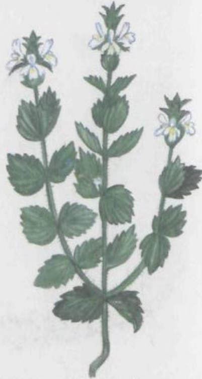
Очанка лекарственная Euphrasia officinalis