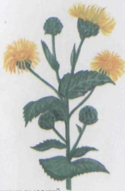
Девясил высокий Inula helenium