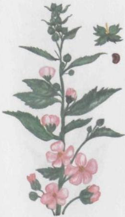
Алтей лекарственный Althaea officinalis