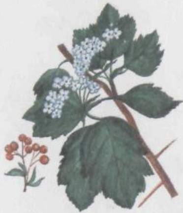
Боярышник колючий Crataegus oxyacantha