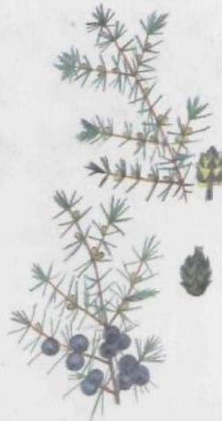
Можжевельник обыкновенный Juniperus communis