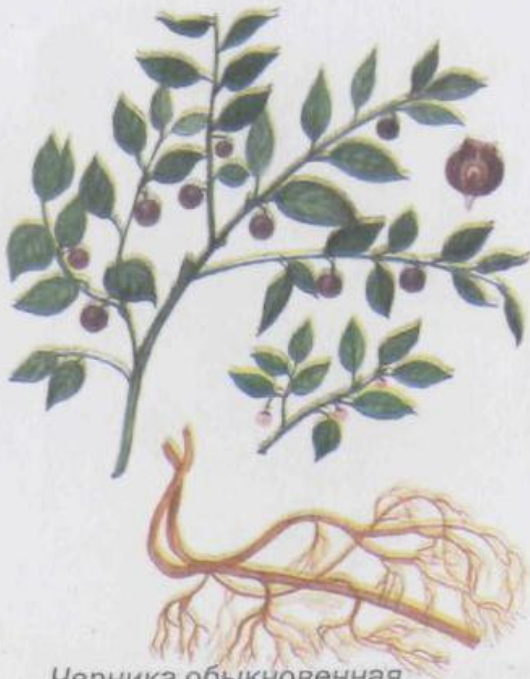
Черника обыкновенная Vaccinium myrtillus