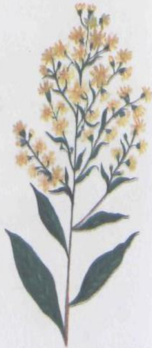
Золотая розга (золотарник) Solidago virga aurea