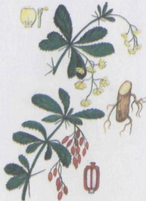
Барбарис обыкновенный Berberis vulgaris