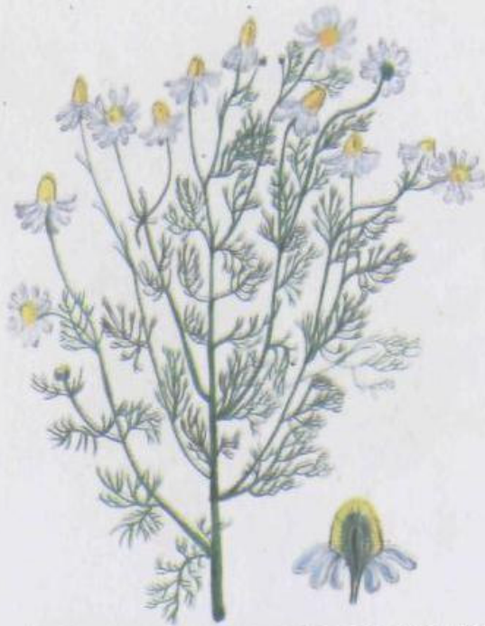
Ромашка аптечная (лекарственная) Matricaria chamomilla