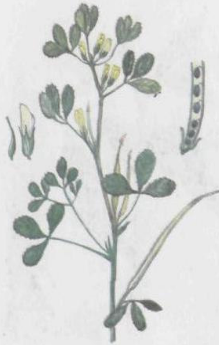
Пажитник сенной Trigonella foenum graecum