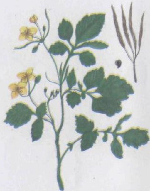
Чистотел большой Chelidonium majus