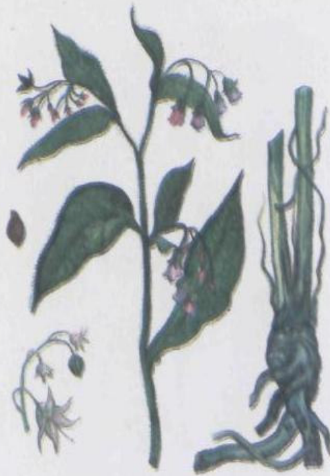
Окопник лекарственный Symphytum officinale