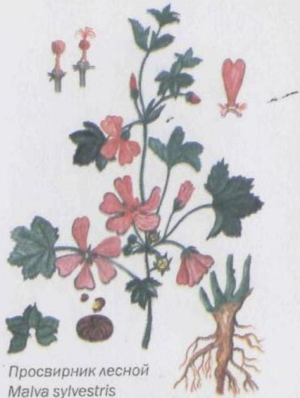
Просвирник лесной Malva sylvestris