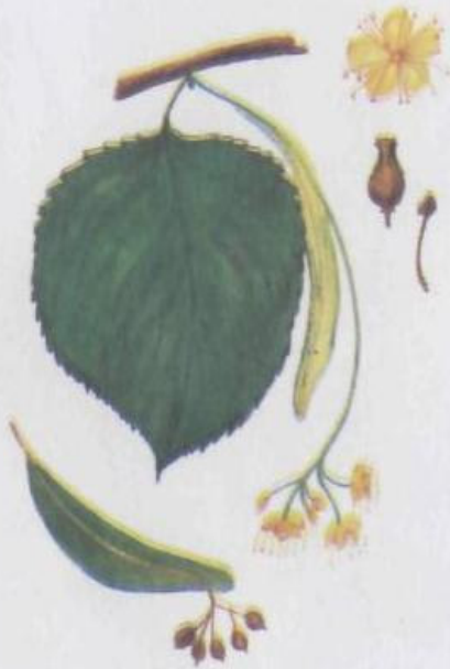
Липа сердцевидная Tilia platyphyllos