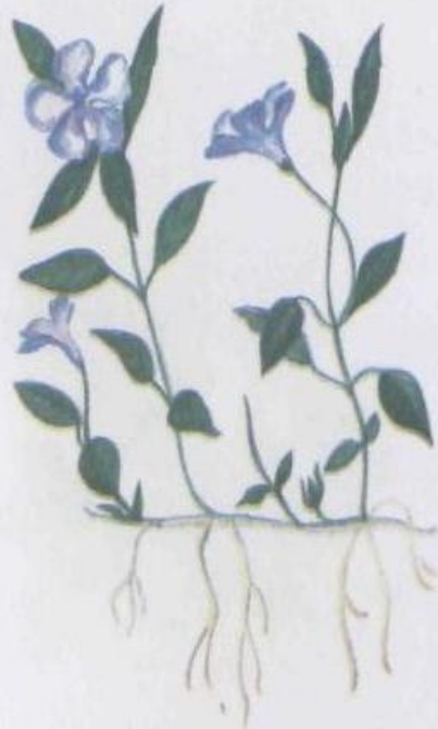
Барвинок малый Vinca minor