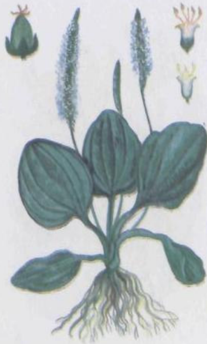
Подорожник большой Plantago major