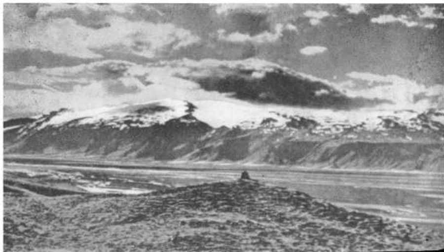
Вид от хутора Хлидаренди. В X в. на этом хуторе жил Гуннар, герой «Саги о Ньяле». Вдали — ледник Эйяфьятлаёккуль.