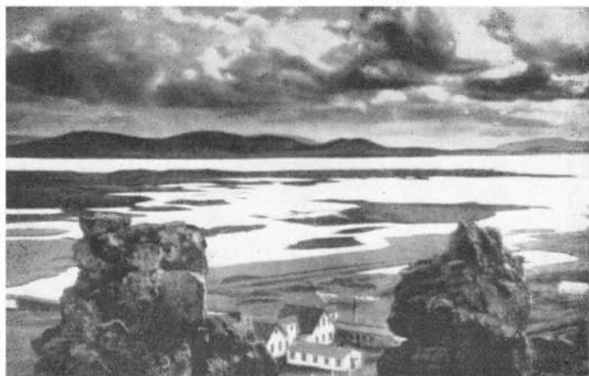
Поля Тинга. Посредине внизу — гостиница и ресторан «Вальгалла». Слева — устье реки Эхсарау.