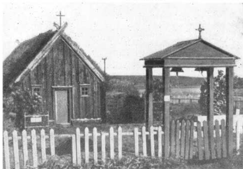
Церковь в Видимири. Типичная для старого времени постройка из досок и дерна. Сохраняется как музей.