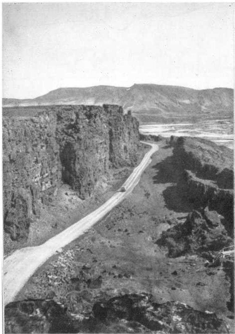
Поля Тинга. Дорога ведет вниз к реке Эхсарау и озеру. Справа — Скала Закона.