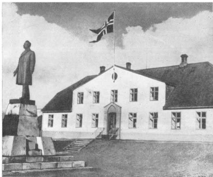
Дом правительства в Рейкьявике. Один из самых старых в городе. Перед домом — памятник Халлесу Халфстейну (1861—1922). Халлес первый возглавил исландское са- моуправление (в 1904 г.).