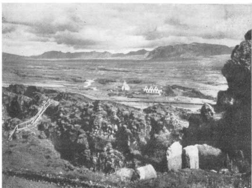
Поля Тинга. На первом плане — Скала Закона. Посредине — церковка, на которой висел «коло- кол Исландии».