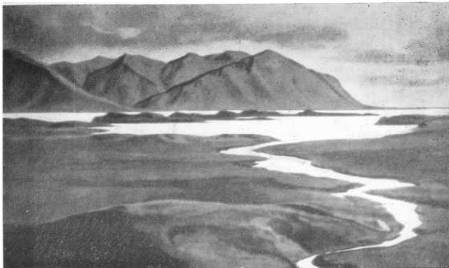
Вид от хутора Борг. В X в. на этом хуторе жил Эгиль Скалла- grimsson.