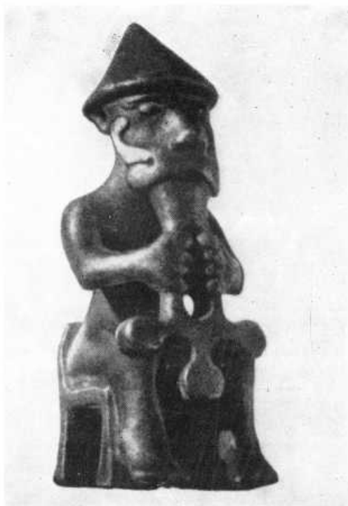
Статуэтка X в., изображающая, по-видимому, Тора. Найдена на севере Исландии. Хранится в Национальном музее в Рейкьявике.