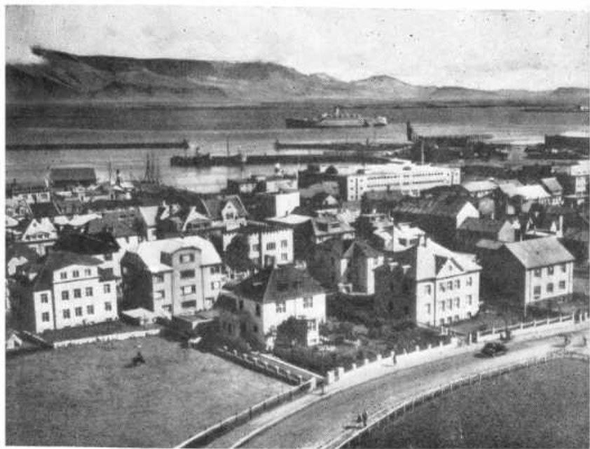
Современный Рейкьявик. Вдали — гора Эся.