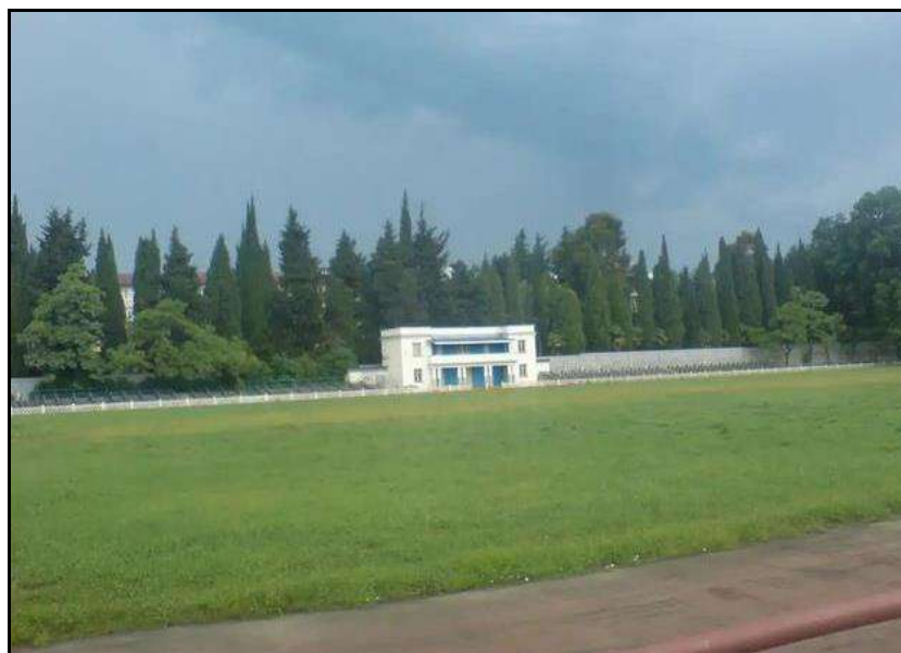
Стадион «Труд» в Адлере

Таким образом, именно эта игра стала первой на турнире.