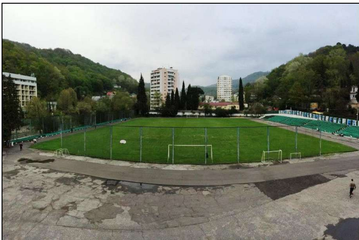
Стадион «Локомотив» в Хосте