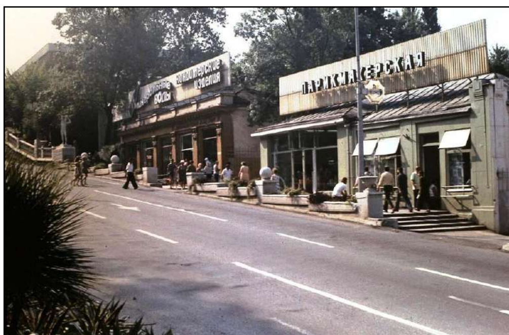
Осенний Сочи 1973 года

Не менее напряженная и даже драматичная борьба за победу шла в седьмой зоне . В итоге первую строчку с 34 очками совершенно неожиданно занял «Сибиряк» из Братска. При этом, после первых девяти туров команда делила лишь 15-16 место в турнирной таблице. Всего на одно очко отстали сразу три его соперника – барнаульское «Динамо», камчатский «Вулкан» и прошлогодний победитель такого турнира «Амур» Благовещенск. В сибирско-дальневосточной зоне послематчевые пенальти злую шутку сыграли с барнаульцами. Шесть раз они подвергались этой процедуре и в пяти случаях уступили своим соперникам. Если бы ни эти потерянные пять очков – быть бы динамовцам в сочинском финале. «Амур» стал жертвой судейских интриг и собственной недисциплинированности. Выигрывая 1:0 принципиальнейший матч на чужом поле у «Вулкана» и протестуя против предвзятого судейства, команда самовольно и досрочно покинула поле. В результате последовало техническое поражение и в итоге - только четвертое место. Многоопытный «Иртыш» по-прежнему великолепно выступал в Омске, победив 12 раз и трижды сыграв вничью, но провальные матчи на выезде не позволили коллективу вмешаться в борьбу за победу в турнире.