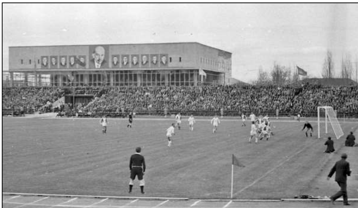
г.Симферополь. Стадион «Локомотив»

«Советская молодежь» Рига №230 от 24.11.1972.