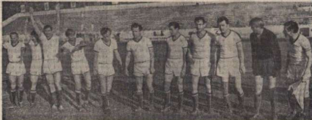
Чемпион РСФСР 1972 года, победитель финального турнира команд второй лиги — кемеровский «Кузбасс». Он завоевал право выступать в первой лиге класса «А».

Путевки в первую лигу достались городам с разным уровнем России. Но есть и общее, что их объединяет. Командам представляются крупные промышленные центры, крупные предприятия — Ново-кемеровский химкомбинат, Новолипецкий металлургический завод. И в Кемерове, и в Липецке любят свои клубы, внимательно следят за ними, контролируют и их анализируют, когда надо, помощи.