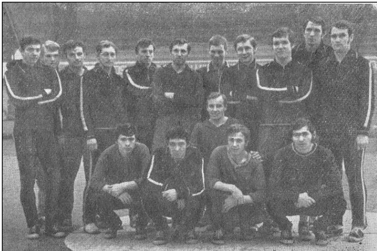
«Даугава» Рига - 1972

«Советская молодежь» Рига. №221 от 11.11.1972.