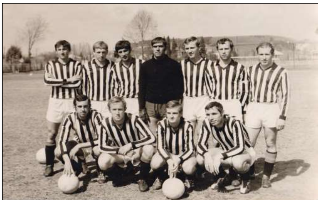
«Сокол» Саратов - 1972