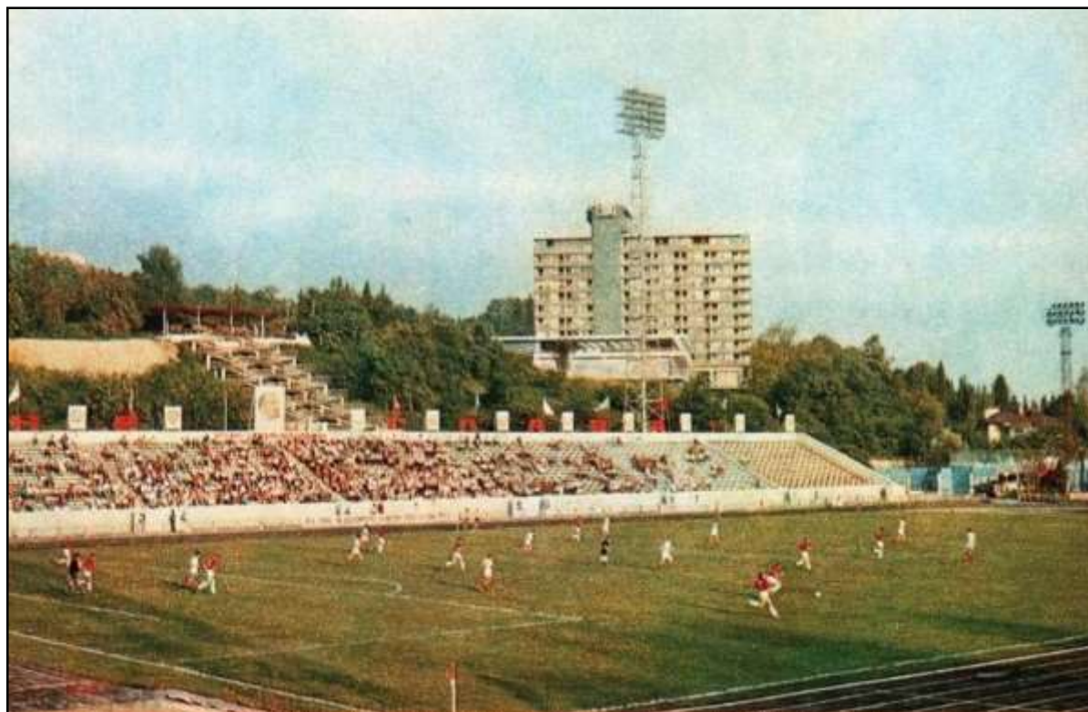
г.Сочи. Центральный стадион

«Амурская правда» Благовещенск, №266 от 14.11.1972.