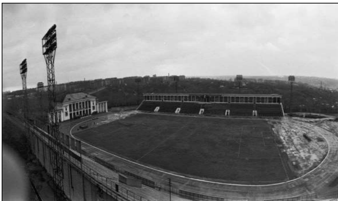
г.Смоленск. Стадион «Спартак»