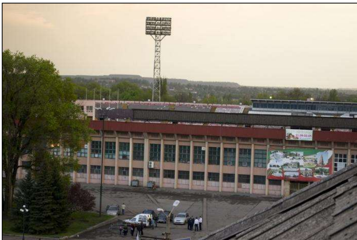
г.Кривой Рог. Стадион «Металлург»