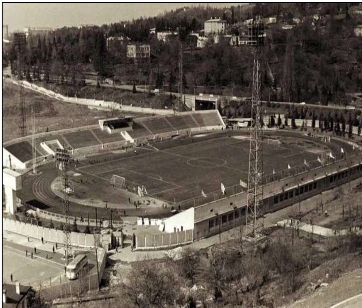
г.Сочи. Центральный стадион