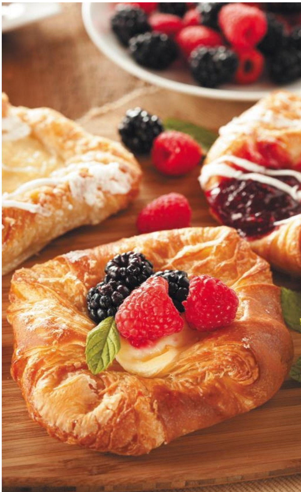
Слойки со сливочным кремом и ягодами