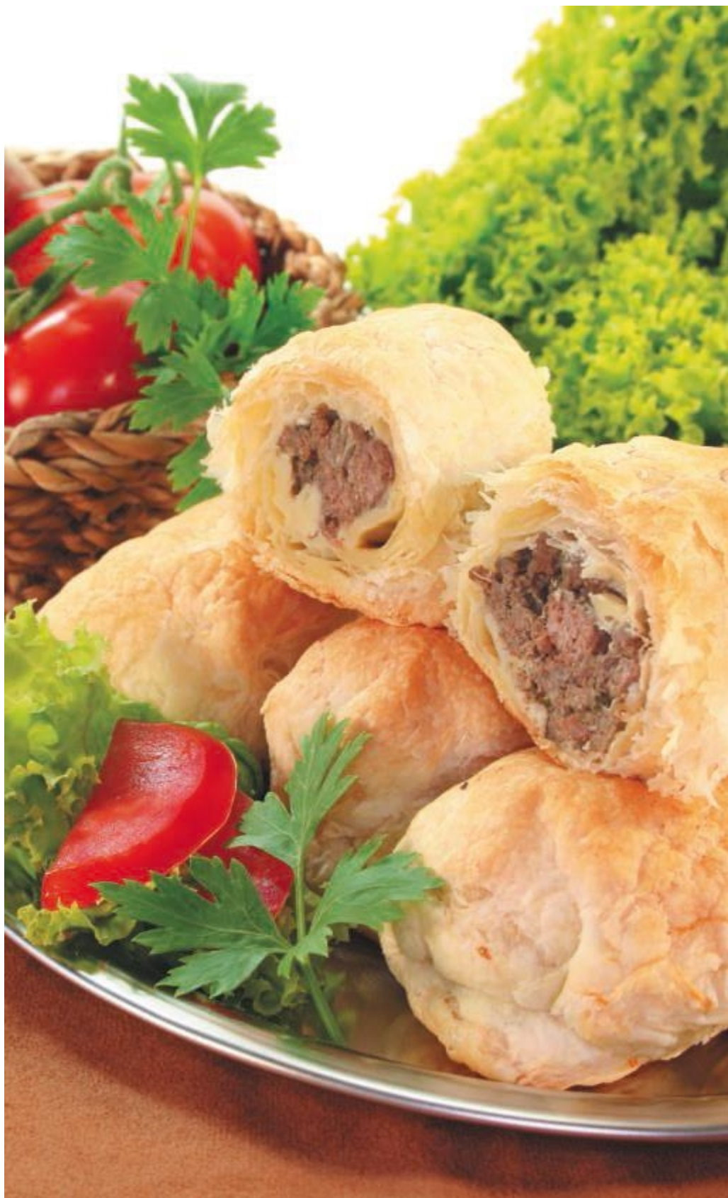
Слоеные пирожки с мясом