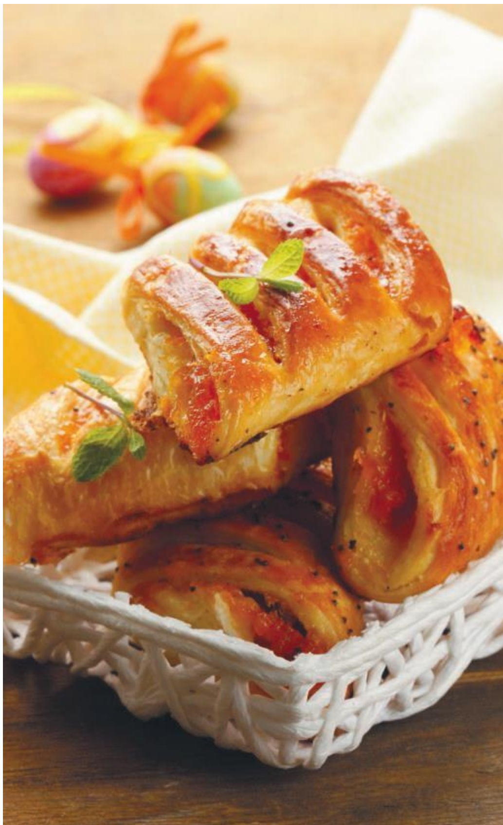
Слоеные пирожки с вареньем