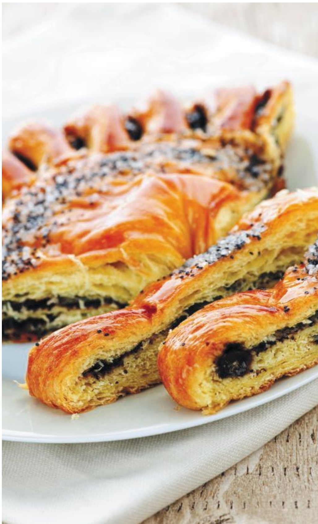
Маковый слоеный пирог