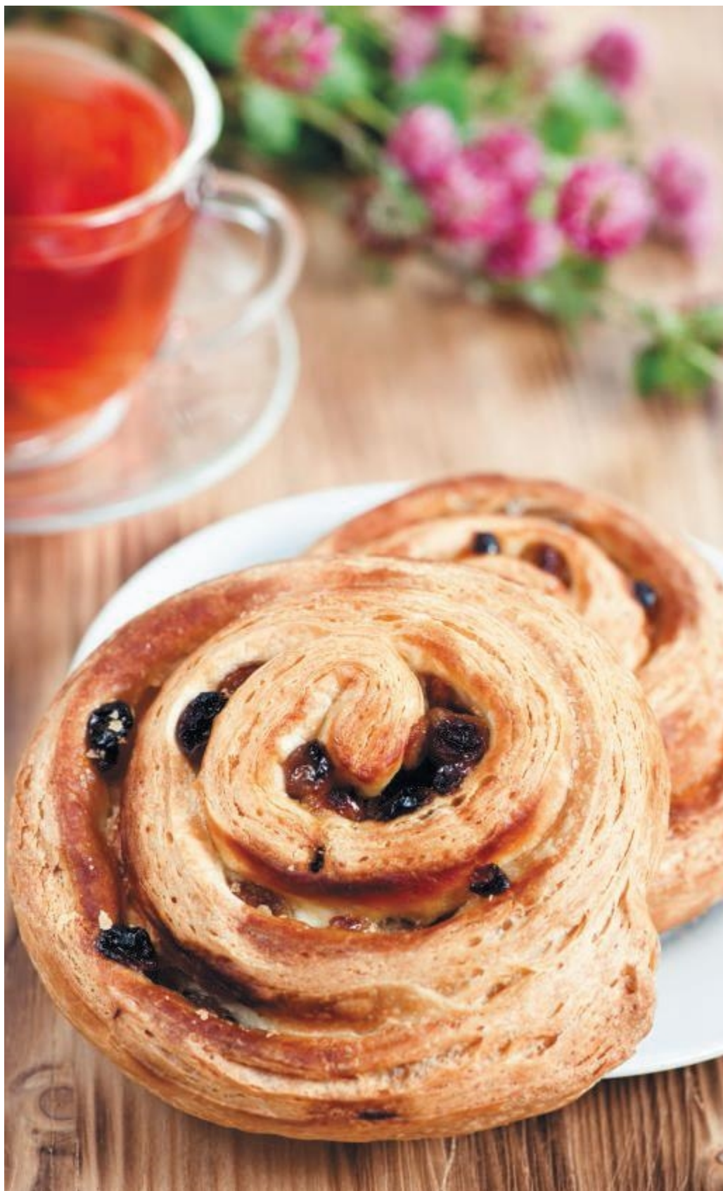
Слоеные завиточки с изюмом