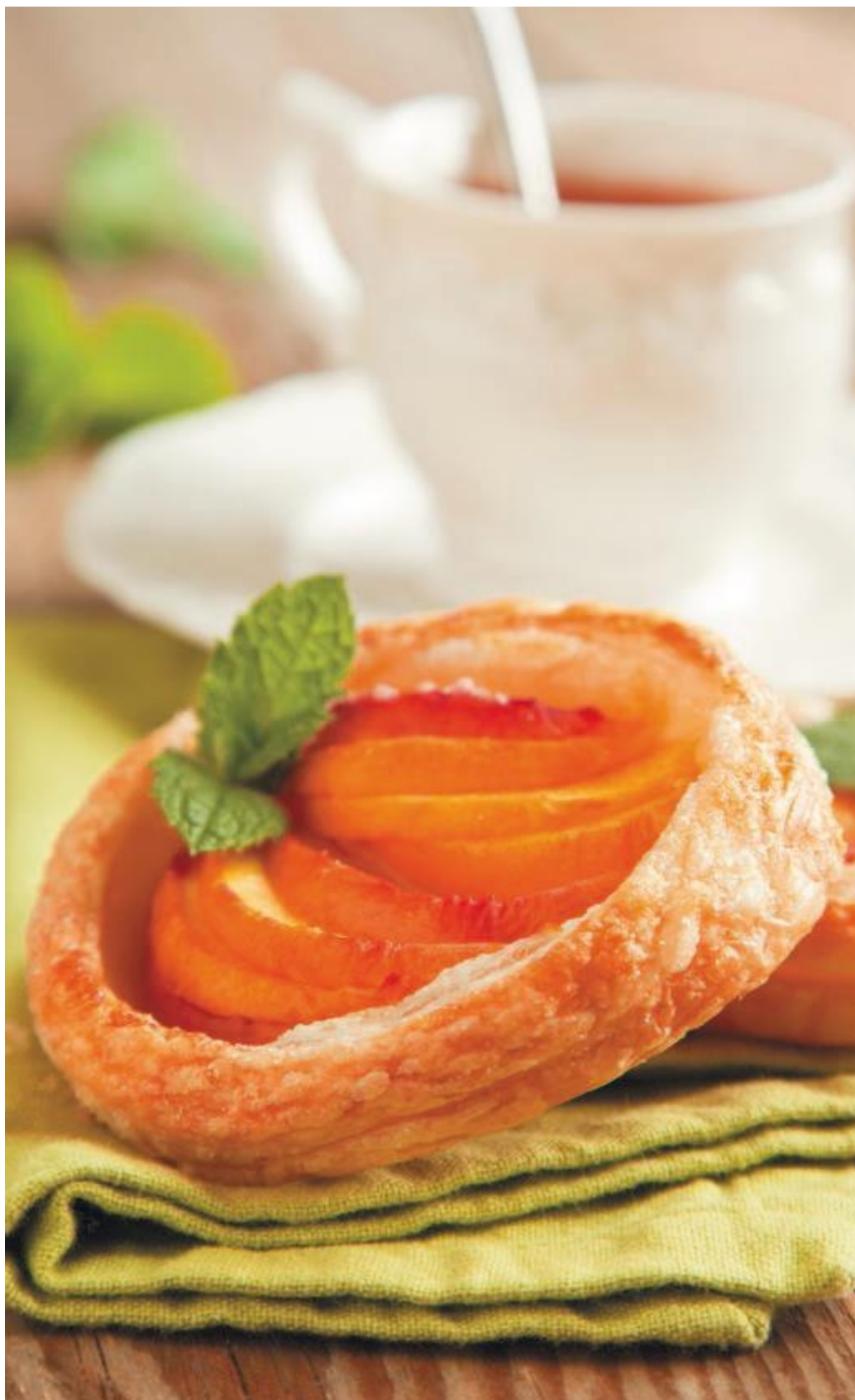
Слойки с фруктами