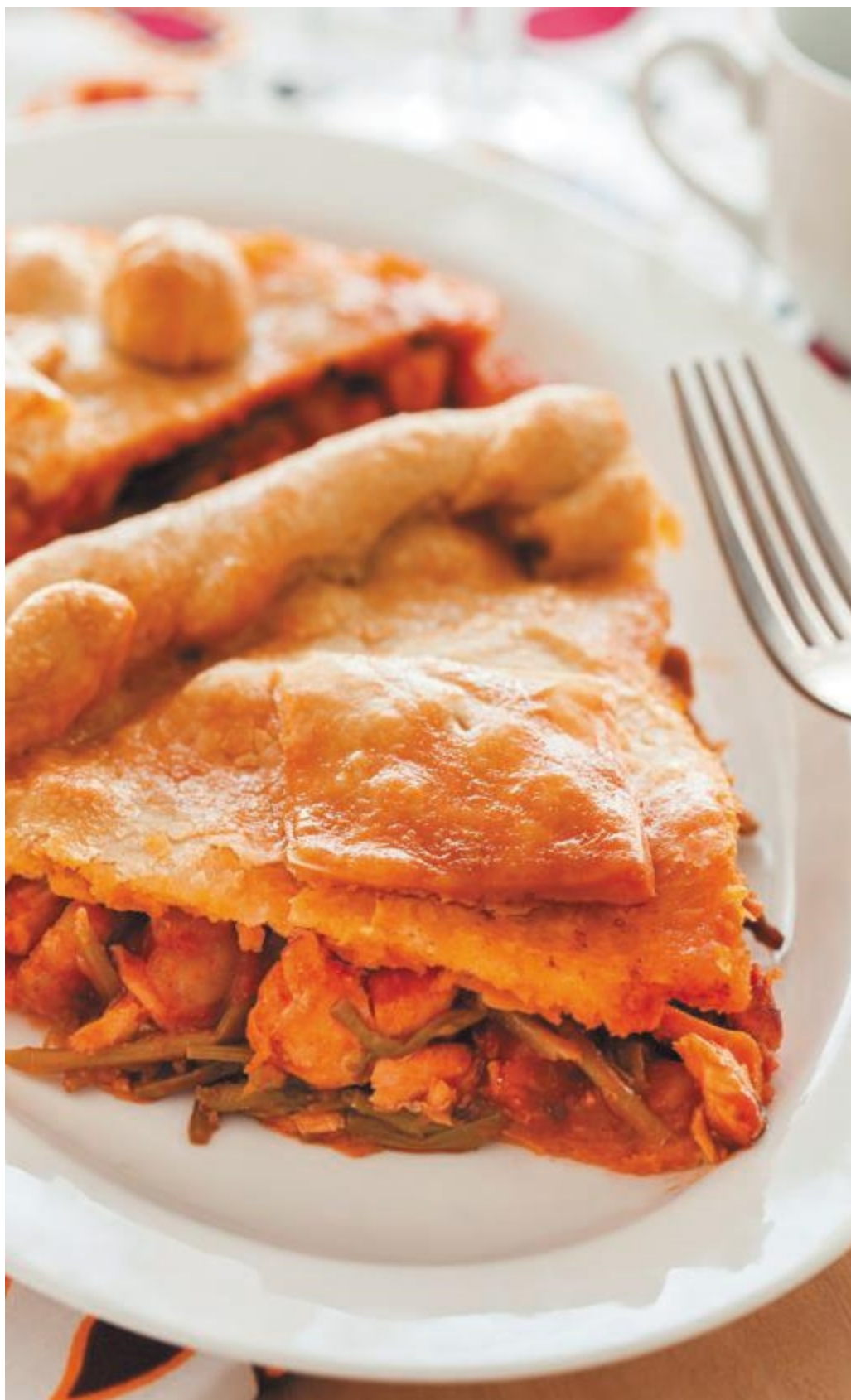
Слоеный пирог с рыбой и морской капустой