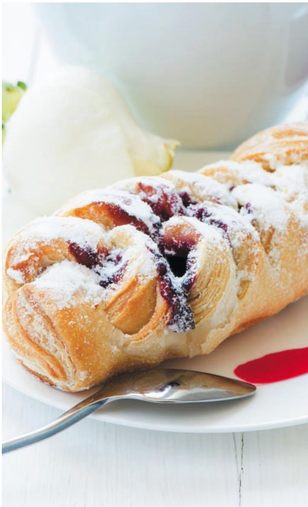
Слоеная косичка с вишневым вареньем