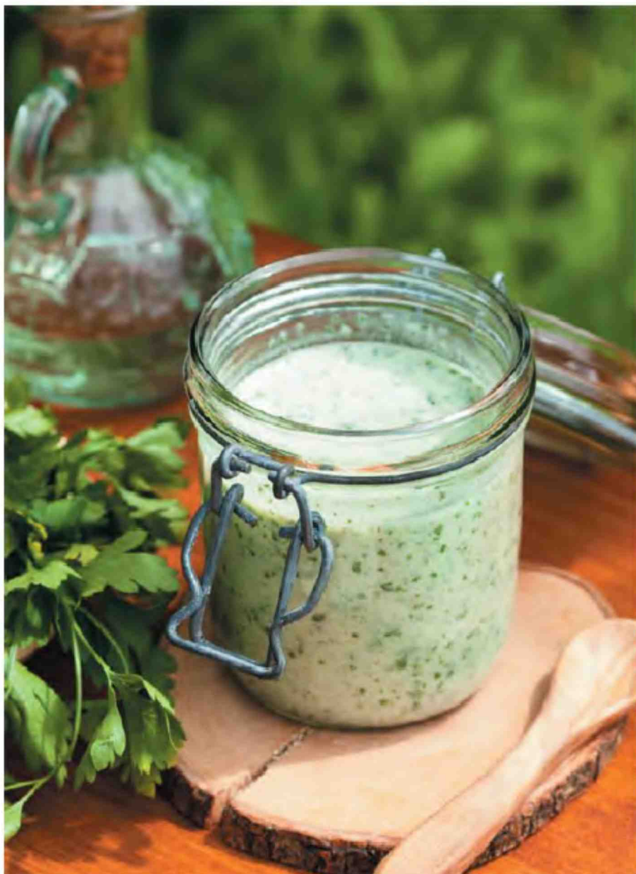
Соус йогуртный с томатным соком и горчицей