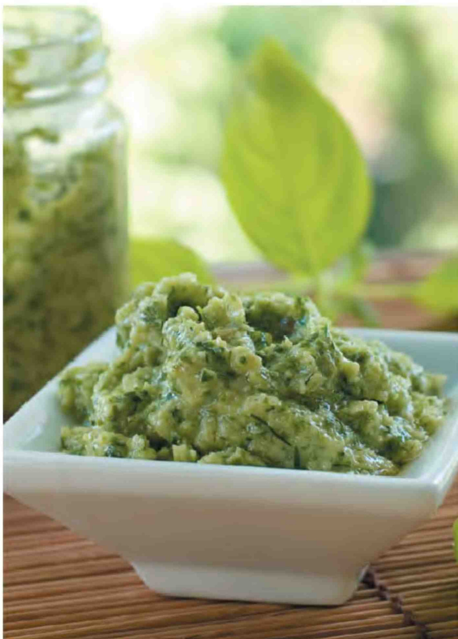
Соус йогуртный с горчицей и зеленью петрушки