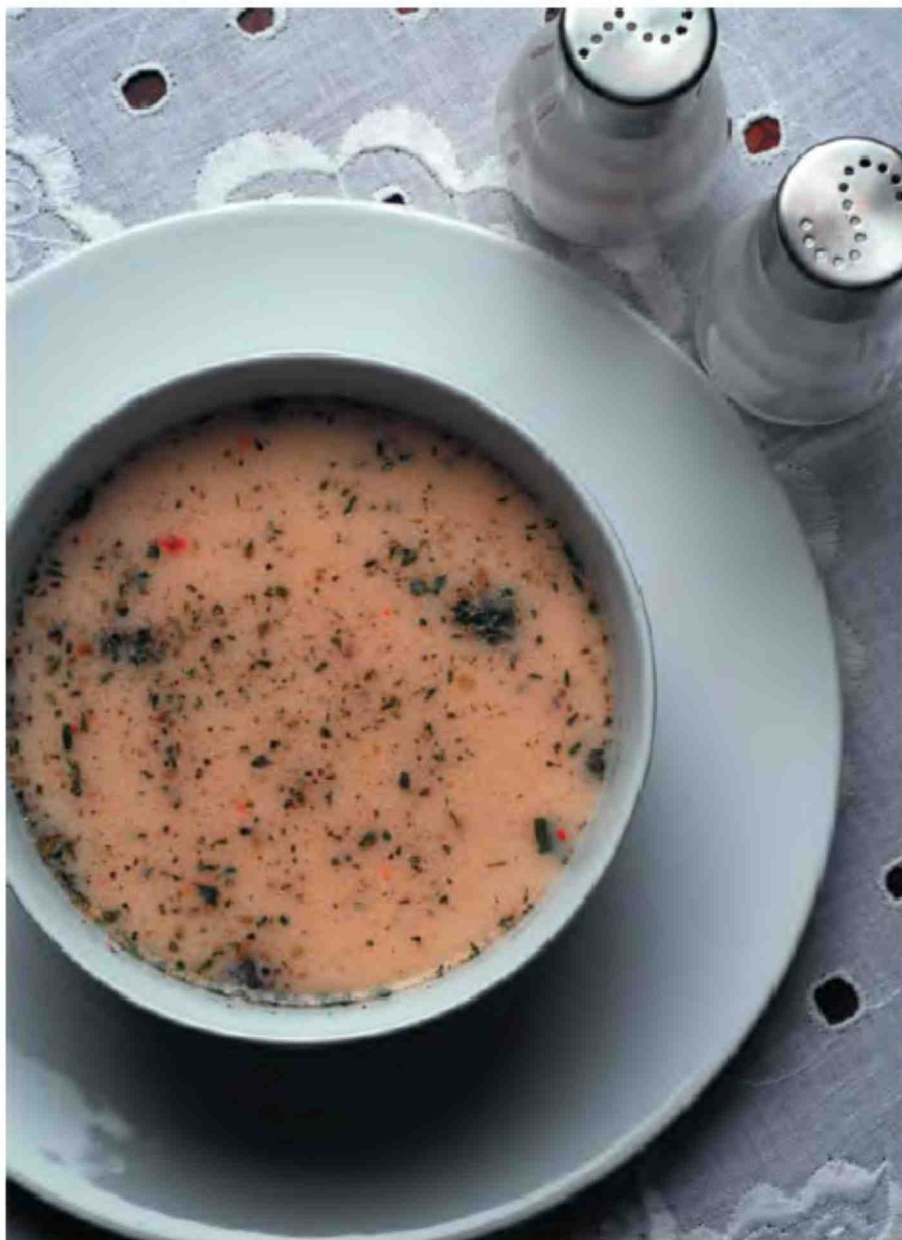
Соус томатный острый с перцем чили