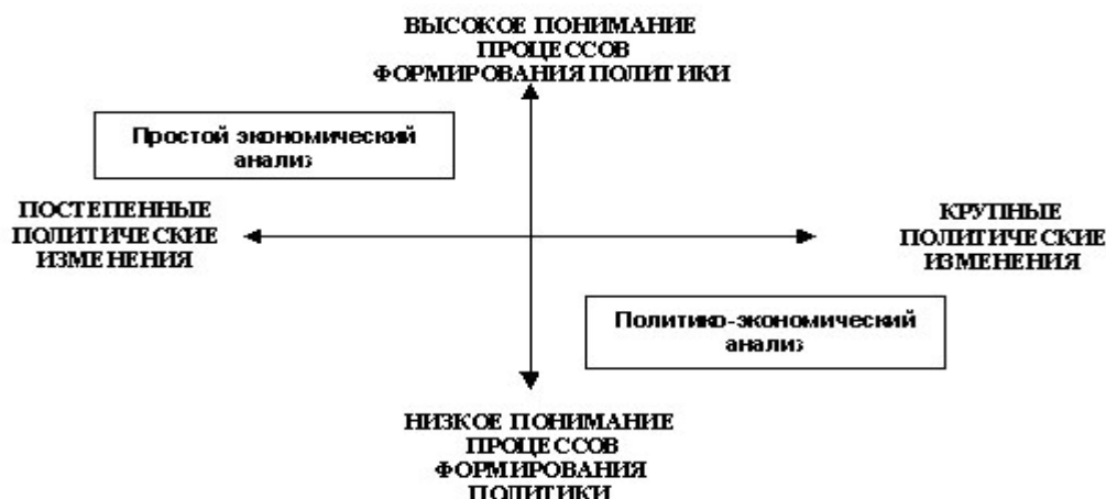
Рис. 1. Виды экономического анализа и его влияние на политические изменения.

проблемами экономической истории, вынуждены преодолевать эту упрощенную картину [2].