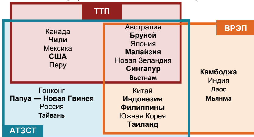
РИСУНОК 1. Интеграционное взаимодействие в АТР стран АСЕАН