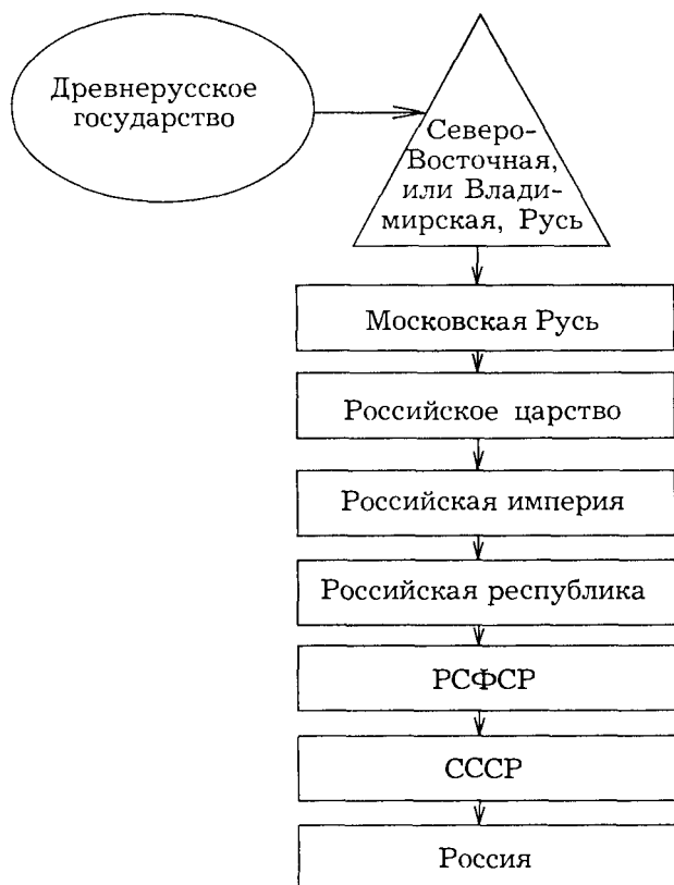
Рис. 8.1. Цивилизация России: этнокультурная и политическая организация