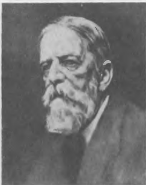
Фридрих фон Визер