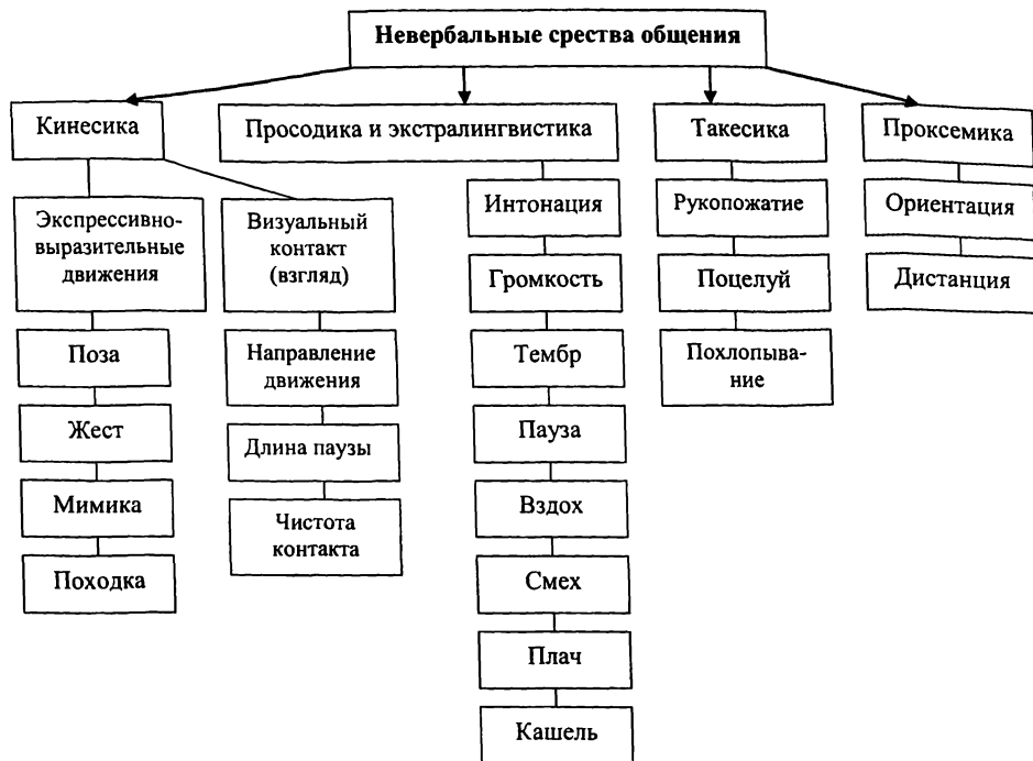
Рис. 3. Схема общения