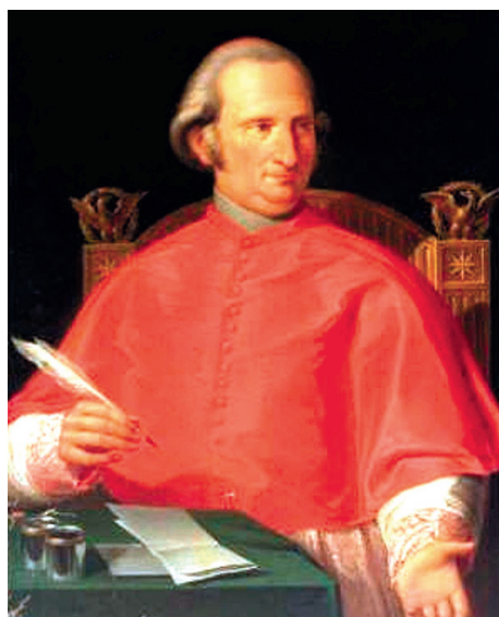
Альбани Джузеппе Андреа, государственный секретарь (1829–1831)