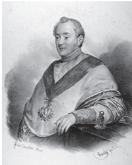
Бернетти Томмазо, государственный секретарь (1828–1829; 1831–1836)