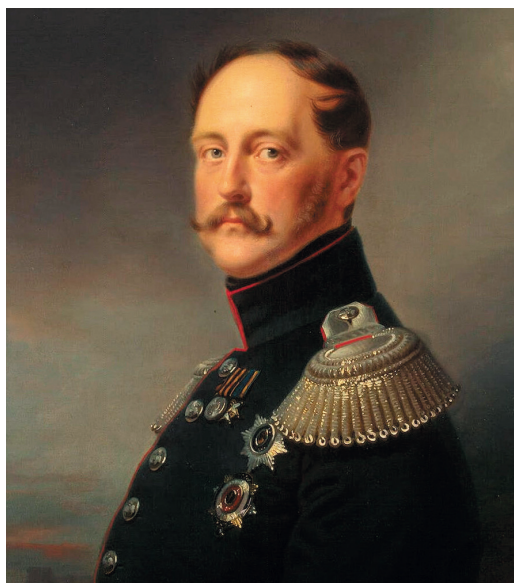
Николай I, российский император (1825–1855)