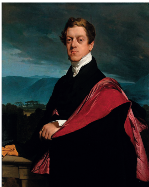
Гурьев Николай Дмитриевич, посланник России при Святом Престоле (1832–1837)