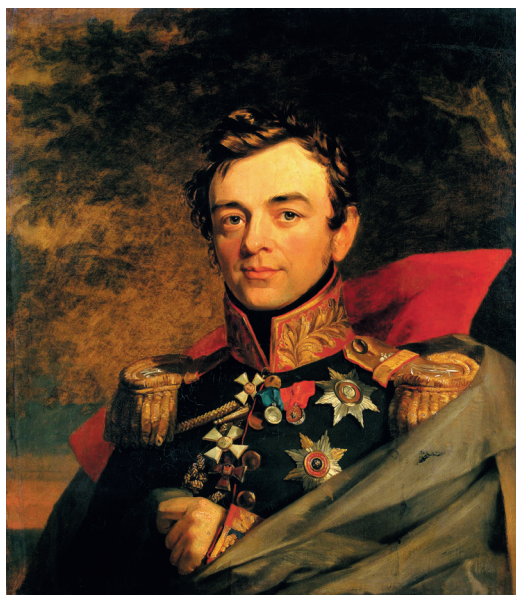
Паскевич Иван Фёдорович, наместник Царства Польского (1831–1856)