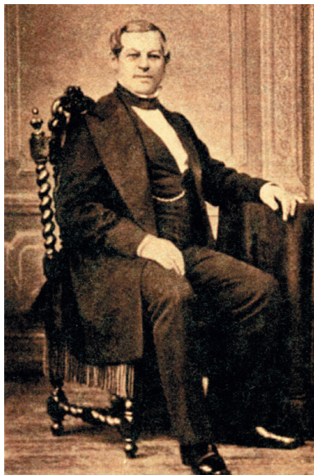
Киселёв Николай Дмитриевич, посланник России при Святом Престоле (1855–1864)