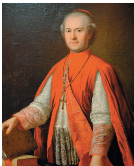
Делла Сомалья Джулио Мария, государственный секретарь (1823–1828)