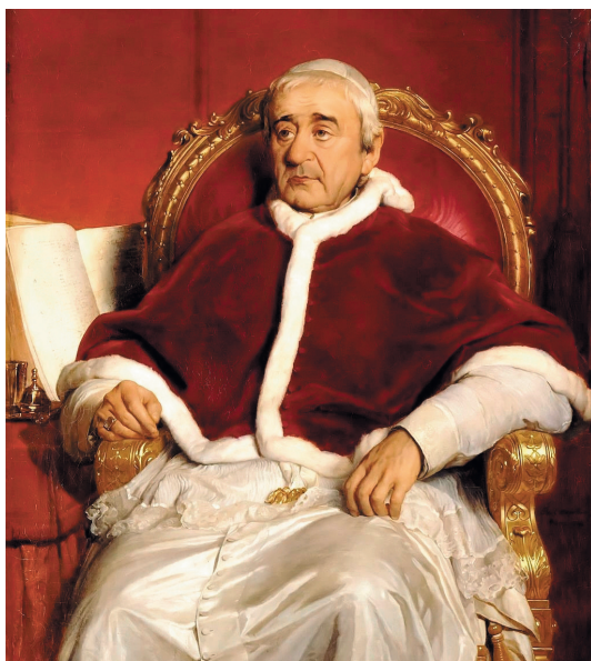
Григорий XVI (Бартоломео Альберто Каппеллари), римский папа (1831–1846)