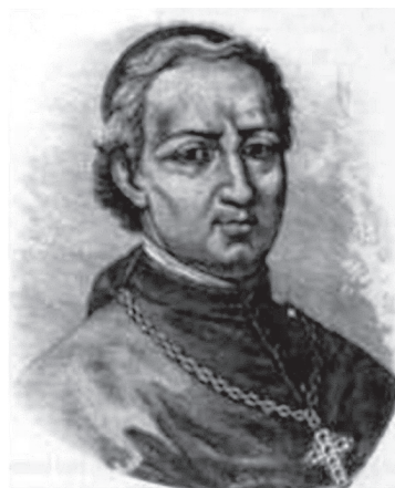
Ламбрускини Луиджи Эммануэле Николо, государственный секретарь (1836–1846)