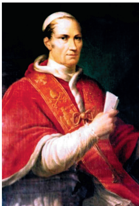
Лев XII (Габриэле Аннибале делла Дженга), римский папа (1823–1829)