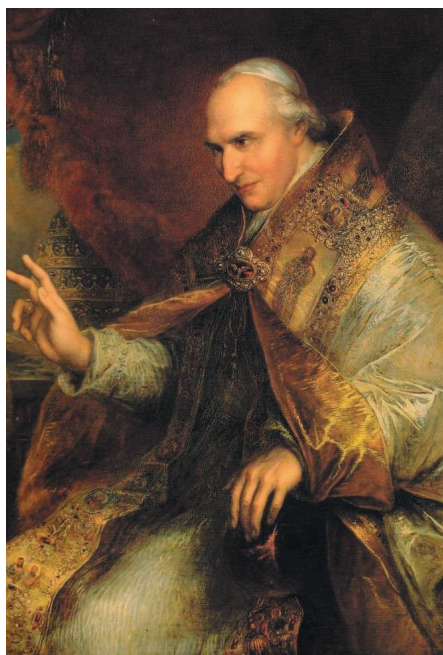
Пий VIII, (Франческо Саверио граф Кастильони), римский папа (1829–1830)