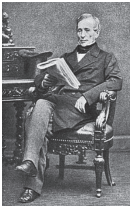
Бутенев Апполинарий Петрович, посланник России при Святом Престоле (1843–1855)