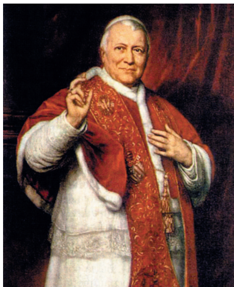
Пий IX (Джованни Мария Мاستаи-Ферретти), римский папа (1846–1878)