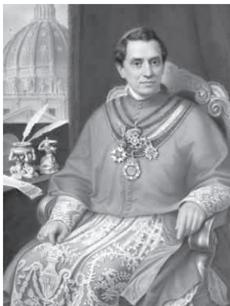
Антонелли Джакомо, государственный секретарь (1848–1876)