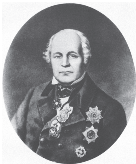
Блудов Дмитрий Николаевич, управляющий Департаментом духовных дел иностранных исповеданий МВД, министр внутренних дел (1832–1838)