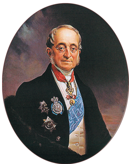
Нессельроде Карл Васильевич, министр иностранных дел России (1816–1856)