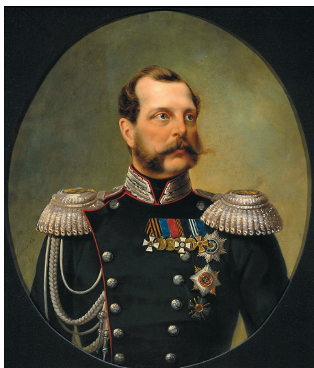
Александр II, российский император (1855–1881)