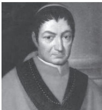
Джицци Томмазо Паскуале, государственный секретарь (1846–1847)