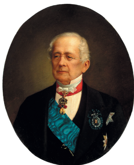
Горчаков Александр Михайлович, министр иностранных дел России (1856–1882)