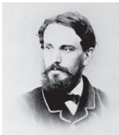
Мейендорф Феликс Казимирович, поверенный в делах России при Святом Престоле (1864–1866)