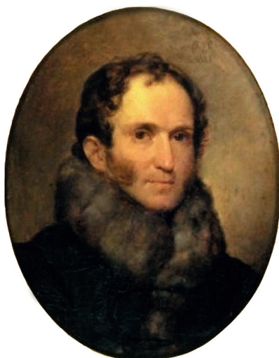
Гагарин Григорий Иванович, посланник России при Святом Престоле (1827–1832)