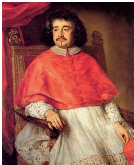
Киджи Флавио, возглавлял посольство в Москву и С.-Петербург по случаю коронации Александра II (1856)