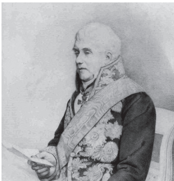
Италинский Андрей Яковлевич, посланник России при Святом Престоле (1816–1827)