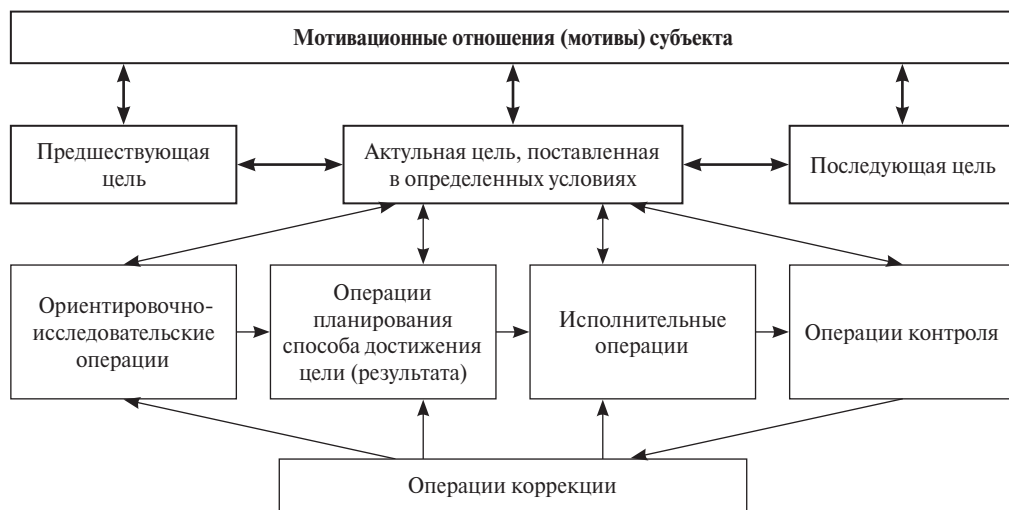
Рис. 3. Функциональная структура действия

способы ориентировки, включаясь в выполнение разнообразных действий. При этом последняя группа признаков характеризует творческие составляющие способностей (рис. 2).