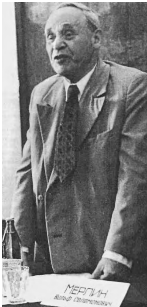
В. С. Мерлин открывает III Всесоюзный симпозиум «Психологический стресс в спорте». Пермь, 1977 г.

Второй этап , охватывающий 70-е — 80-е гг. XX-го столетия, связан с переходом к изучению особенностей деятельности в связи с разноуровневыми свойствами интегральной индивидуальности и систематизацией проявлений процессуальной стороны стиля (выявление симптомокомплексов операций, выделение соотношения ориентировочных и исполнительных действий и т. д.). На этом этапе в структуре стиля стали рассматриваться и особенности его результативной стороны. Важной методологической основой исследований стиля на этом этапе явились разработка В. С. Мерлиным учения об интегральной индивидуальности и целенаправленное изучение стилевых характеристик деятельности в связи с разноуровневыми свойствами индивидуальности: социально-психологическими, личностными, психодинамическими (свойствами темперамента) и нейродинамическими (свойствами нервной системы). Такое изучение стиля позволило В. С. Мерлину сформулировать положение о системообразующей функции стиля по отношению к свойствам интегральной индивидуальности. Подход к изучению стиля на этом этапе может быть назван системным . При таком подходе изучение стилевых проявлений стало осуществляться на основе целостных характеристик деятельности. В более конкретном плане стилевые характеристики деятельности стали изучаться на основе выделения в её структуре целей, действий и операций, а также следующих сторон: внешних условий, внутренних условий, способов и результатов деятельности. С применением системного подхода бы-