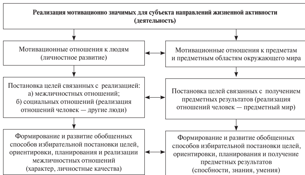
Рис. 2. Мотивационно значимые направления жизненной активности (деятельности)

вых индивидуально-избирательных способов: а) перцептивной, умственной и эмоционально-оценочной ориентировки в межличностных и социальных отношениях; б) постановки целей, требующих организации собственного поведения и поступков в межличностных отношениях и социальных ситуациях; в) активной реализации таких поступков и форм поведения (рис. 2). Личностные качества (черты характера) можно рассматривать как результат формирования особых высших психических функций, которые формируются на основе внешних, разделенных с другими людьми форм общения и взаимодействия, путем преобразования их в индивидуальные, психические образования. В связи с этим знаменитый тезис Л. С. Выготского может быть перефразирован: завтра ребенок будет самостоятельно поступать так («зона ближайшего развития» личности), как сегодня он поступает вместе с взрослыми («зона актуального развития»).