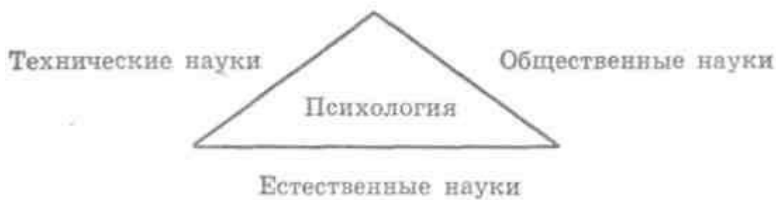
Рис. 1.1. Классификация А. Кедрова

Прикладные области психологии, или практическая психология, все шире входит в нашу жизнь; все чаще в повседневной жизни можно встретить психологов-практиков. Кратко укажем функции некоторых из этих профессиональных психологов-практиков. Годфруа выделяет следующие прикладные области психологии: клинический психолог, школьный психолог, промышленный психолог, педагогический психолог, психолог-эргономист, психолог-консультант . Клинические психологи работают в центрах психического здоровья, больницах и консультационных кабинетах. Чаще всего они имеют дело с людьми, которые жалуются на подавленность, раздражительность, слезливость, бессонницу, чувство одиночества, утрату радости жизни, трудности взаимопонимания с людьми, всевозможные страхи (например, страх езды в транспорте является частой причиной обращения к специалисту), депрессия, нарушения деятельности различных функциональных систем и органов (головные боли, боли в сердце, заболевания желудочно-кишечного тракта, бесплодие и гинекологические заболевания, когда врачи не находят объективной патологии, а орган ведет себя как «больной»), состояние тревоги, выражающееся в функциональных расстройствах эмоционального или сексуального плана, или же на трудности в преодолении неурядиц повседневной жизни. Психолог должен уяснить себе суть и причины проблемы путем бесед с пациентом или психологического обследования, с тем чтобы выбрать и применить наиболее подходящую психотерапию.