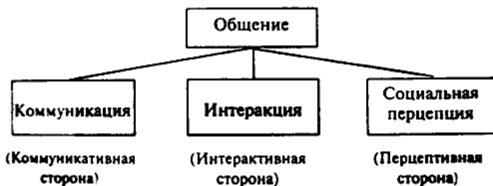
Рисунок 1 – Структура общения

Коммуникативная сторона общения, или коммуникация, в узком смысле слова, состоит в обмене информацией между людьми, с использованием средств общения, подразделяемых на вербальные (речевые) и невербальные (неречевые).