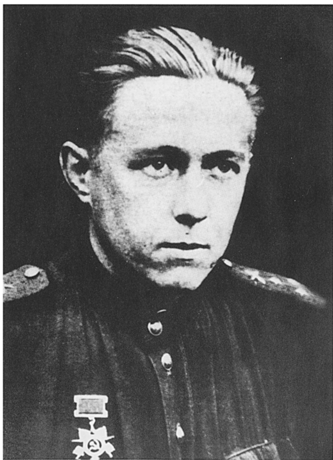
Брянский фронт. 1943