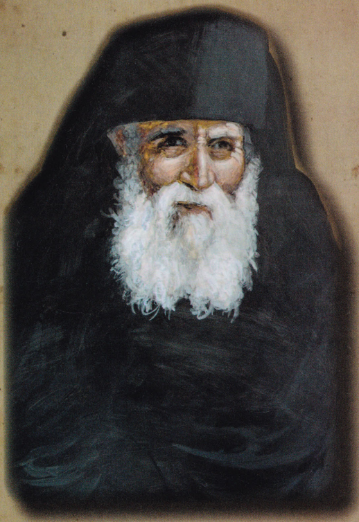
Преподобный Паисий Святоторец (Арсений Эзнепидис) (1924- 1994)