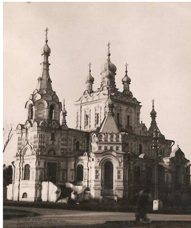
Свято-Георгиевская церковь г. Краснодар.