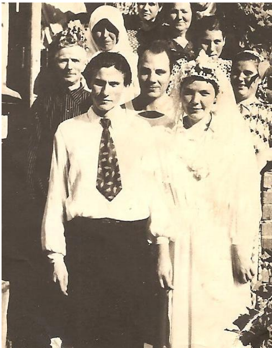
Новобрачные с родными.

Батюшка с детства сохранил любовь к Богу и молитве, церковному пению и чтению, всегда пополнял запас своих знаний в различных духовных