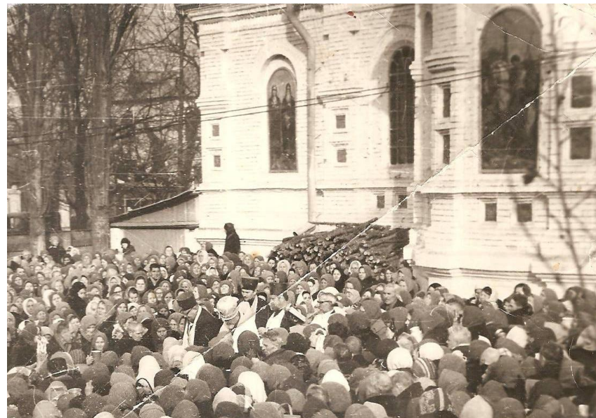
Крестный ход вокруг «Георгиевской».