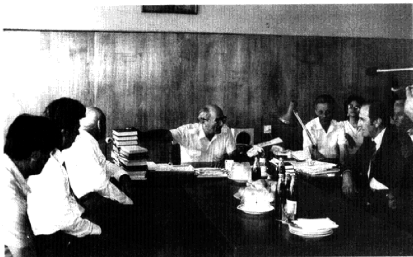
Прием абхазов из ФРГ 1984 г.