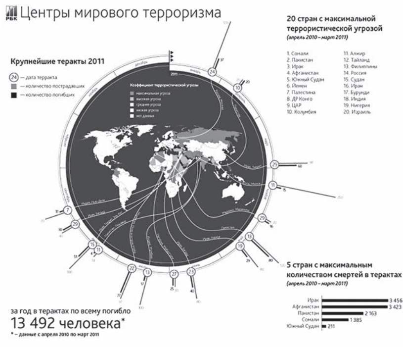
Рис. Центры мирового терроризма (2010–2011 гг.)