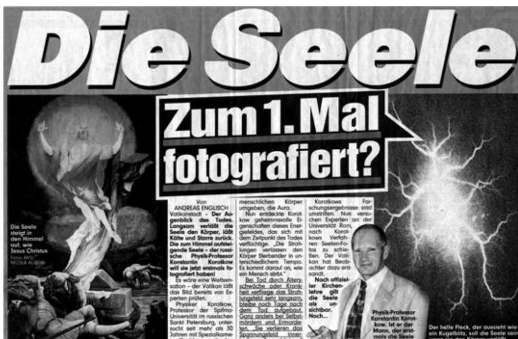
Рис.2. Фотография Души, покидающей тело.

человека, представляющий собой неразрушимый во времени сгусток психической энергии в виде торсионных полей, содержащих информацию, идущую от Вселенского Разума. Доподлинно, что такое Дух, ученым пока неизвестно. Возможно, поэтому о духе говорят как об «искре Божественного начала» в человеке, которое в конце его эволюции через ряд воплощений возвращается к Источнику, Богу, как его часть.