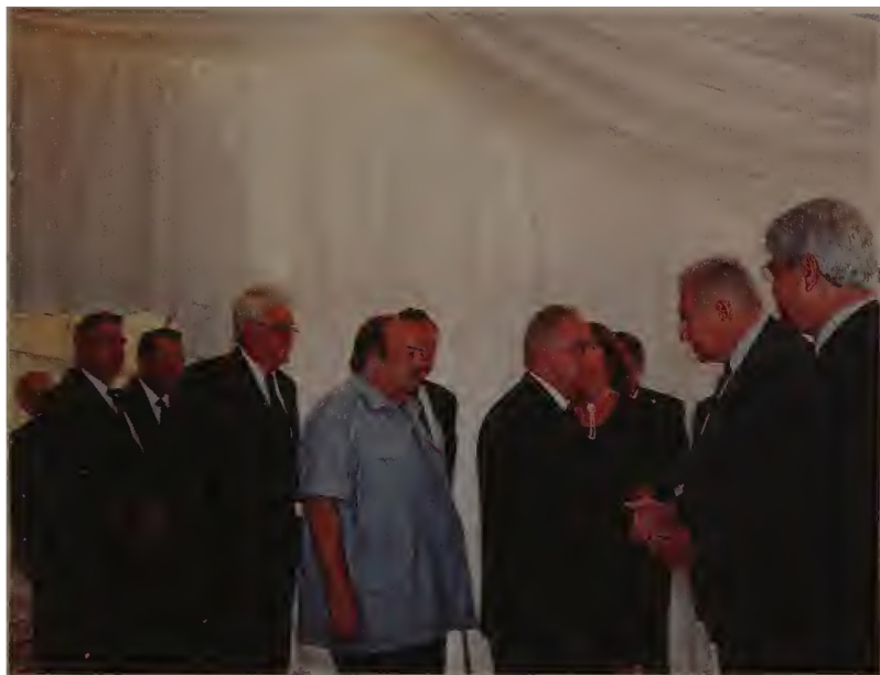
В очереди к президенту Вейцману. Впереди — посол Египта, сзади — посол Болгарии. Рядом с президентом — министр иностранных дел Д.Леви.