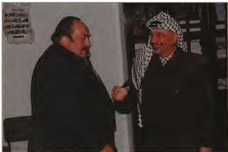
Одна из первых, но далеко не последняя встреча с Ясиром Арафатом («дядей Яшей» — на мидовском слэнге), 1994