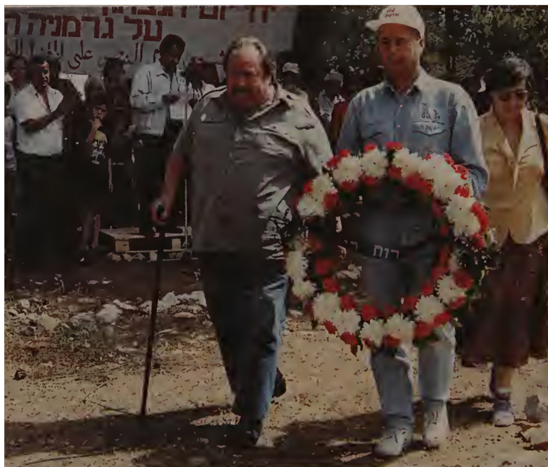
В Лесу Советской армии, что под Иерусалимом. 1993 год.