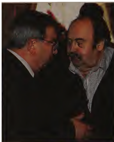
Бывший посол с бывшим министром, 1999 год.