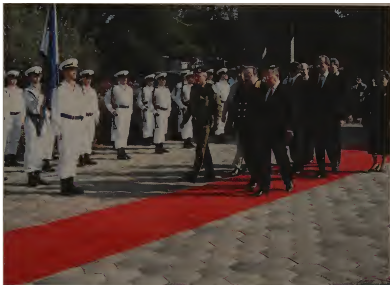
«Восхождение»: иду вручать верительные грамоты. 1991 год.