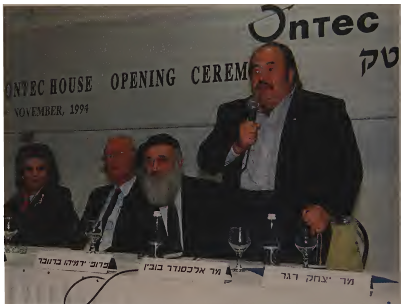
Открытие фирмы «Онтек» («русские» олимпы выдают новую технологию). Справа от меня профессор Герман Брановер, премьер-министр Израиля Ицхак Рабин и его жена Лея. 1994