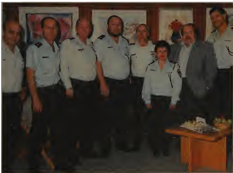
Моя полиция меня бережет. Начальник полиции Тель-Авива Габи Лост со товарищи, 1993 год.