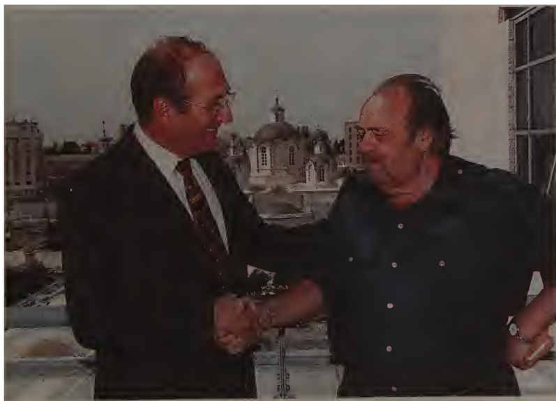
С мэром Иерусалима Эхудом Ольмертом, 1997. Вдали — собор Св.Троицы. Ныне стоящий на нашей земле.