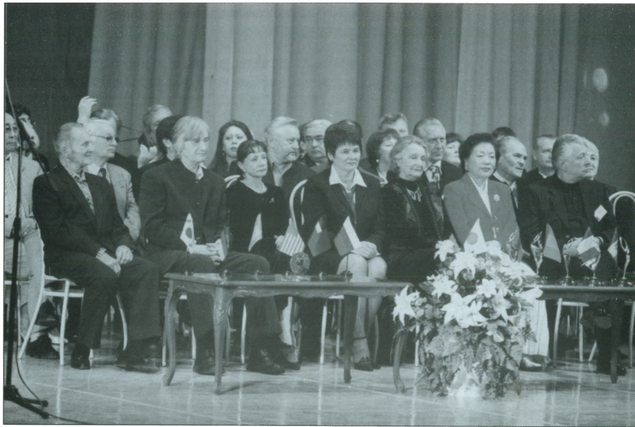
Открытие конкурса «Арабеск-2004».