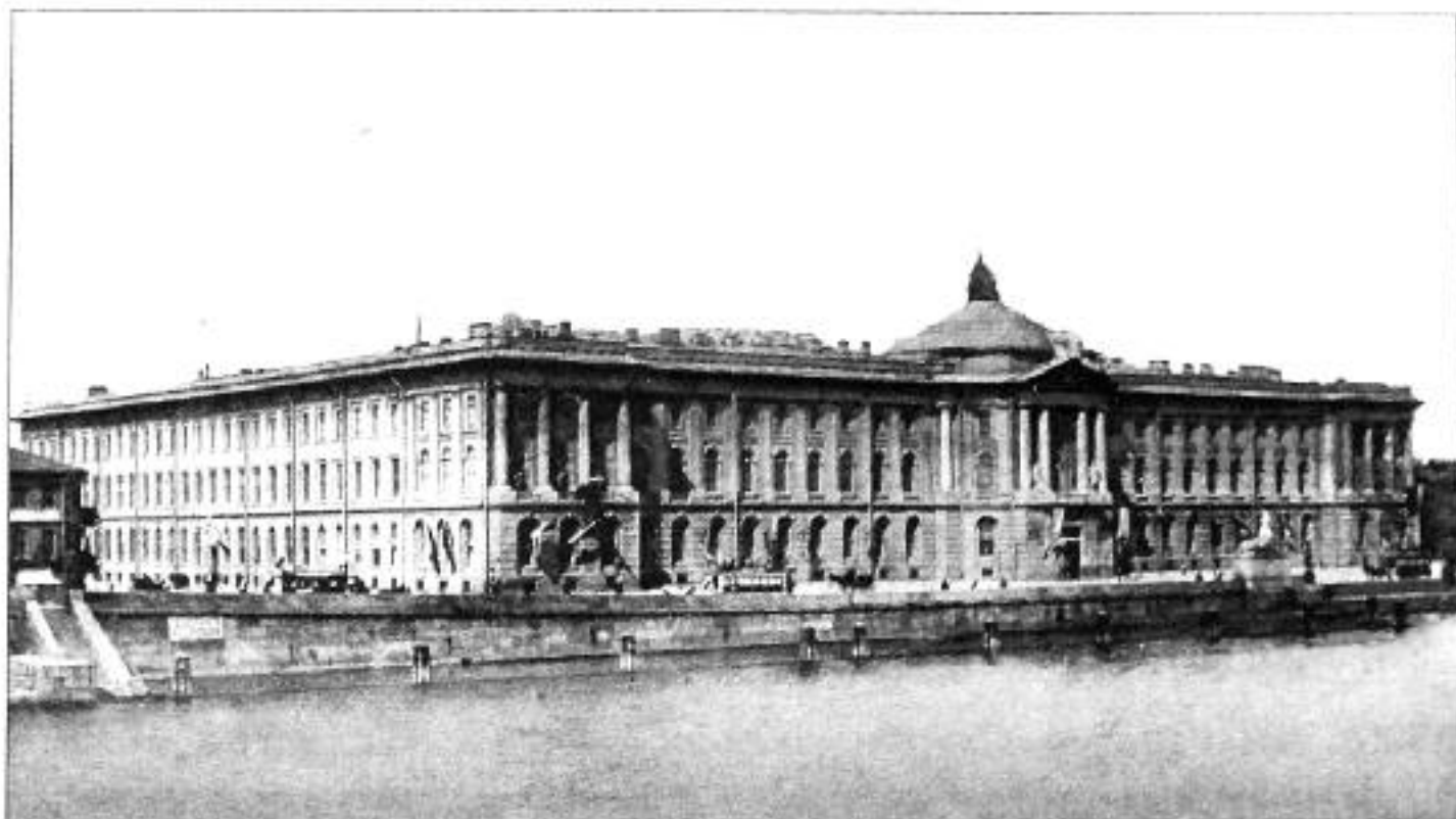
Открытка нач. XX в.

Академия художеств была учреждена решением Сената в 1757 году по инициативе выдающихся деятелей России – ученого М.В. Ломоносова и графа И.И. Шувалова; Устав и Привилегии утверждены в 1764 году при императрице Екатерине II. В 1764-1788 годах на участке между 3-й и 4-й линиями Васильевского острова, вдоль набережной реки Невы, было построено величественное здание, предназначенное для «Академии трех знатнейших художеств». Авторами проекта были профессора-архитекторы Ж.-Б. Валлен-Деламот и А.Ф. Кокоринов. В 1832-1834 годах перед главным входом в Академию архитектором К.А. Тоном сооружена каменная пристань с двумя сфинксами по сторонам. Во второй половине XIX – начале XX века по проектам архитекторов А.И. Резанова, Ф.И. Эппингера, Л.Н. Бенуа, В.А. Щуко была изменена отделка помещений в здании. Ныне в стенах Академии (Университетская наб., д.17) находится Институт живописи, скульптуры и архитектуры им. И.Е. Репина, Научная библиотека и Научно-исследовательский музей Академии художеств.