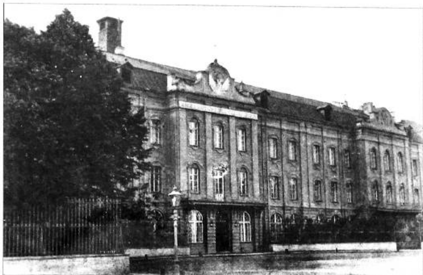
Императорский Университет. Открытка нач. XX в.

Н.К. Рерих был зачислен в Императорский С.-Петербургский университет на юридический факультет. Параллельно он слушал лекции на историко-филологическом факультете.