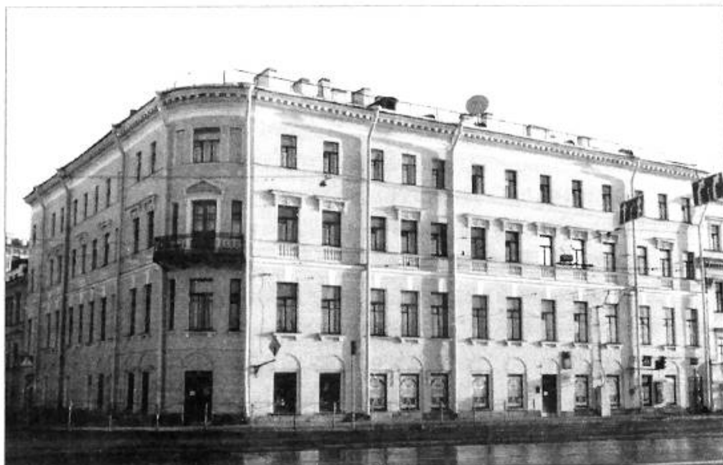
Университетская наб., 25. Фото 1997 г.