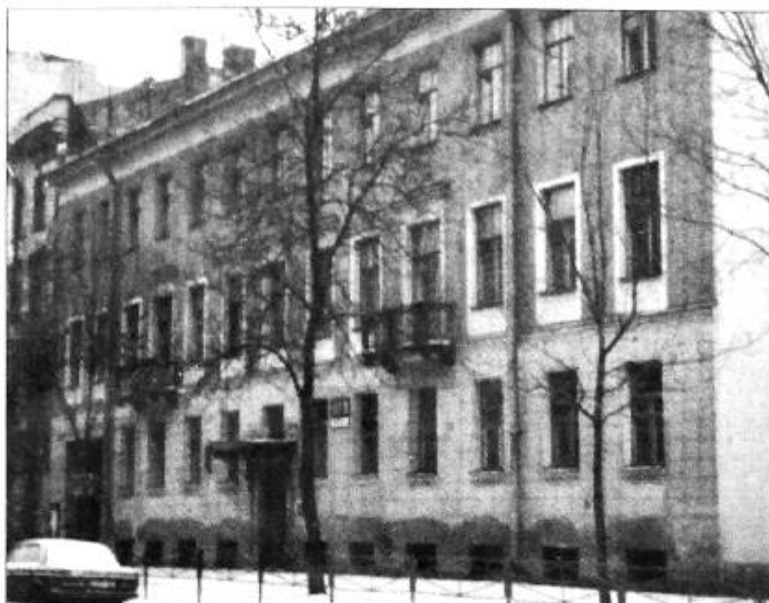
10 линия, 13. Фото 1997 г.

В 1856 году по инициативе нескольких немецких предпринимателей на 1-й линии Васильевского острова была открыта частная мужская школа. Возглавил ее педагог-практик Карл Иванович Май, который избрал в качестве основного девиза изречение основоположника современной педагогики Яна Амоса Коменского: «Сперва любить – потом учить», в соответствии с которым был создан коллектив педагогов, состоящий из людей с высокими нравственными и профессиональными качествами. В дальнейшем школа получила название «Гимназия и реальное училище К. Мая», а ученики и педагоги школы стали называть себя «Майскими жуками».