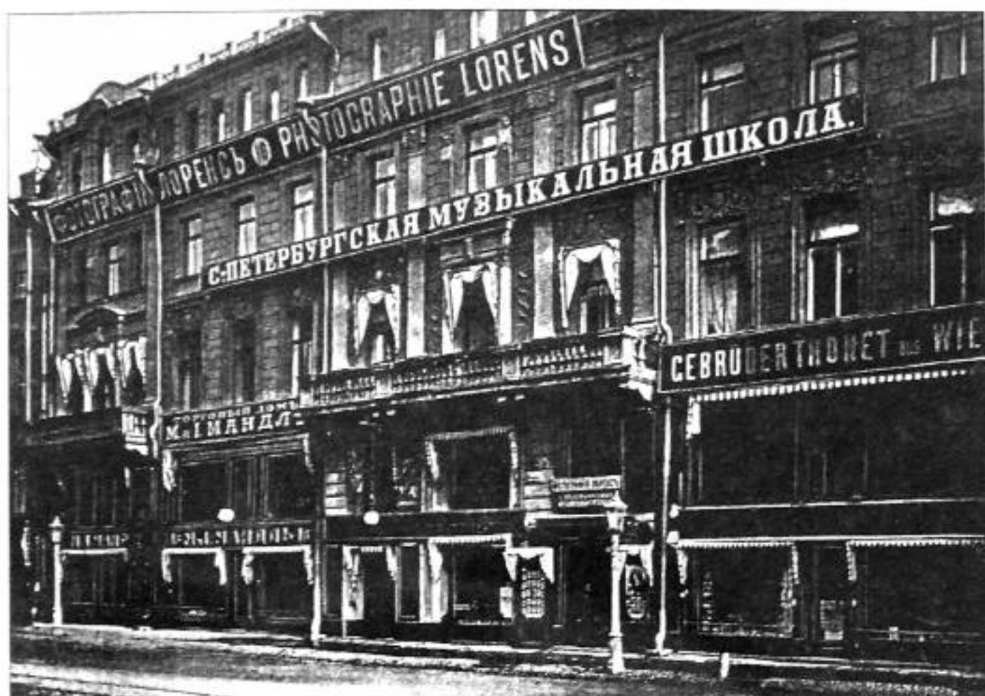
Невский пр., 16. Фото нач. XX в.