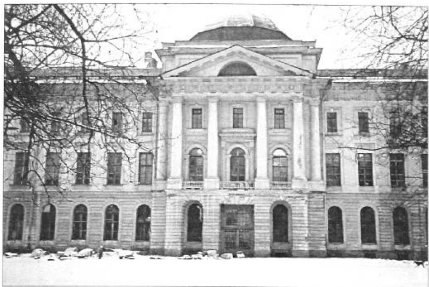
Вид церкви с академического сада. Фото 1998 г.