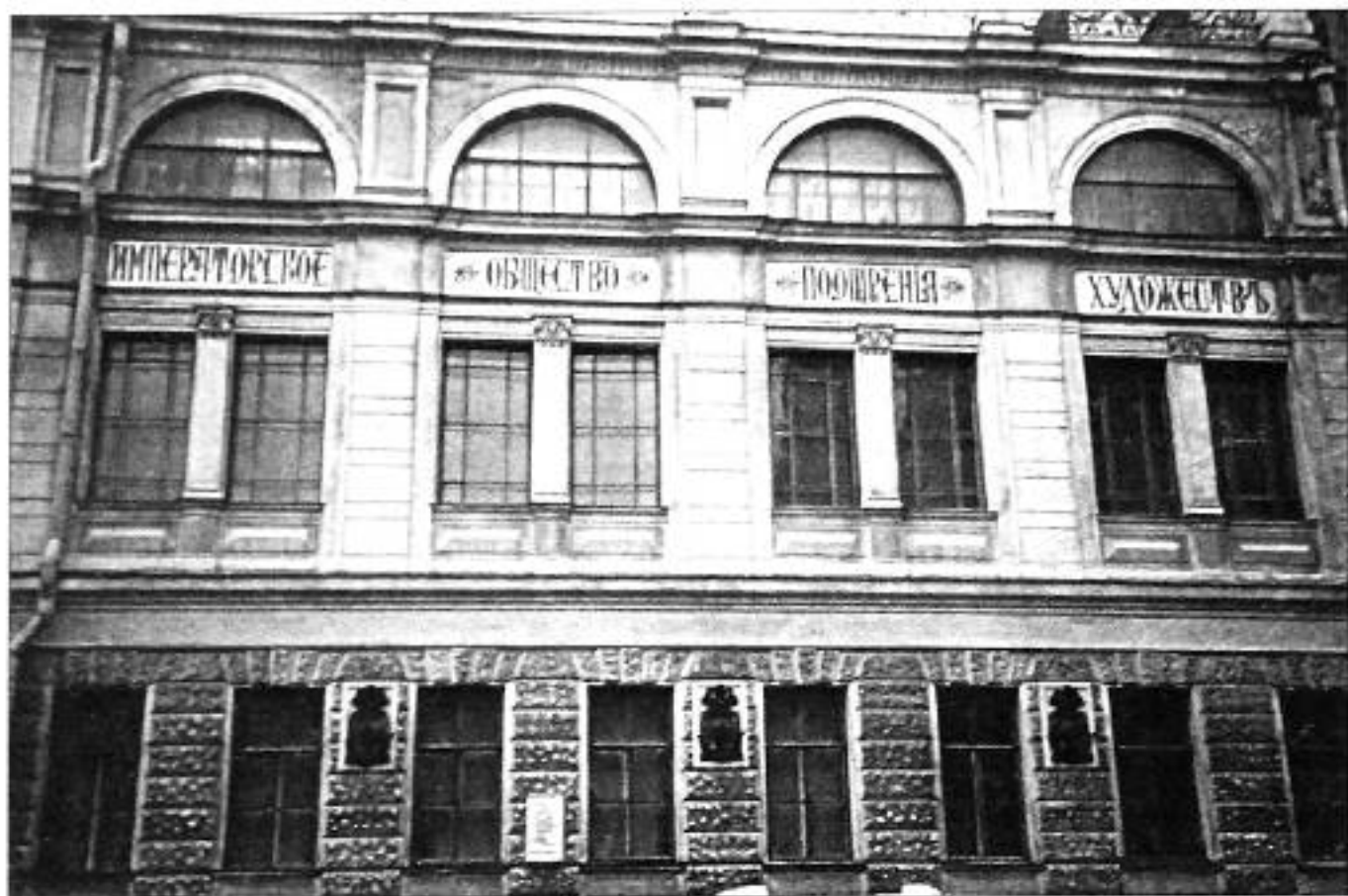
Большая Морская, 38. Фото 1998 г.