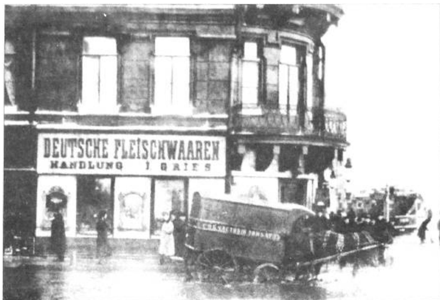
Университетская наб., 25/1. Открытка нач. XX в. (на 2-м этаже квартира, где жили Рерихи).