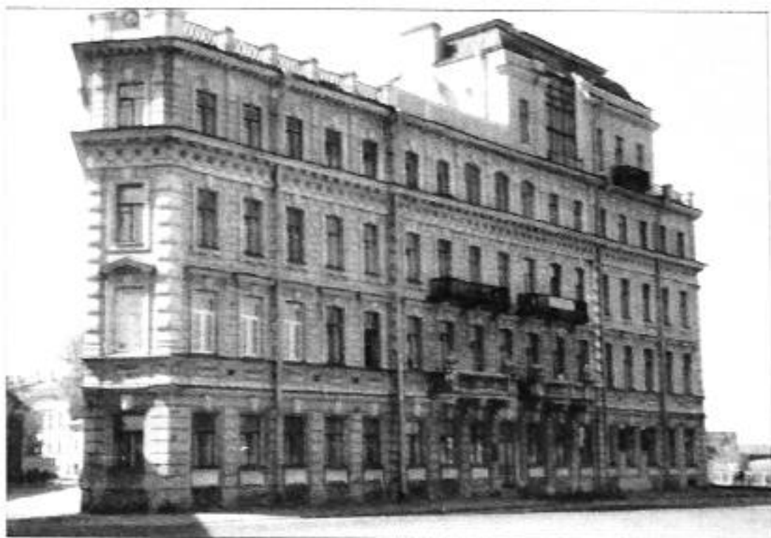
Биржевой пер., 1/10. Фото 1998 г.