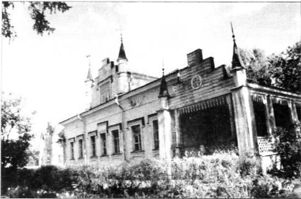
Извара. Музей-усадьба Н.К. Рериха. Фото 2002 г.

Более двадцати лет жизни художника Н.К. Рериха было связано с именем его родителей в деревне Извара. «Двух лет не было, а памятки связались с Изварою, с лесистым помещьем около станции Волосово, в сорока верстах от Гатчины.