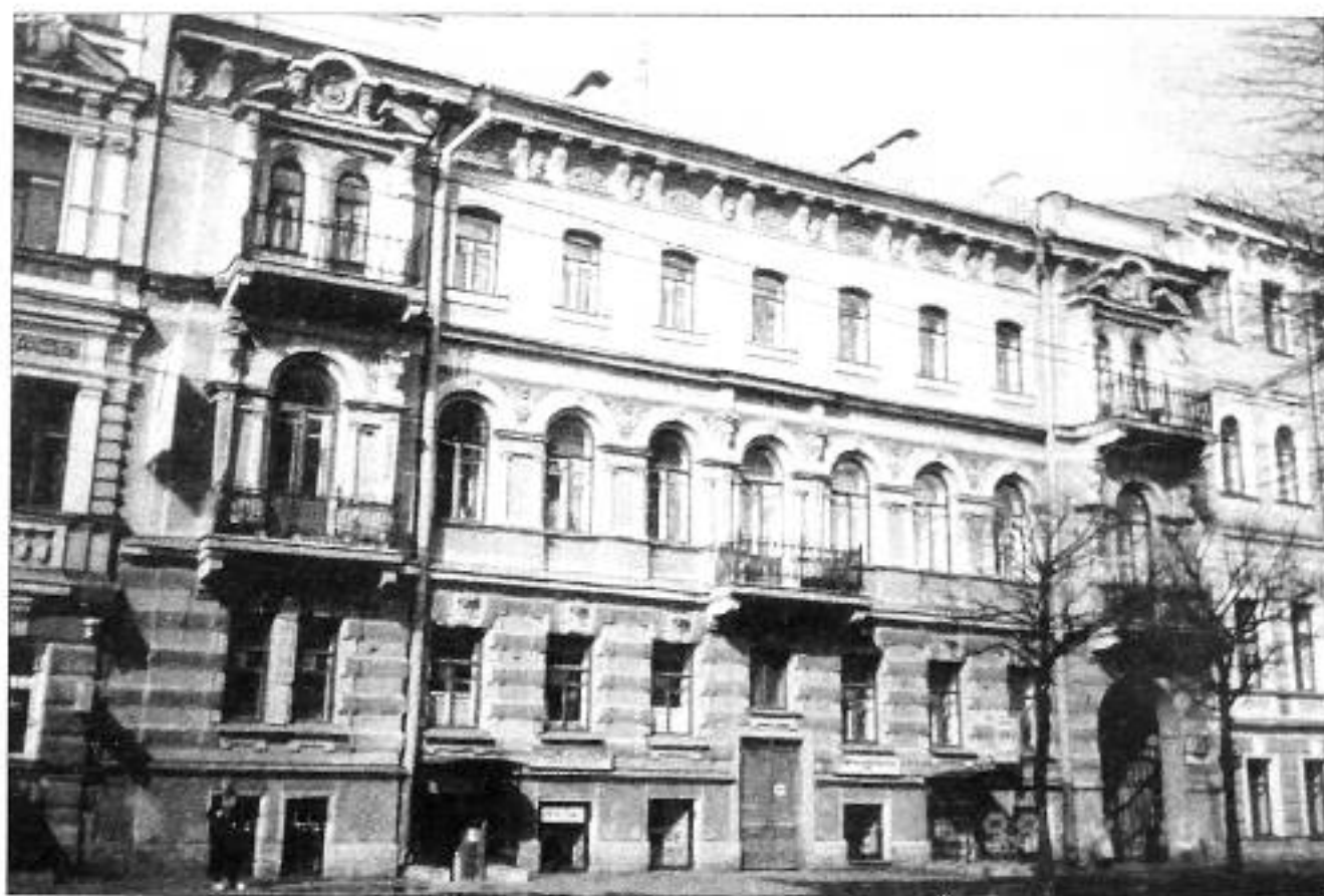
ул. Чайковского, 18. Фото 1998 г.