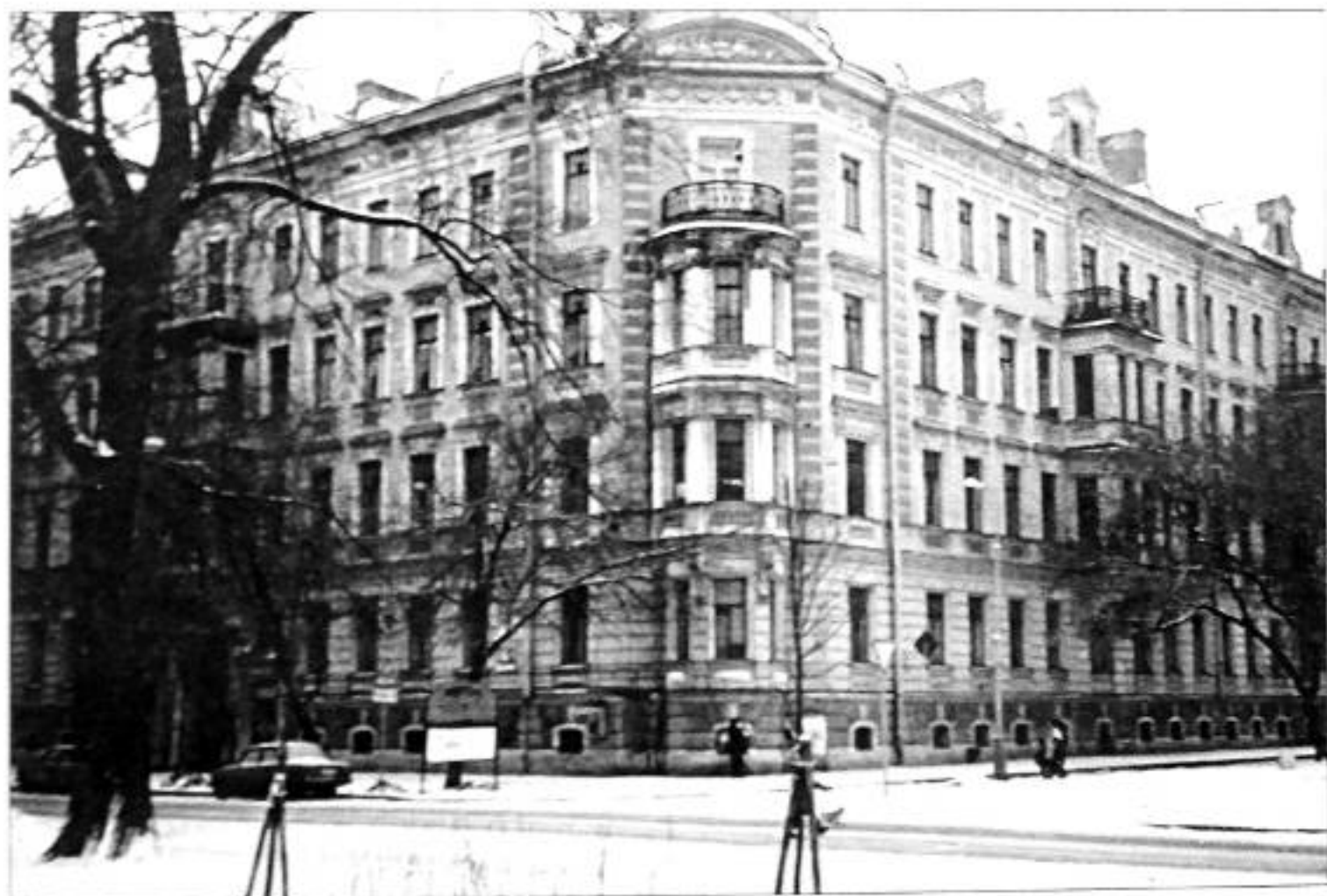
4 линия, 5. Фото 1998 г.