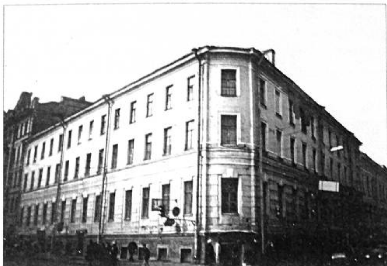
Загородный пр., 13. Фото 1998 г.

и Чернышова переулка, д. 11, у Пяти углов. Дом был построен в 1857-1858 годах по проекту архитектора П.С. Пименова.