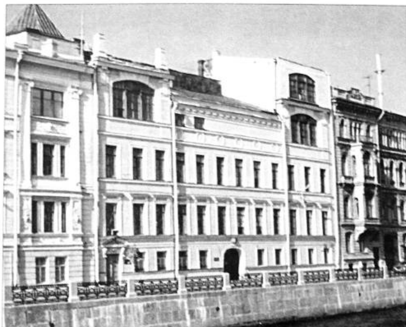
Набережная реки Мойки, д. 83. Фото 1997 г.

ром Рисовальной школы ИОПХ и вместе с семьей переехал на новую квартиру, которая находилась на втором этаже в здании Общества, на Большой Морской ул., 38. Вход в квартиру был со стороны набережной Мойки, дом № 83, но можно было пройти и со стороны Большой Морской улицы, мимо выставочных залов.