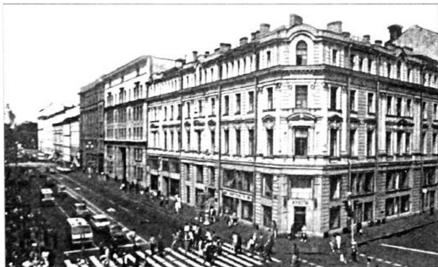
Невский пр., 16. Фото 1980-х гг.