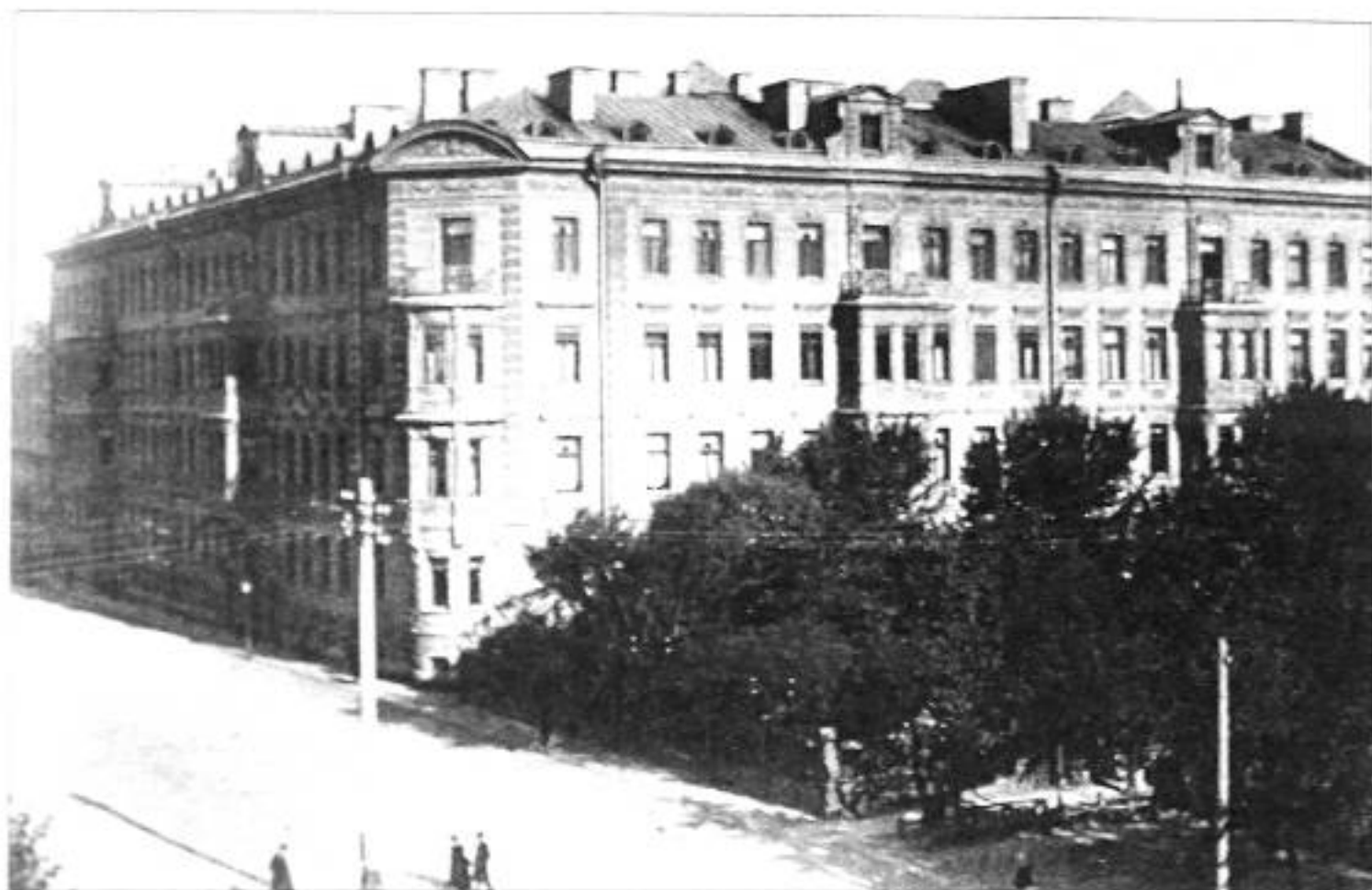
Общий вид дома Л.Е. Кенига. Фото кон. XIX в. ЦГАКФФД.