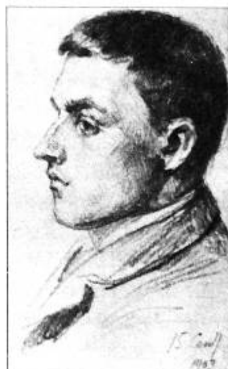
Автопортрет. 1903 г.