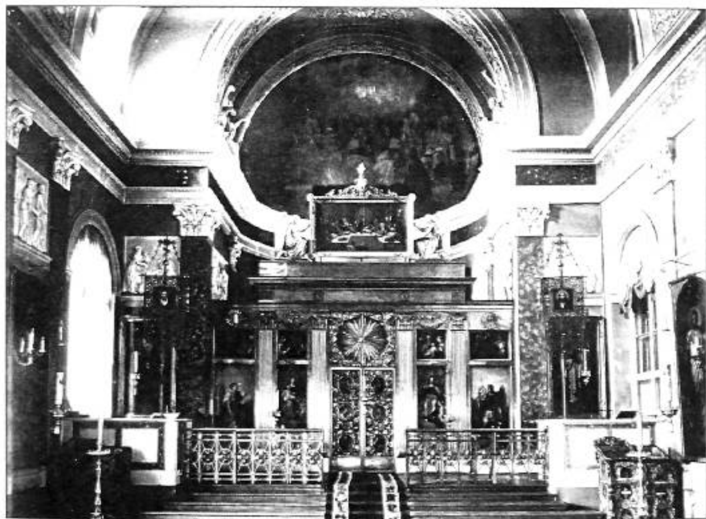
Внутреннее убранство, вид на иконостас. Фото 1914-1917 гг.