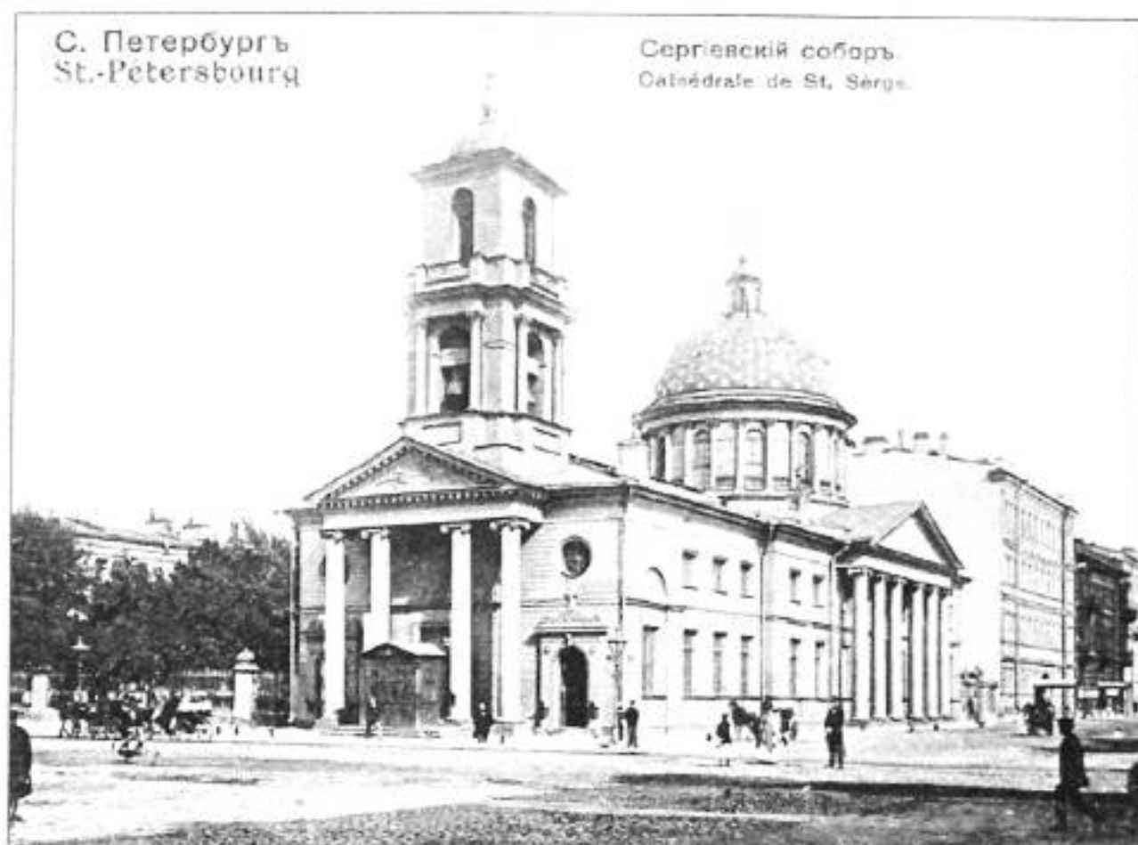
Сергиевский всей Артиллерии собор. Открытка нач. XX в.