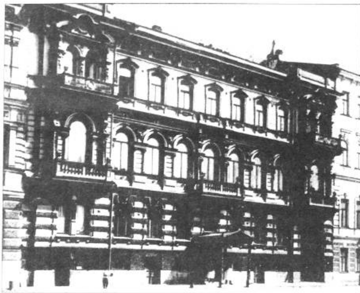
Сергиевская ул., 16. Фото кон. XIX в.