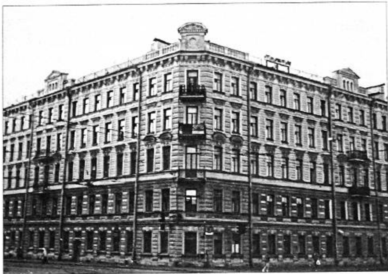
Лиговский пр., 19. Фото 1997 г.