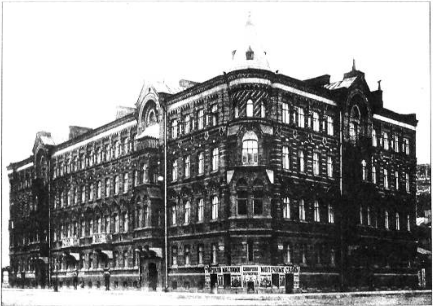
Николаевская ул., 62. Фото нач. 1880-х гг.

С 1880–1884 (?) годы семья Шапошниковых жила на углу Николаевской ул., 62 и Ивановской ул., 16 в доходном доме Шульца (бывший А.О. Мейера), где занимала квартиру под № 14. Дом был построен в 1876 году по проекту архитектора В.А. Шретера.