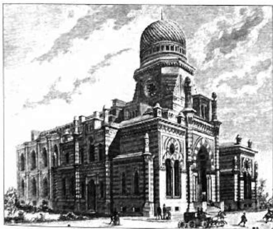
Здание Синагоги. Гравюра Рашевского с рис. Г. Бrolлинга. Кон. XIX в.

Автор целого ряда жилых домов, культовых и промышленных зданий в формах эклектики. Построил множество дач в окрестностях С.-Петербурга. Самая яркая и грандиозная постройка – Петербургская хоральная синагога. Проект, занявший первое место в отборочном конкурсе, осуществлен в 1880 году