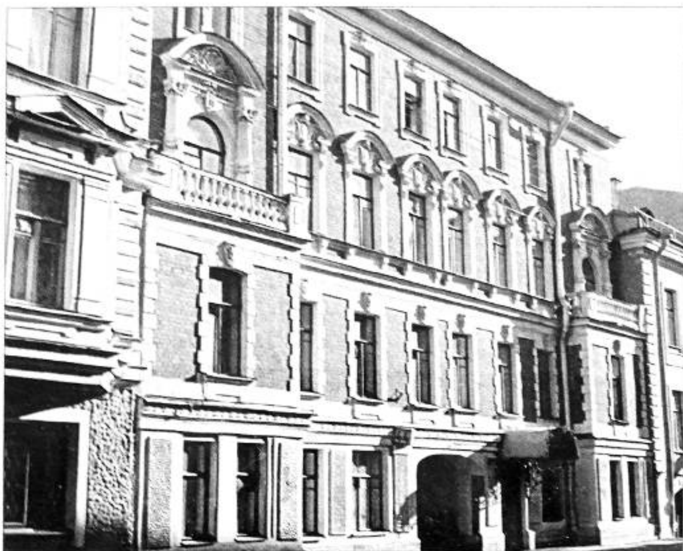
Фото 1997 г.

Вскоре после свадьбы, в конце 1901 года, семья Рерихов переехала с Васильевского острова на Галерную улицу в дом № 44, в квартиру под № 5 на 2-м этаже.