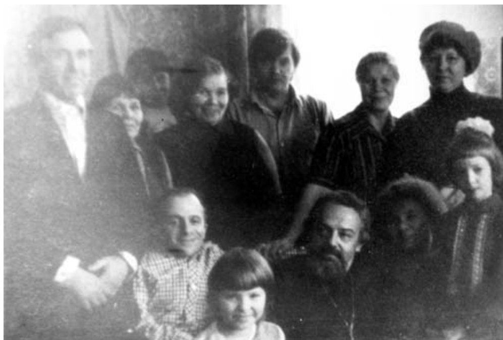
Редкое фото. Конспиративная встреча с молитвенной группой