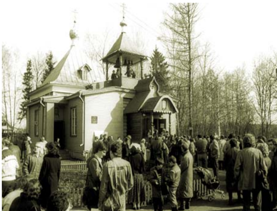
Перед храмом в Новой Деревне

Стало очевидным, что религия больше не является достоянием старых необразованных женщин. Молодежь, интеллигенция, не только женщины, но и мужчины тоже обратились к Богу.