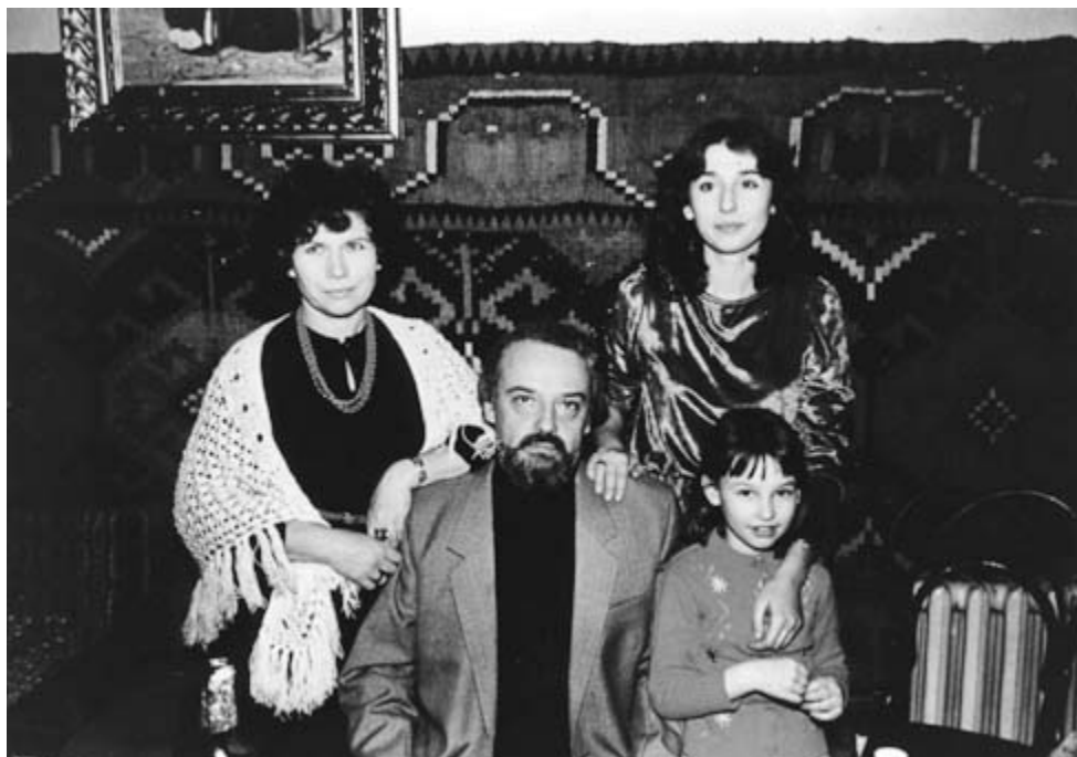
20.01.85 Семхоз. Празднование 50-летия