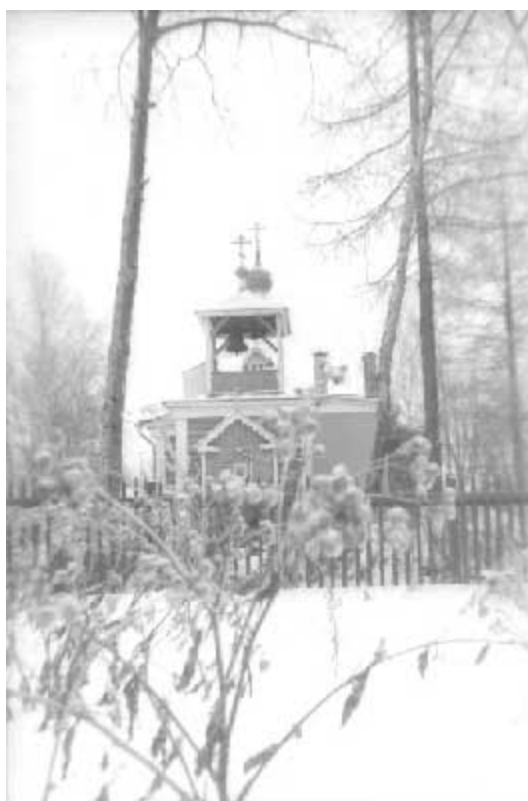
Храм в Семхозе. 70-е гг.

состоянии, когда надо было непрерывно следить за самим собой, обуздывать себя и заниматься самоцензурой. [103] Механизм «двоемыслия» описан с клинической точностью английским писателем Оруэллом: «Знать и не знать, чувствовать себя вполне правдивым и говорить при этом тщательно сочиненную ложь, придерживаться одновременно двух мнений, взаимно друг друга исключаящих... Применять логику против логики, отрицать мораль и одновременно ссылаться на нее... Сознательно привести себя в бессознательное состояние, а затем заставить себя забыть тот факт, что вы только что подвергли себя гипнотическому воздействию». [104]