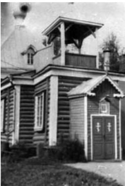
Церковь в Новой Деревне. 1977 г.

Церковь в Новой Деревне, где он служил ровно двадцать лет, освящена в честь Сретения Господня. По-русски название этого праздника этимологически связано со словом «встреча». Встреча Нового Завета в лице младенца Иисуса с Ветхим Заветом. Младенец Иисус приходит, чтобы принести свет народам, т. е. неверующим. А когда Дева Мария подносит своего сына к Симеону, старец говорит ей: «И Тебе самой оружие пронзит душу»... Разве не является символом всего служения отца Александра тот факт, что храм посвящен Сретению?