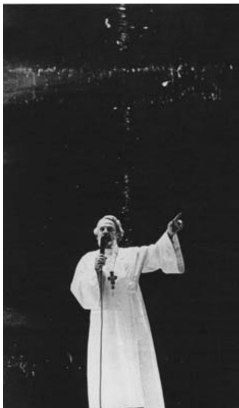
Выступление в Олимпийском комплексе. Пасха 1990 г.

В Новой Деревне, где он, наконец, был назначен настоятелем, он приступил к строительству здания, которое согласно его оригинальному плану, должно было одновременно служить и крестильней, и залом для разных приходских дел. Ему не было дано осуществить этот проект. И, наконец, для обучения катехизису деревенских детей, он открыл «воскресную школу». Торжественное начало учебного года состоялось ровно за неделю до того дня, как его убили.