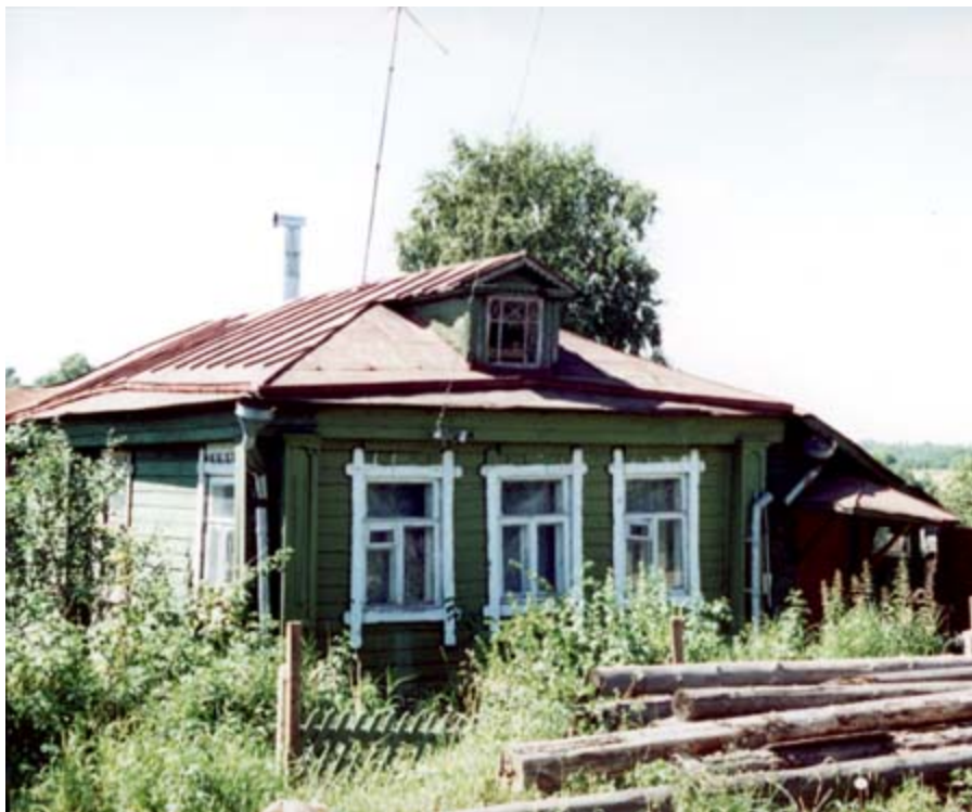
Дом, в котором скрывался и служил архимандрит Серафим.

Через Веру отец Серафим тут же посоветовал Елене найти жилище в Загорске или в окрестностях и обосноваться здесь с детьми, что она и сделала, к великому удивлению друзей и знакомых, поскольку осенью, перед приближением вражеского войска москвичи удирали из столицы. Но отец Серафим был убежден, что это место находится под защитой преподобного Сергия.