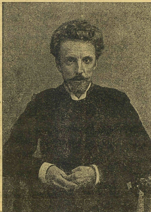
Сергѣй Петровичъ Мельгуновъ