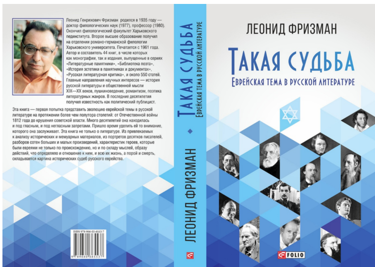
Л. Фрицман. Такая судьба. Еврейская тема в русской литературе. Харьков: Фолио, 2015