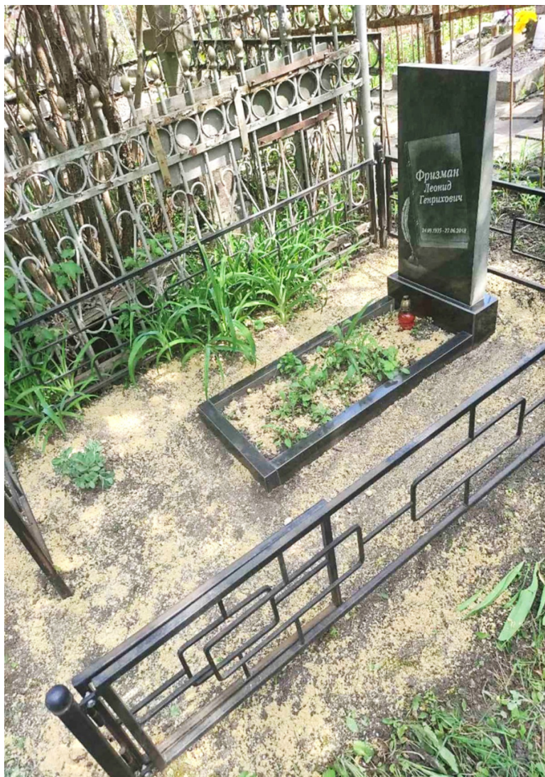
Могилы Л. Г. Фризмана на 3-м городском кладбище Харькова. 2025