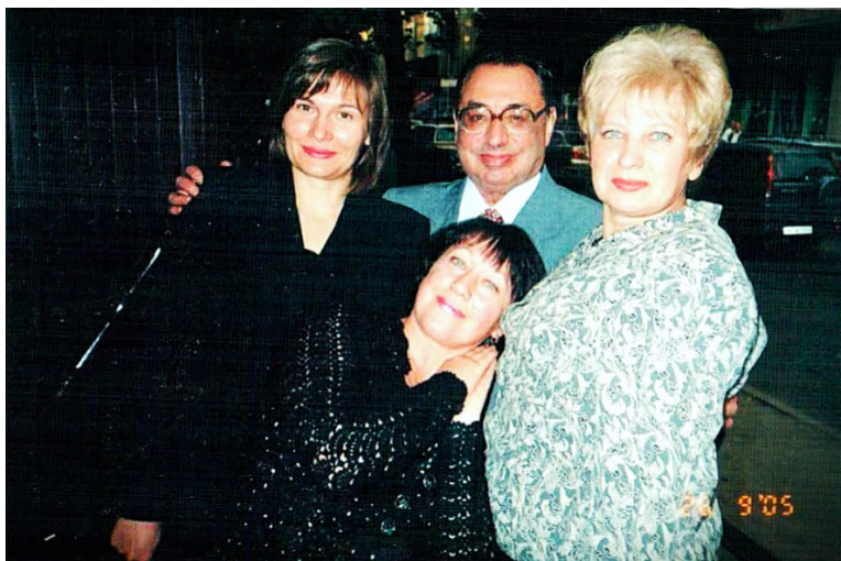
С коллегами в день 70-летия. 24 сентября 2005