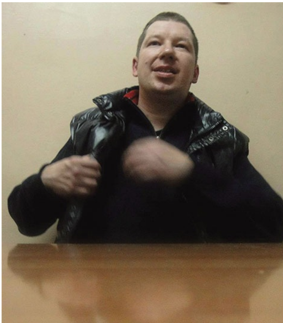
На свидании в КП-13, Кохма, 2013