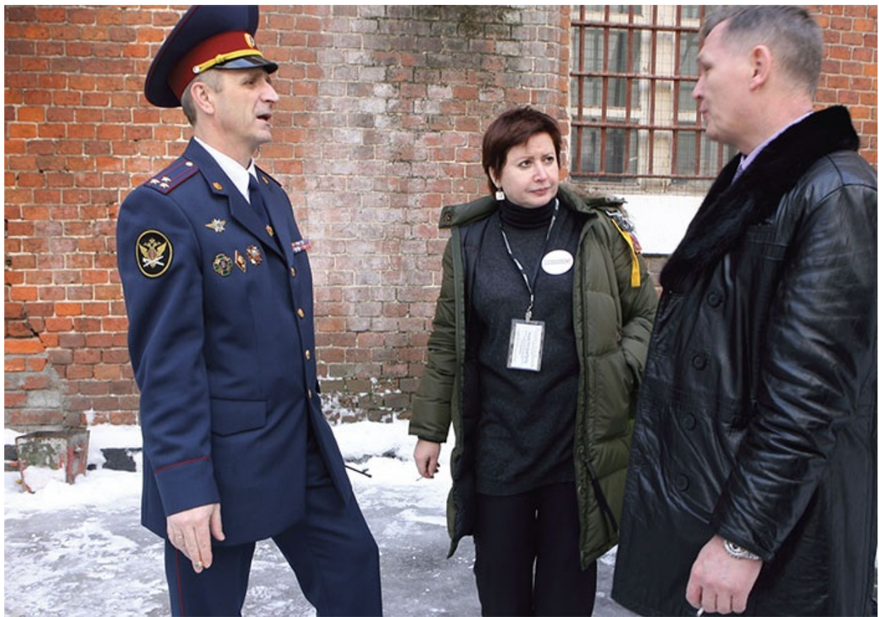
Бутырка. Начальник тюрьмы Сергей Телятников