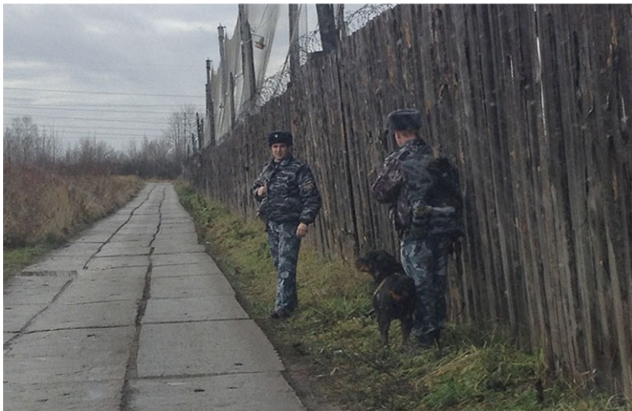
Зона строгого режима, ИК-5, Кохма