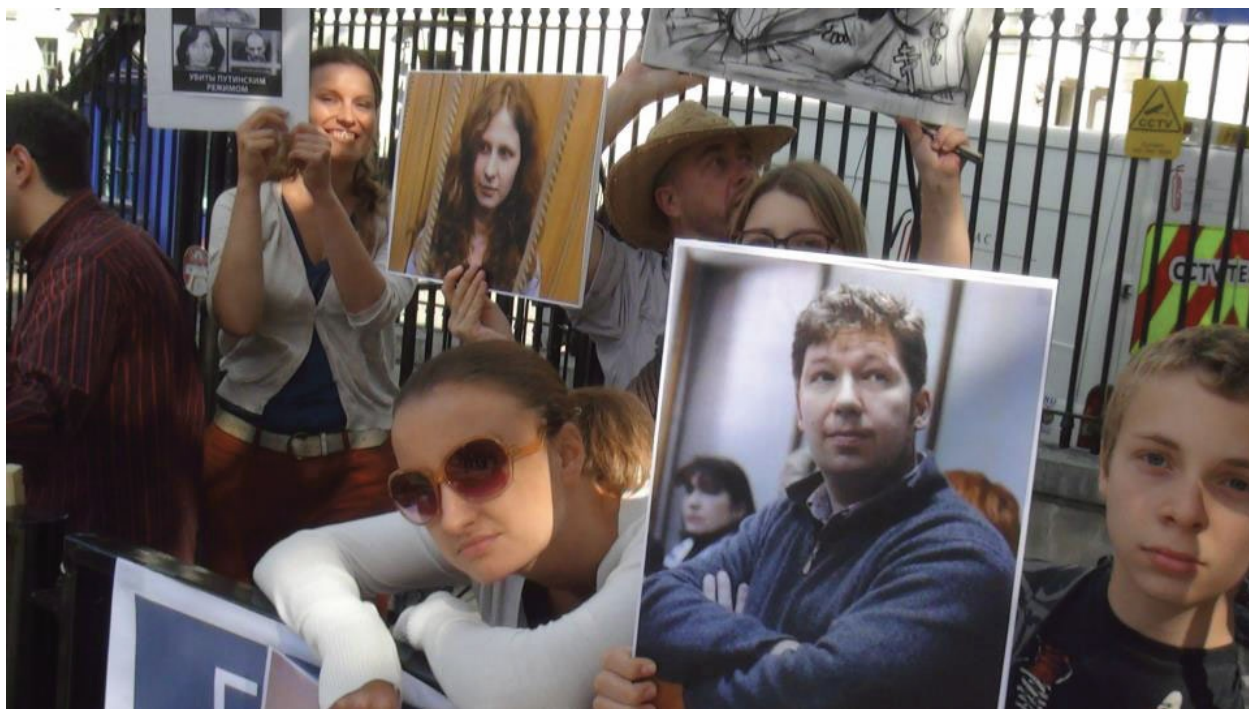
Акция «Говорите громче!», Лондон, сентябрь 2012