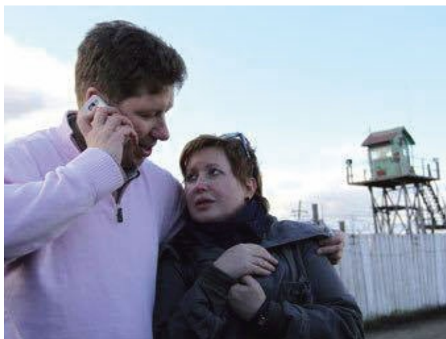
Освобождение из колонии в Пермском крае, сентябрь 2011