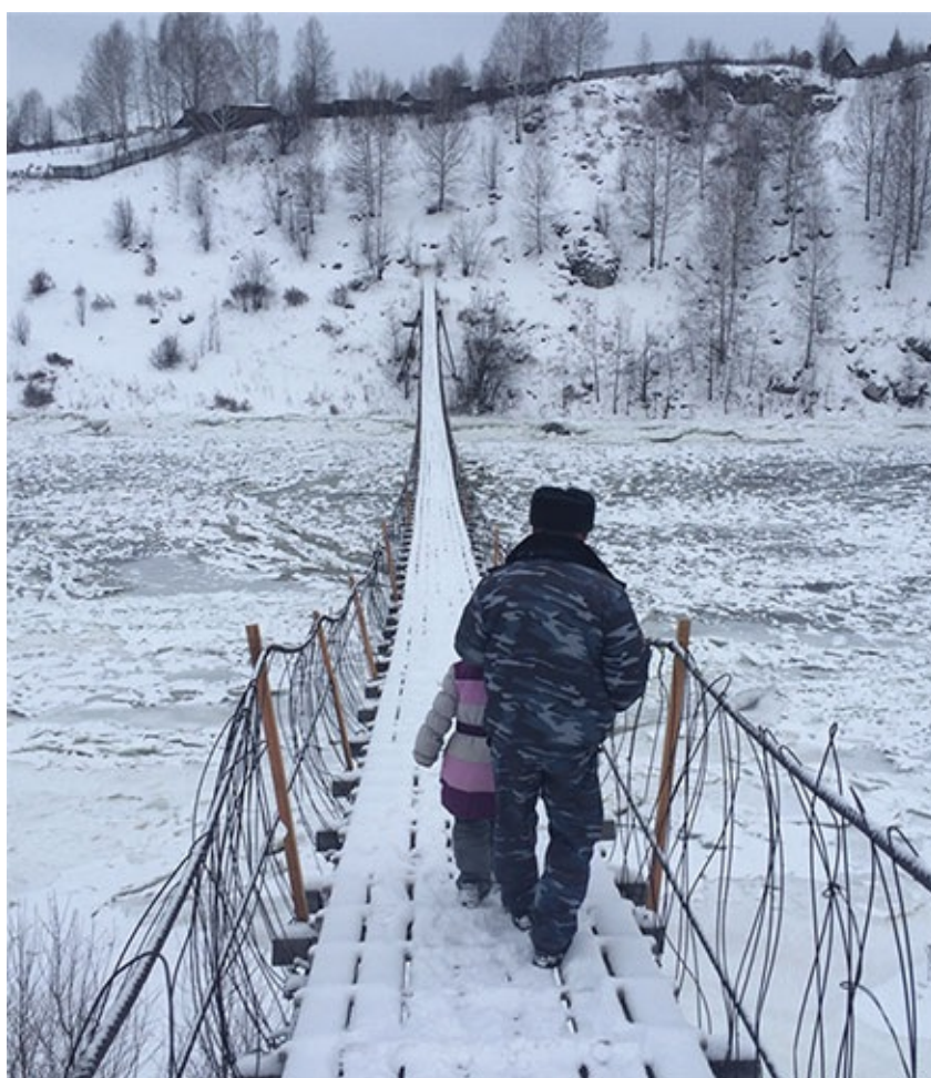
Станция Половинка, Пермский лагерный край