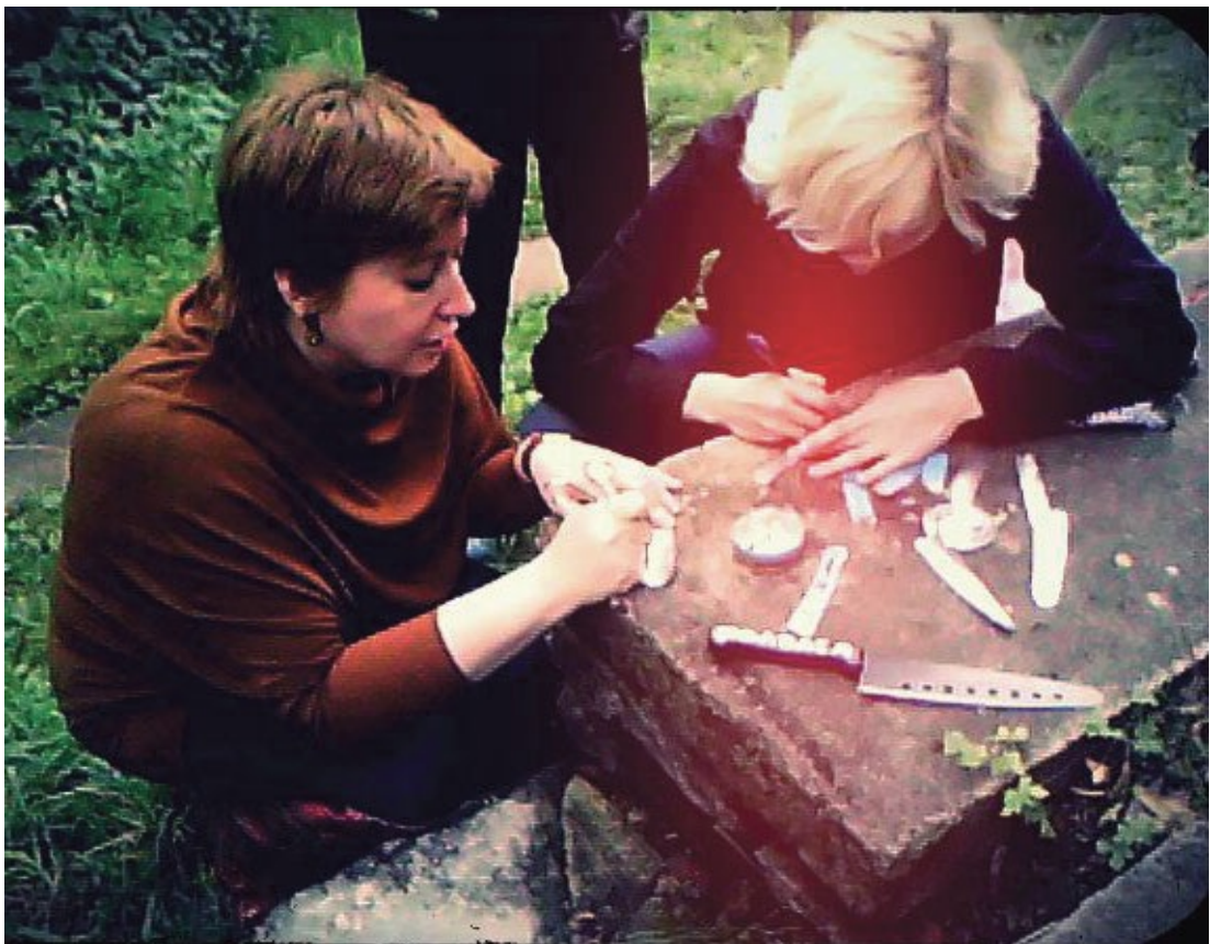
Сажаем яблони в доме престарелых (Тульская обл.), на каждой яблоне — табличка с именем невинно осужденного