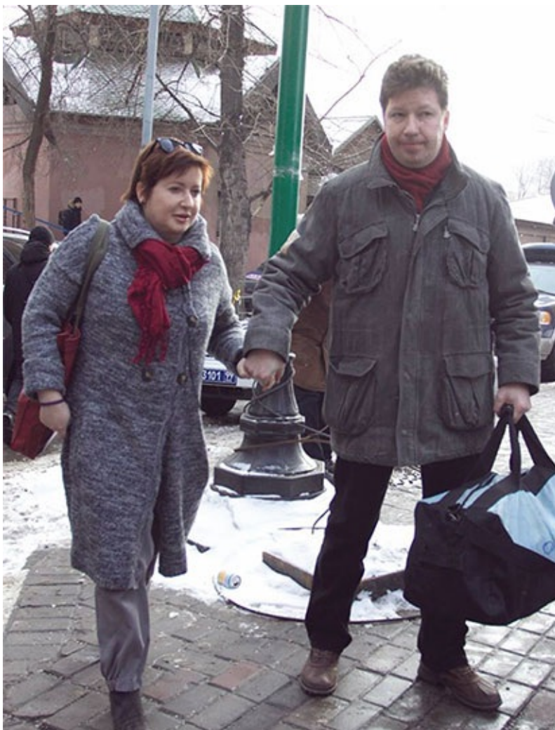
Март 2012, на суд с вещами