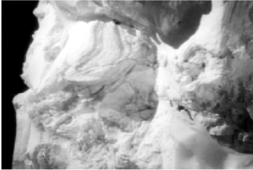
В ледовых сбросах