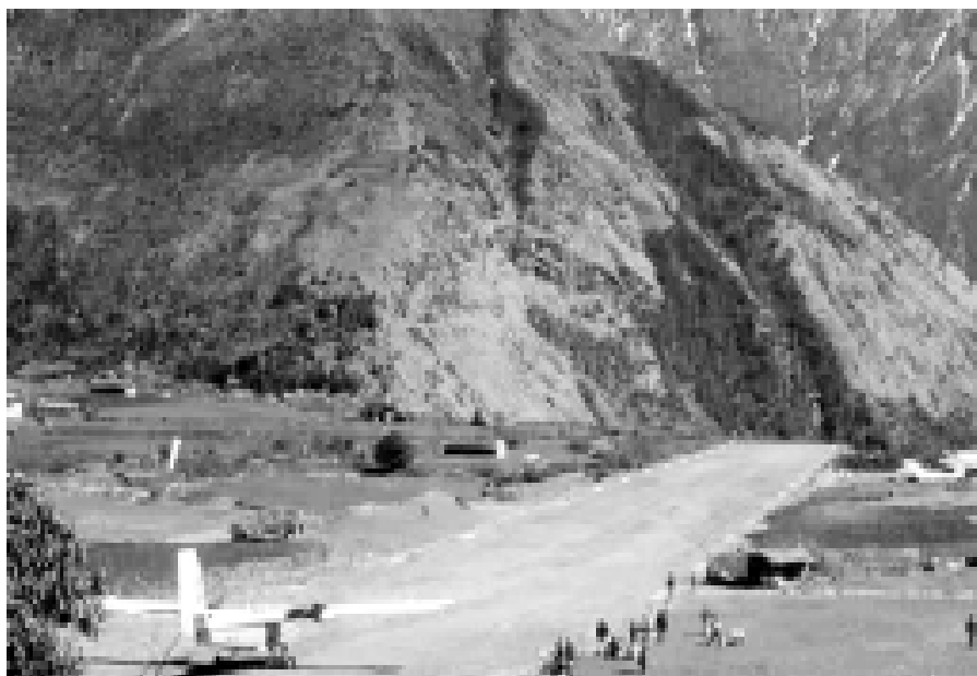
Посадочная площадка («Аэропорт») в селении Лукла