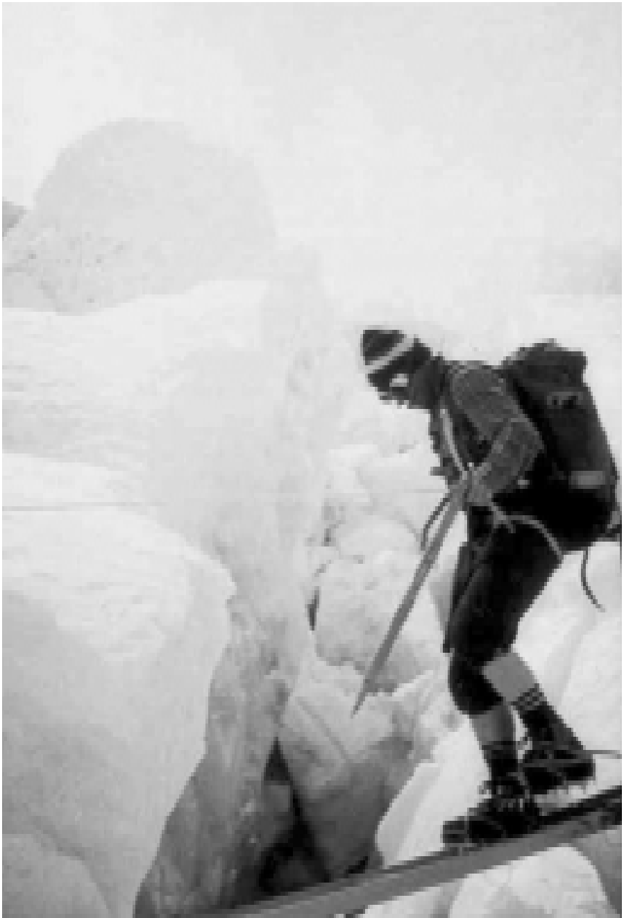
Трещина Москальцова в ледопаде Кхумбу