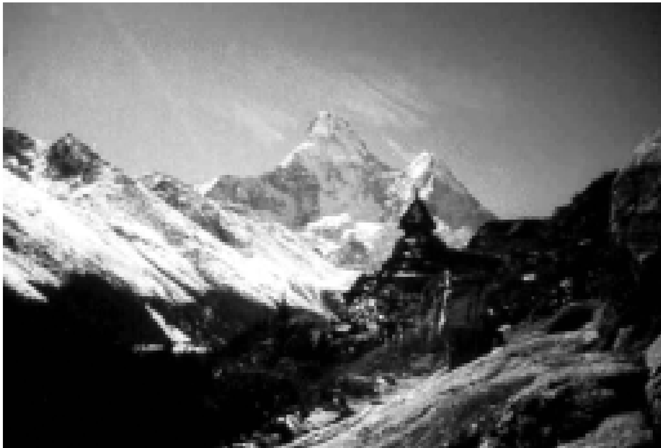
Вершина — красавица Амадаблан. Вид от монастыря Тьянбочи