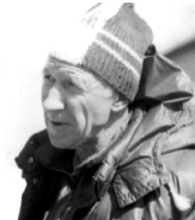
Автор «Записок» (1982 г., Гималаи)