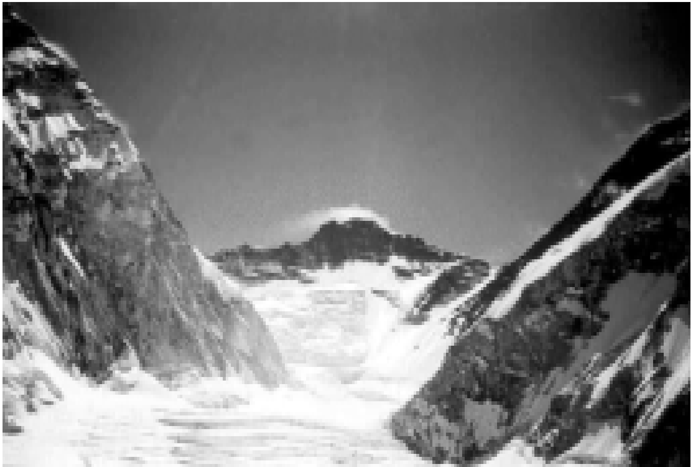
Долина «молчания» (верховья ледника Кхумбу). На переднем плане, слева — начало маршрута экспедиции по юго-западной стене Эвереста