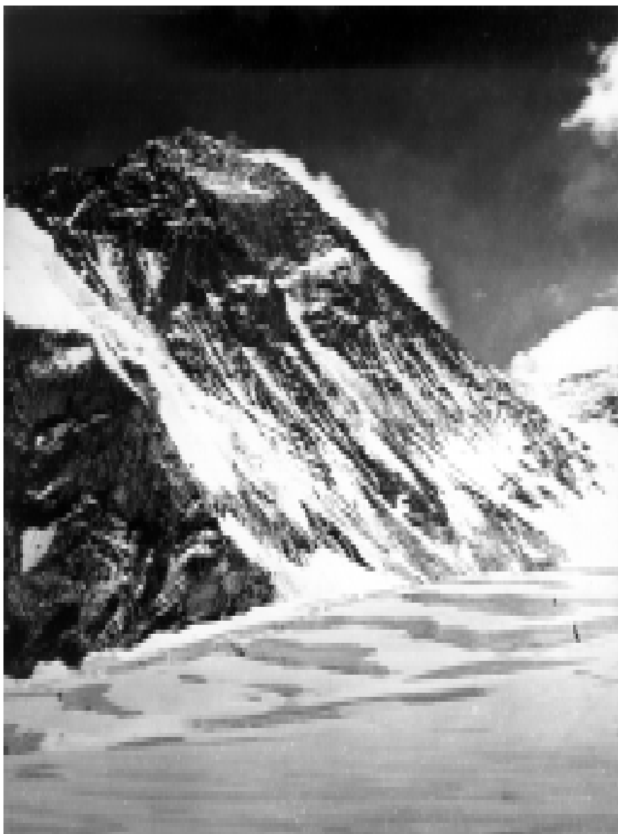
Эверест (юго-западные склоны, от 6500 до 8848 метров над уровнем моря)