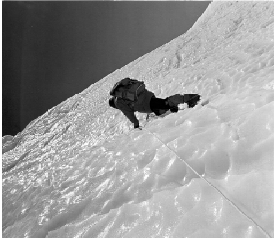
На подходах к «ледовому ножу»