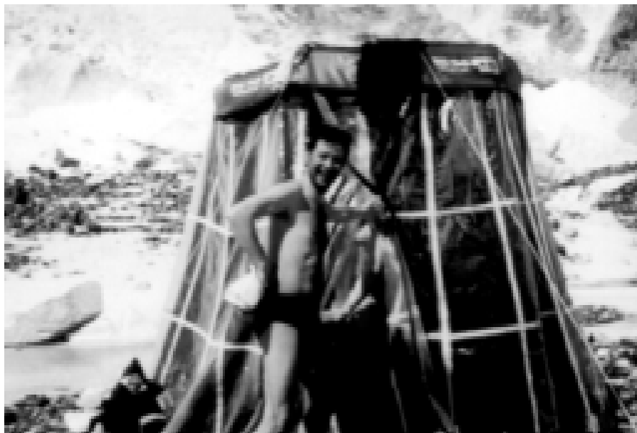
Баня на леднике в базовом лагере