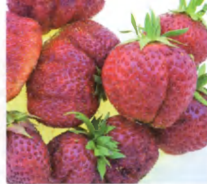
Дарселект. Сорт среднего срока созревания. Ягоды ширококонические, очень сочные, десертного вкуса. Устойчивость к болезням средняя.