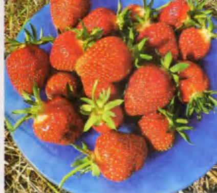
Кокинская ранняя. Сорт раннего срока созревания, зимостойкий. Ягоды кисло-сладкие. Отличается дружным созреванием ягод.