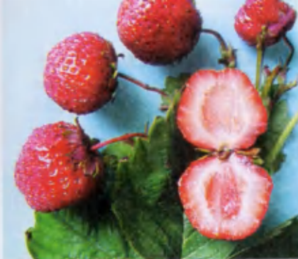
Зенга Гигана . Сорт среднего срока созревания, отличается повышенной потребностью к влаге. Мякоть красная, плотная. Вкус хороший.

В моей небольшой коллекции следующие сорта: Боровицкая , Вента , Зенга Гигана , Царскосельская , Эльвира , Заря , Фестивальная ромашка , Холидей , Найдена добрая , Урожайная ЦГЛ , Марышка . Самыми сладкими считаю Марышку , Венту и Зенгу Гигану . Эльвира и Царскосельская выделяются гармоничным вкусом и ароматом, Холидей и Заря – самые ранние; поздняя – Боровицкая – кисло-сладкая и отличается специфическим вкусом, на любителя.