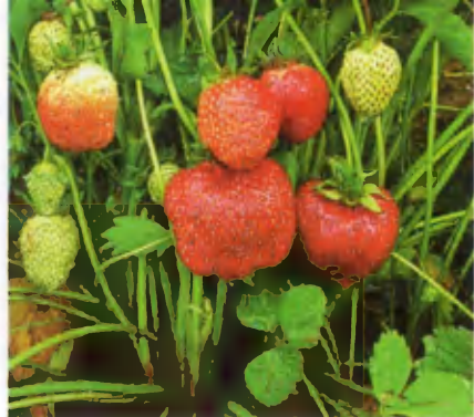
Избранница. Сорт среднего срока созревания, зимостойкий. Вкус ягод кисло-сладкий. Устойчив к серой гнили, бурой пятнистости.