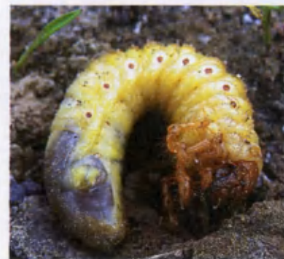
Личинка майского хруща