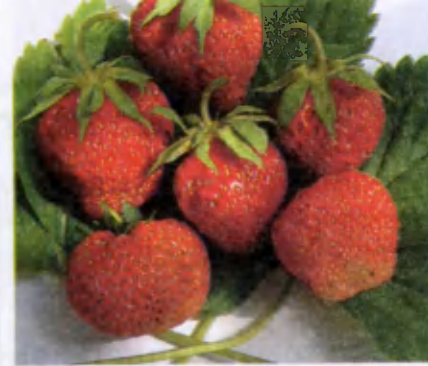
Найдена добрая . Сорт раннего срока созревания, высокоурожайный. Ягоды крупные, сочные, десертного вкуса. Устойчив к болезням.