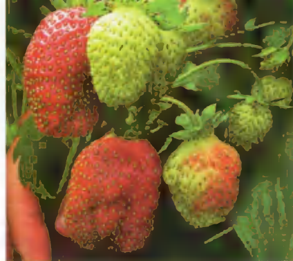
Марышка. Сорт среднего срока созревания с повышенной зимостойкостью. Ягоды кисло-сладкого десертного вкуса до 20–25 г каждая.