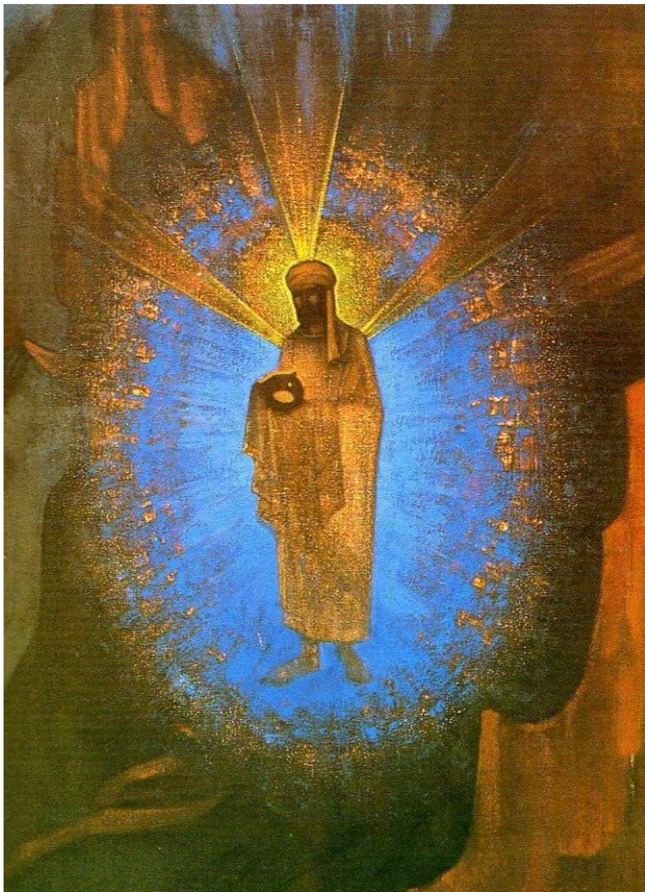
Н.К.Перих «Fiat Rex» Триптих. Центральная часть.