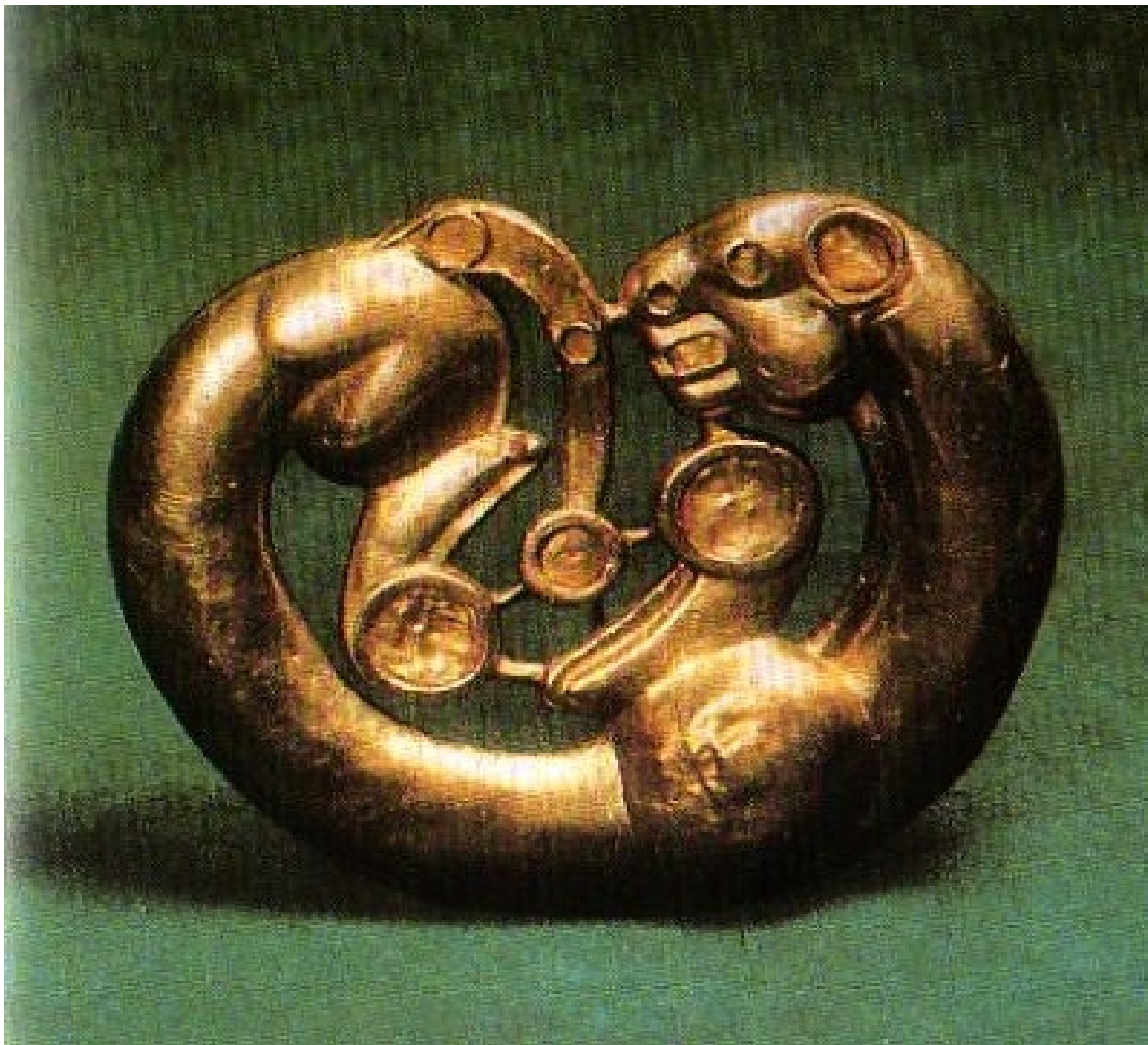
Золотая застёжка, «звериный» стиль. Сибирская коллекция.

сужденные сроки открывают тайники свои. Как бы случайно, а в сущности, может быть, логически предугазано, точно бы океанские волны, выбрасывают целые гряды знаменательно одноподобных находок. Так и теперь, после Венгрии, после Кавказа и Сибири появились прекрасные находки Луристана, среди Азиатских пространств, а теперь и Алашани и Ордоса и, вероятно, среди многих других, как бы предназначенных местностей.