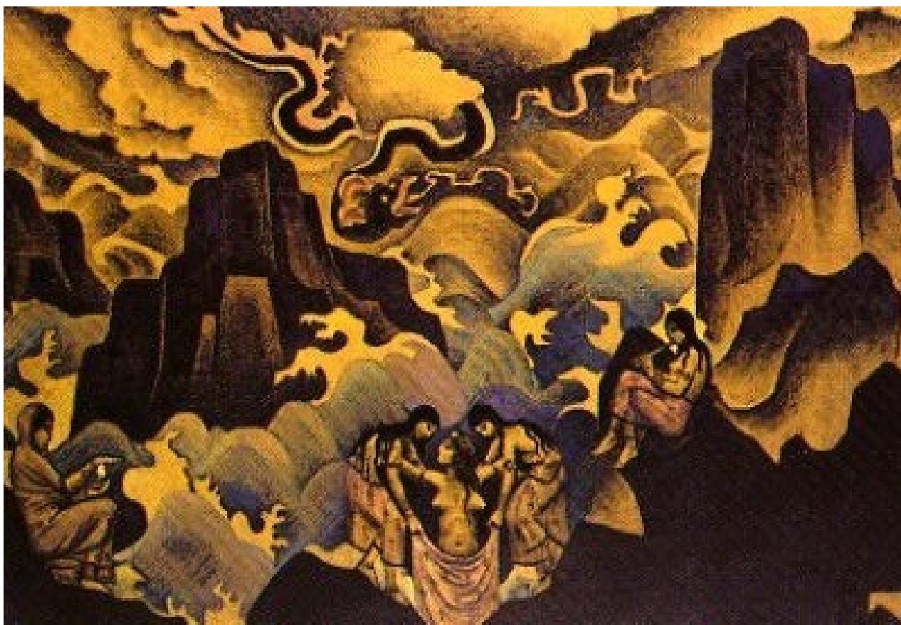
Н.К.Рерих «Змей» (Рождение мистерий).

Такое опережение дает возможность пробить энергетический тоннель, по которому пойдут за ними грядущие поколения. Среди высоких воплощений, обогнавших свое время, мы видим, например, индийского императора Акбара, жившего в XVI в. Его деятельность совпала с мировым периодом религиозной нетерпимости и религиозных войн, когда фанатизм приверженцев той или иной религии разросся до небывалых размеров. На этом фоне деяния Акбара в духовной жизни своей империи выглядели необычно и не были поняты его современниками. Будучи мусульманином по вероисповеданию, он отказался сделать ислам государственной религией в Индии и пытался создать религию, куда бы вошло все лучшее из мировых духовных учений. Он справедливо считал духовные учения объединяющим началом и тогда, в далеком XVI в., высказывал идеи, которые стали волновать по-настоящему культурное человечество только в XIX-XX вв. Акбаровская Индия за несколько десятков лет превратилась, вопреки всем историческим обстоятельствам, в страну религиозной терпимости. И когда в середине XX века, накануне предоставления колониальной Индии независимости, вспыхнули индусско-мусульманские погромы, столкновения и междоусобицы, сторонники духовно-политического единства не раз призывали на помощь имя императора Акбара, не раз поднимали над собой его знамя.