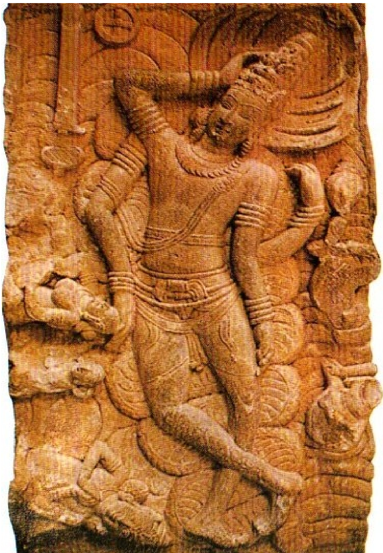
Бог Вишну на змие Сеше.