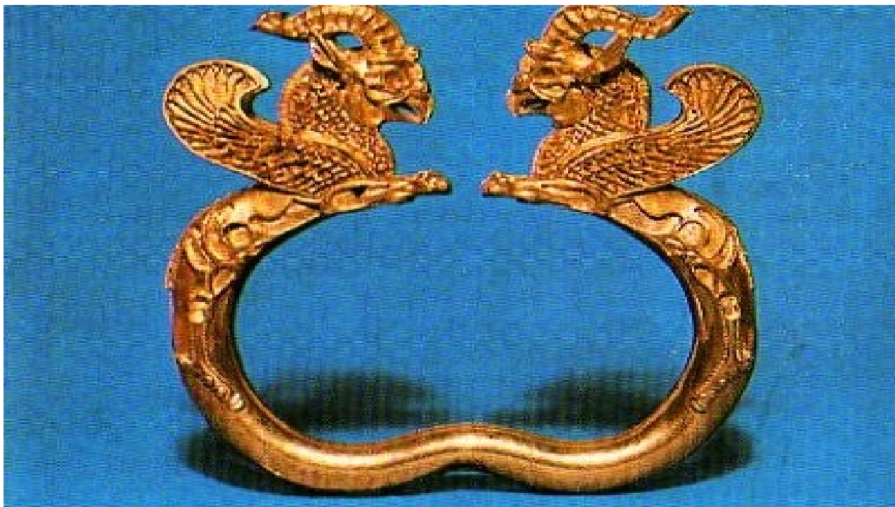
Браслет в «зверином» стиле. V-IV в. до н.э.

"Богатство так называемого "звериного" стиля именно является одним из неутомимо накопленных сокровищ. Как мы говорили, оно не только потребовано какими-то ритуалами. Оно широко разлилось по всей жизни, укрепляя и дальнейшее воображение к подвигам бранным и созидательным. Химера Парижского собора, разве не вспоминает она о пространствах Ордоса или о Тибетских нагорьях, или о безбрежных водных путях Сибири? Когда богато-творческая рука аланов украшала храмы Владимира и Юрьева-Польского, разве эти геральдические грифоны, львы и все узорчатые чудища не являлись как бы тамгою далеких азиатских просторов? В этих взаимных напоминаниях звучат какие-то духовные ручательства, и никакие эпохи не изглаживают исконных путей" 1 .