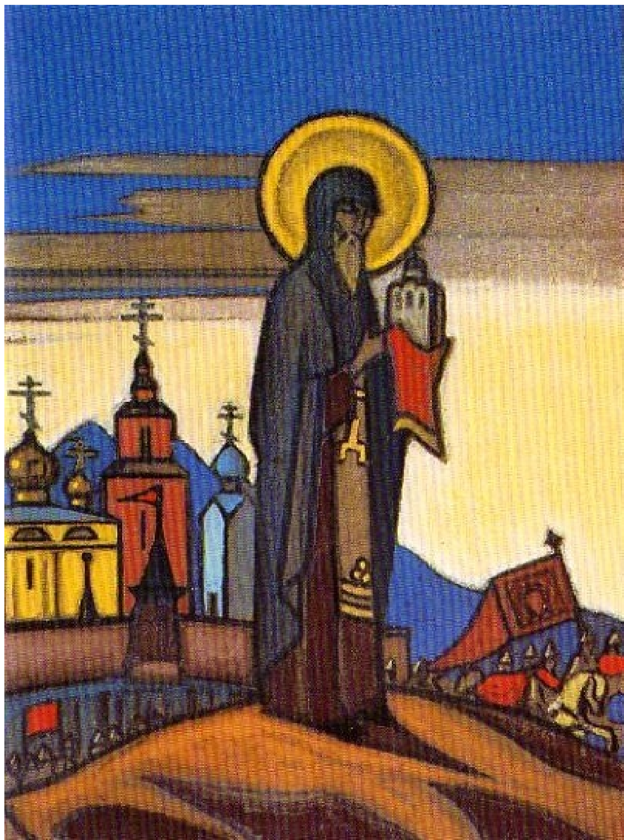
Н.К.Перих «Святой Сергий Радонежский».