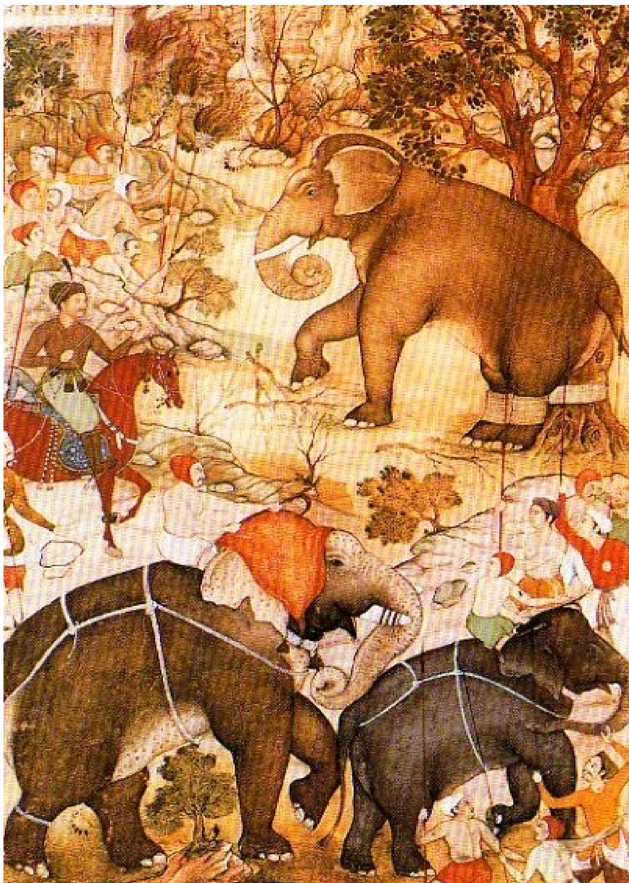
Император Акбар (на лошади) наблюдает за поимкой слонов.