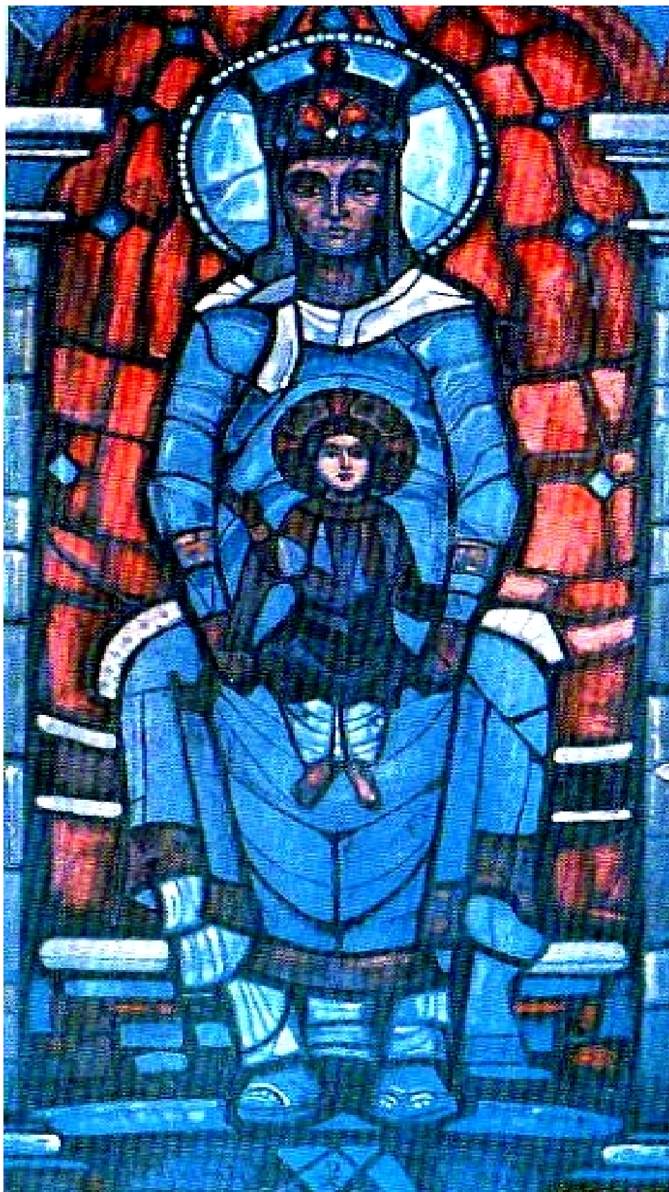
Н.К.Перих Жанна Д'Арк. (Центральная часть триптиха).