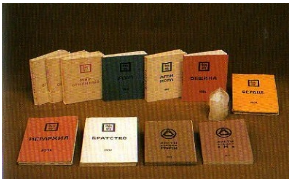
Книги Живой Этики.