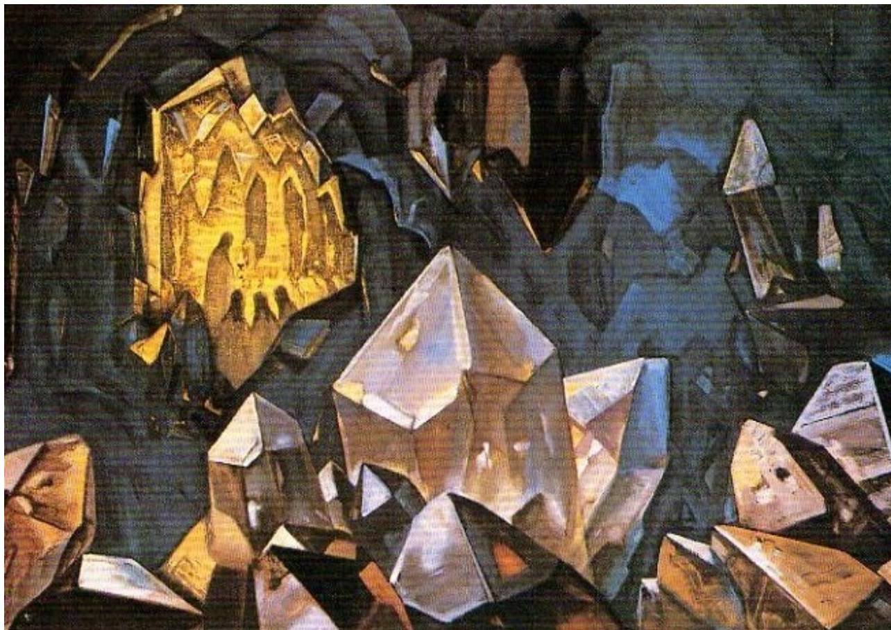
Н.К.Рерих «Сокровище гор».

Таинственный Камень из созвездия Орион, обладавший ритмами творящего Космического Магнита, и сам являлся мощным магнитом. Этот магнит принимал участие не только в эволюционном действии на планете Земля, но и в формировании исторического процесса, энергетика которого была тесно связана с особенностями космической эволюции.