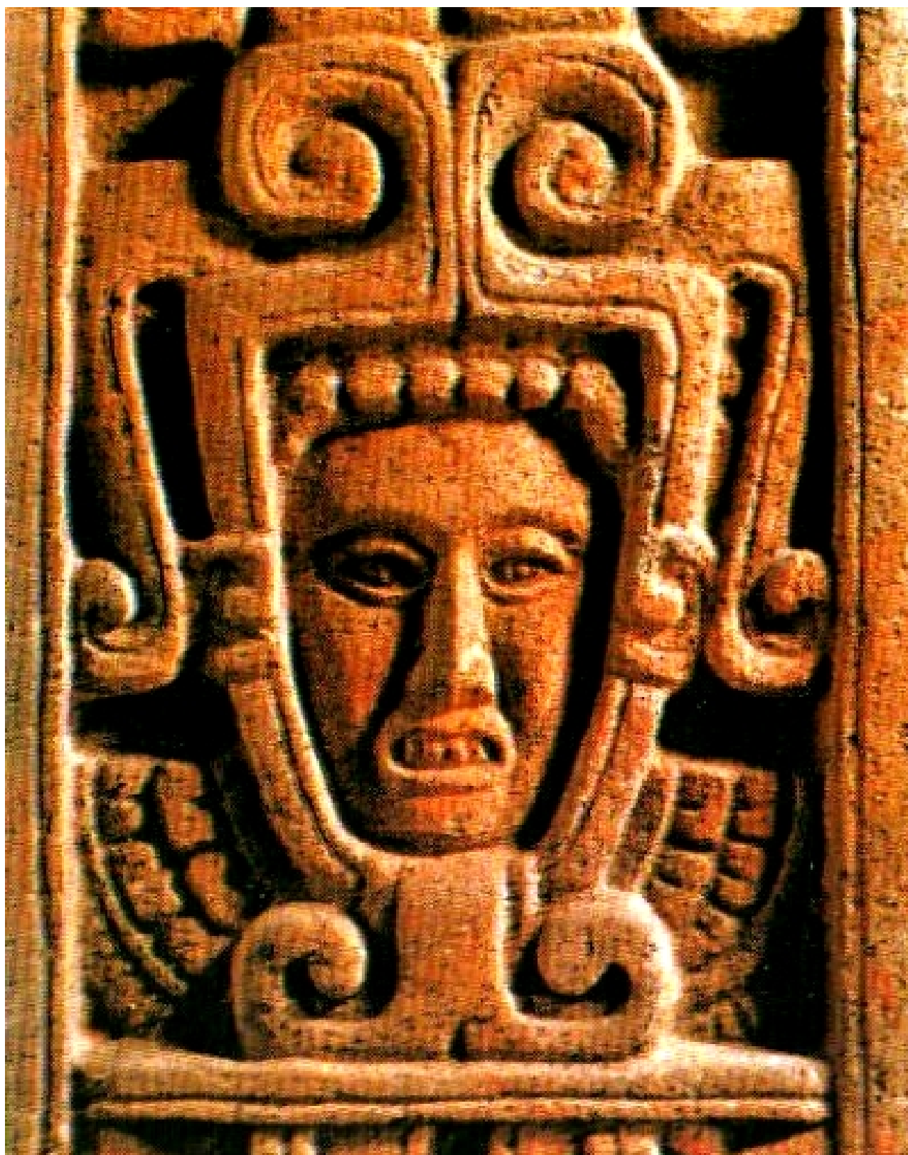
Кецалькоатль. VI-IX в. Национальный Музей Антропологии. Мехико.