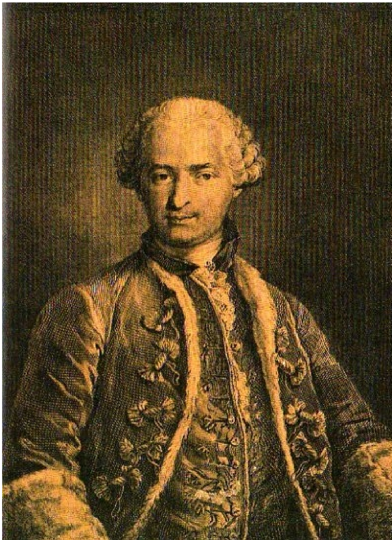
Граф Сен-Жермен (гравюра).