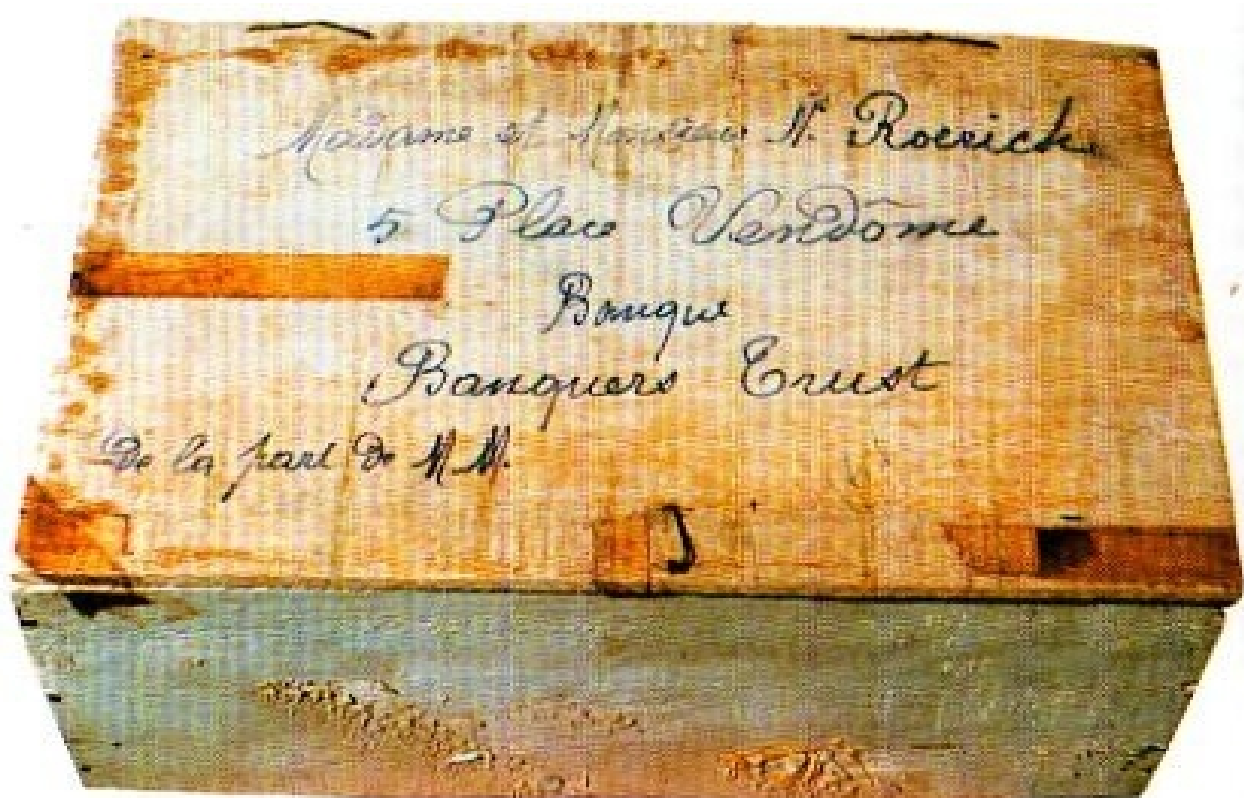
Посылочный ящик с Камнем.