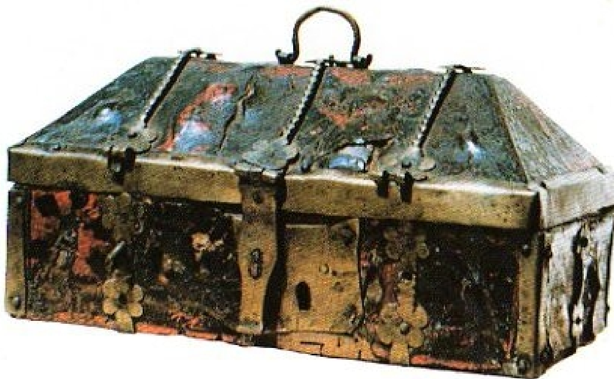
Шкатулка для Камня.