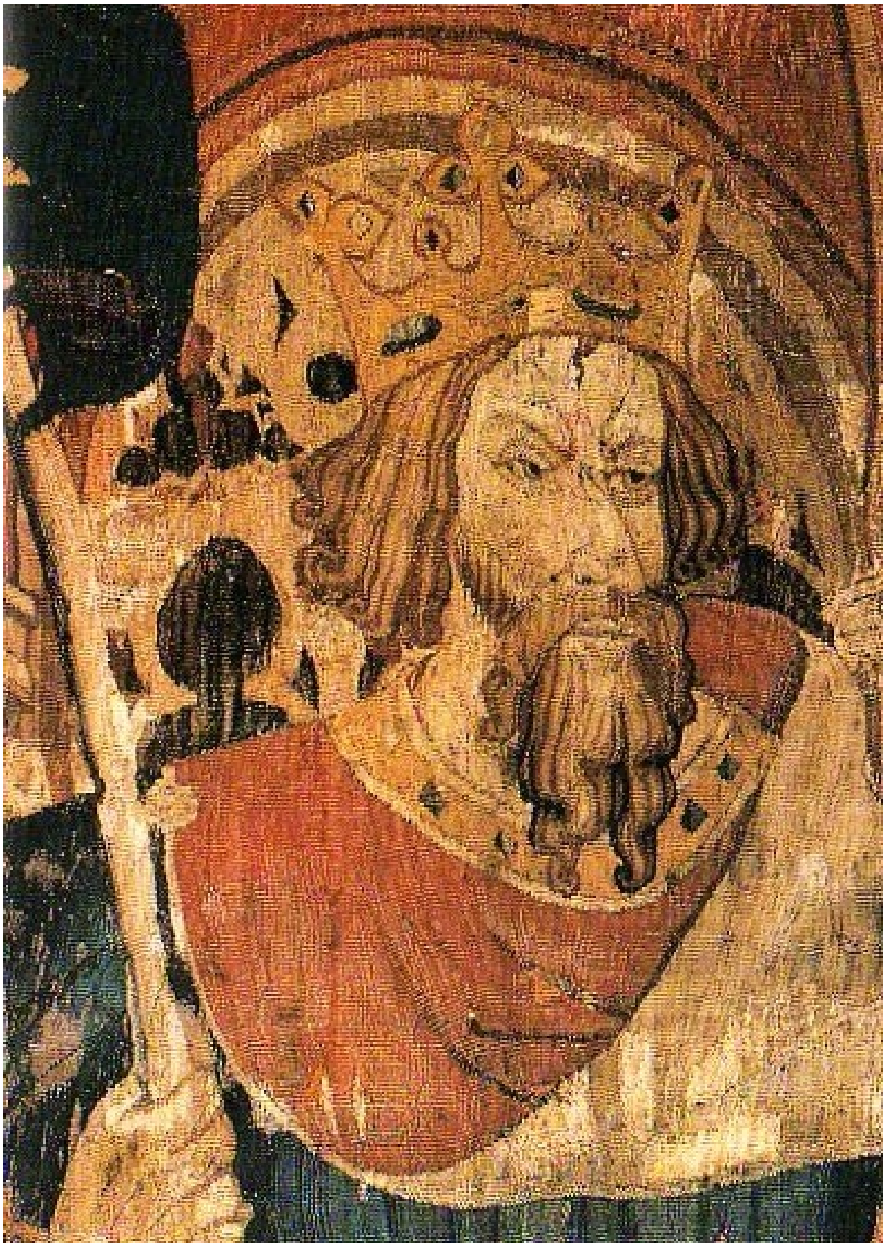
Король Артур (с франц. гобелена XIV в.)