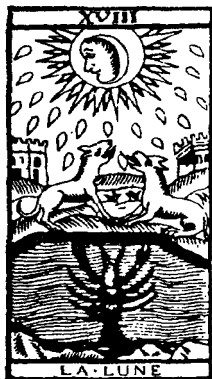
Карта Таро «Луна»

о том, что друг может обернуться врагом, а враг оказаться другом.