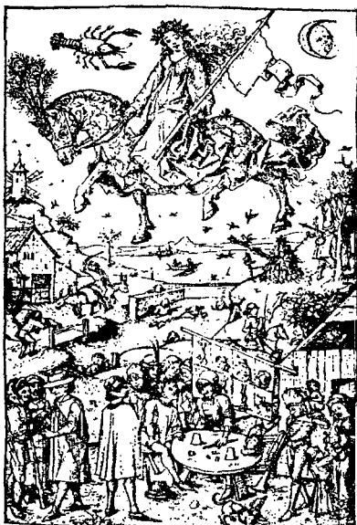
Торжественное шествие богини Луны по небосводу

ство мозга, а современный социальный человек просто утратил эту способность. Поэтому «глупый» снежный человек не ловится «умными» учеными.