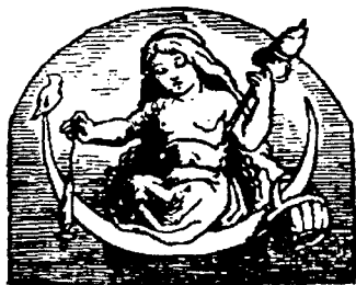
Олицетворение лунного характера

ность, меланхоличность, обидчивость, злопамятность, интерес к тайнам, озабоченность, любопытство, гибкость, умение разбираться в ситуации и