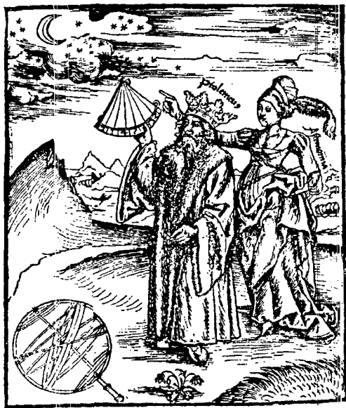
Астролог Птолемей изучает фазы Луны

Луна влияет на облик, характер, эмоциональную жизнь, образ жизни человека. Она подскажет, каким было его детство, дом детства, какой будет собственная семья, личные привязанности, общее состояние здоровья, психический строй души, воображение, интуиция и подсознательные импульсы.