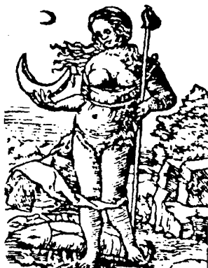
Луна как рубенсовская женщина бальзаковского возраста

мощник. В этом смысле Луна снова является вещью, доступной нашему разумению.